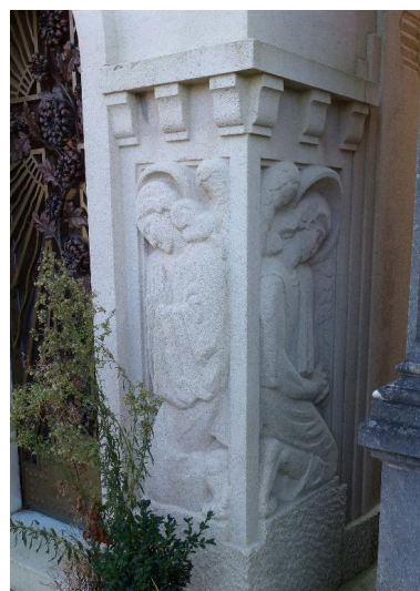
Vue de détail des sculptures (angle nord-ouest) IVR22_20168006405NUCA