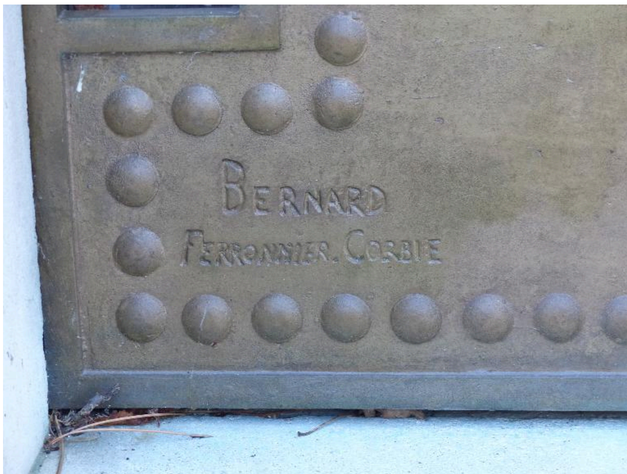
Vue de détail de la signature du ferronnier Bernard de Corbie.