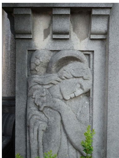
Détail du décor sculpté.