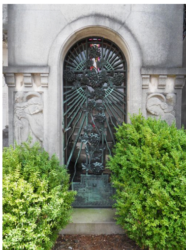
Vue de détail de la porte.