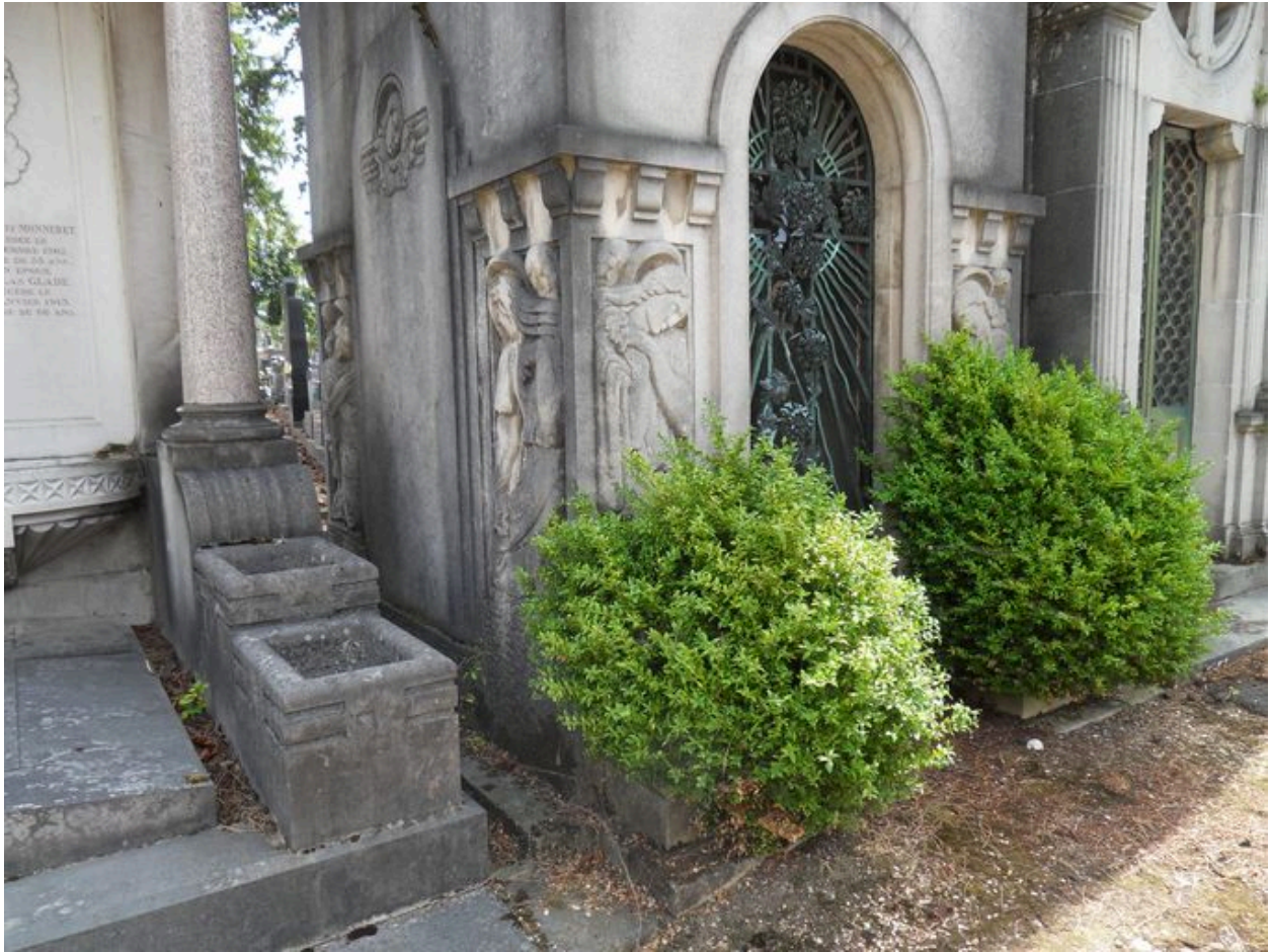
Vue de détail du décor sculpté.