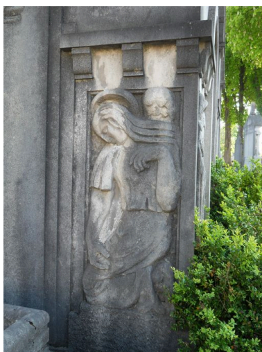
Détail du décor sculpté.