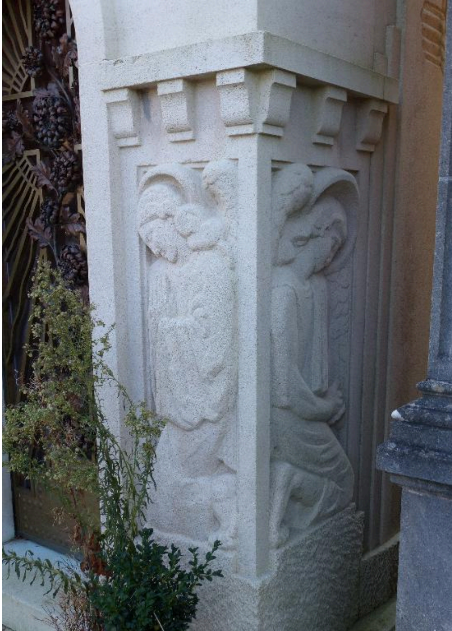
Vue de détail des sculptures (angle nord-ouest)