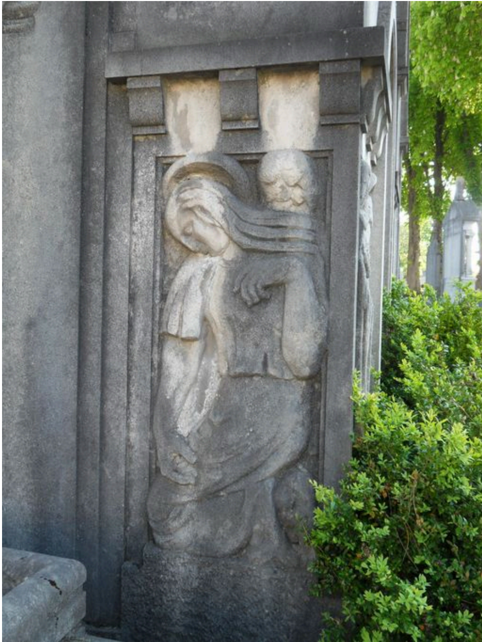
Détail du décor sculpté.