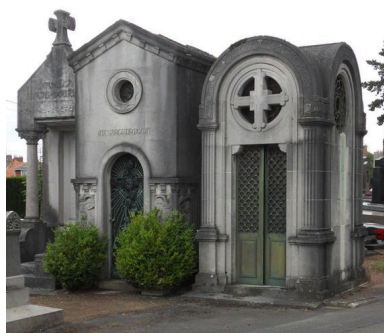
Vue de situation, tombeau à gauche de l'image. IVR22_20118010041NUCA