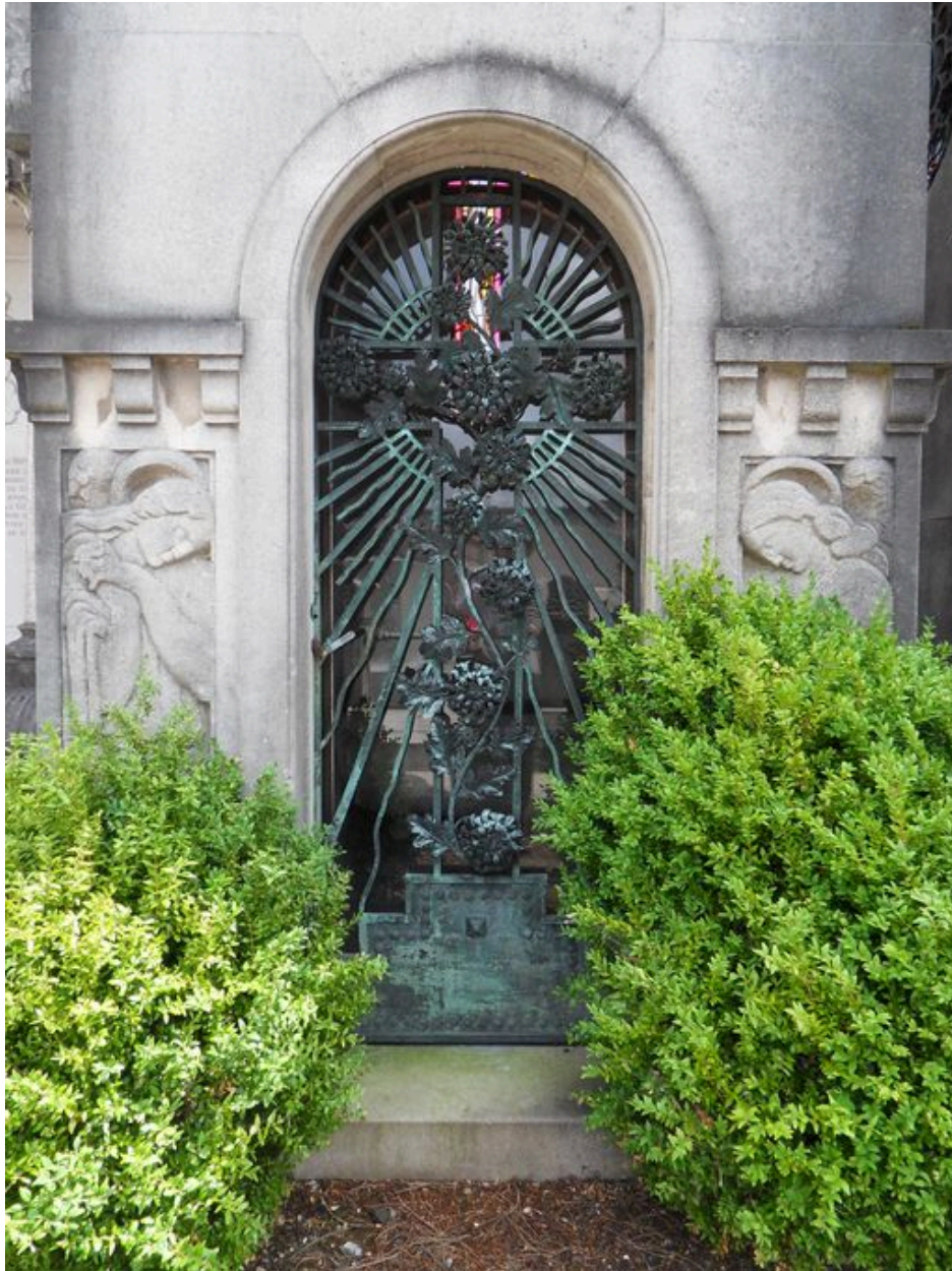
Vue de détail de la porte.