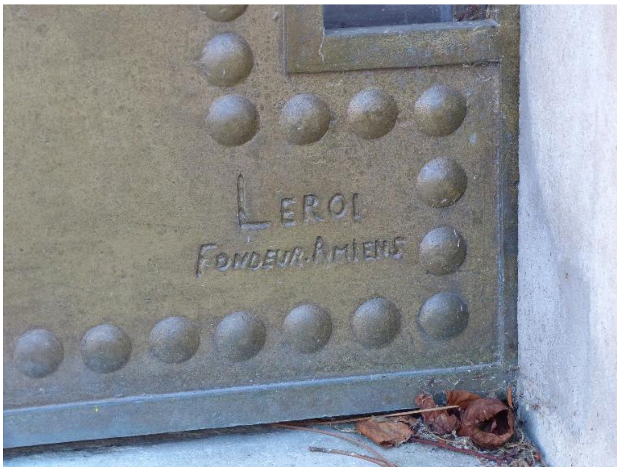
Vue de détail de la signature du fondeur Leroi d'Amiens.