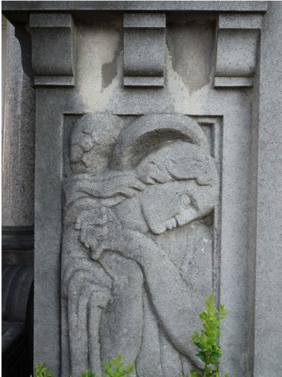
Détail du décor sculpté.