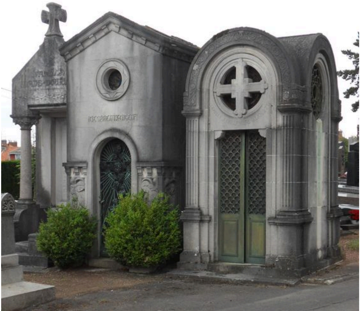
Vue de situation, tombeau à gauche de l'image.