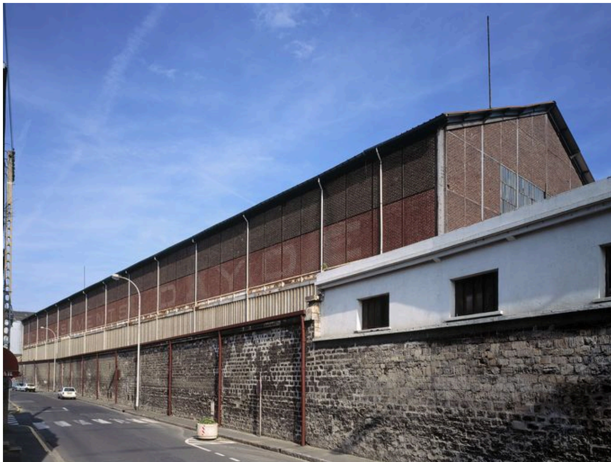
Halle de montage des ateliers Daydé-Pillé (Creil).