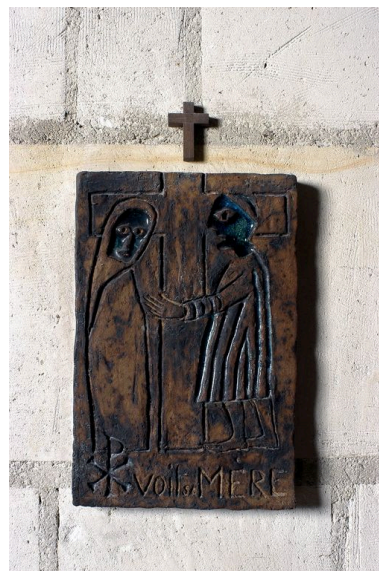
Station du chemin de croix. IVR22_20068000567NUCA