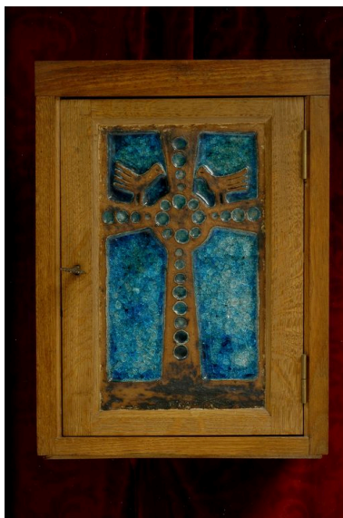
Tabernacle.