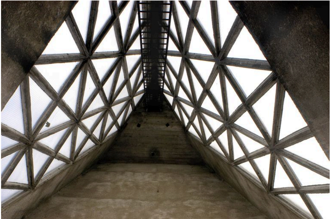
Vue intérieure de la flèche.