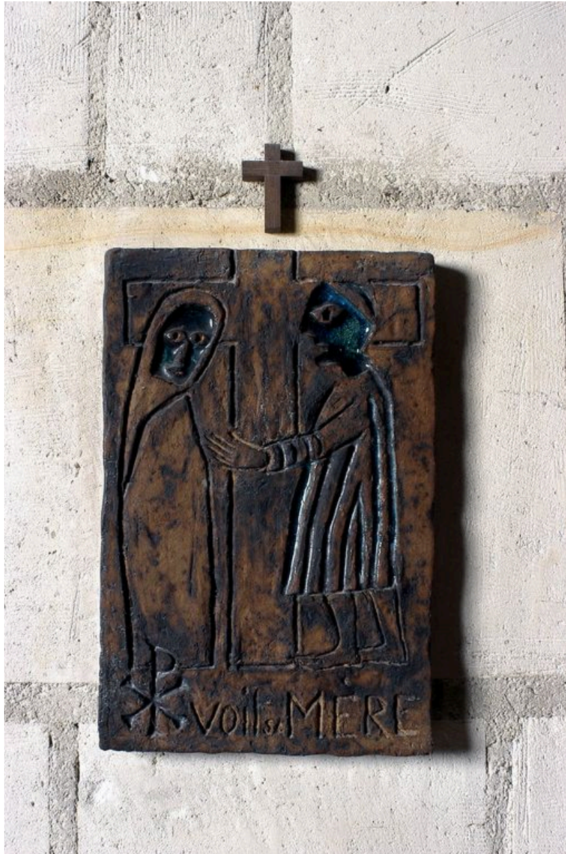
Station du chemin de croix.