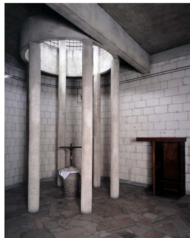
Vue intérieure : la chapelle des Fonts. IVR22_20068000537VA