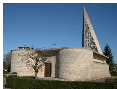
Vue depuis le sud-est. IVR22_20048010454NUCA