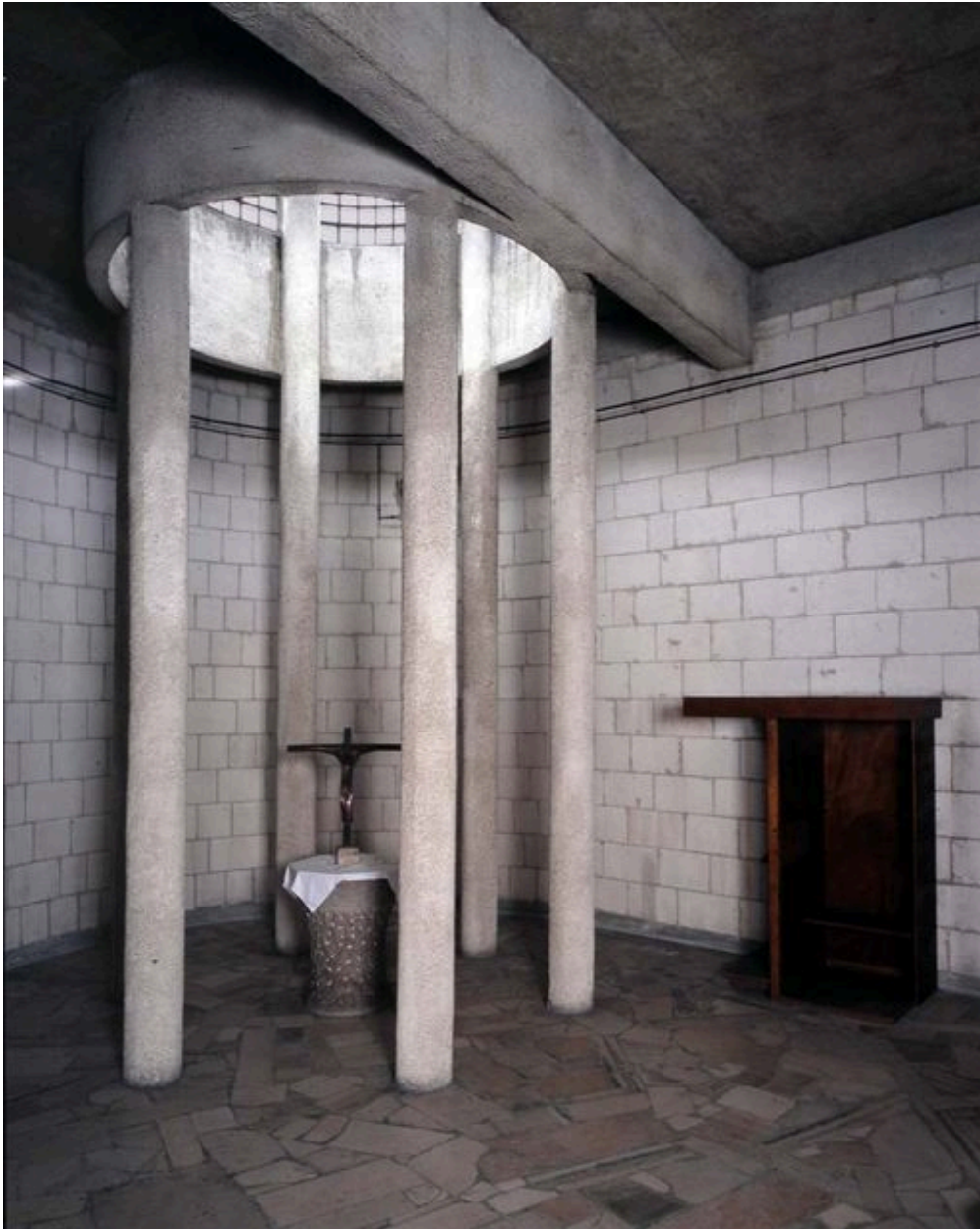
Vue intérieure : la chapelle des Fonts.