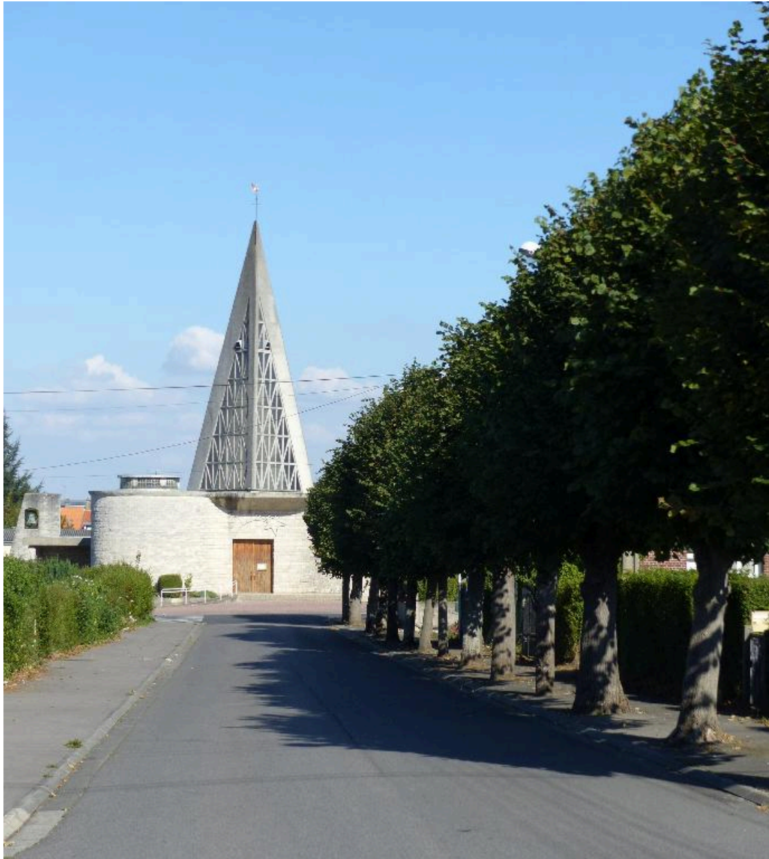
Vue de situation, dans la perspective de la rue du Général-De Gaulle.