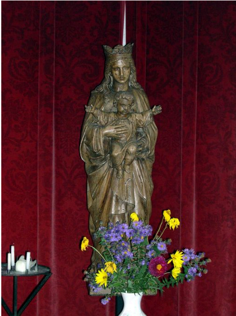
Vierge à l'Enfant.