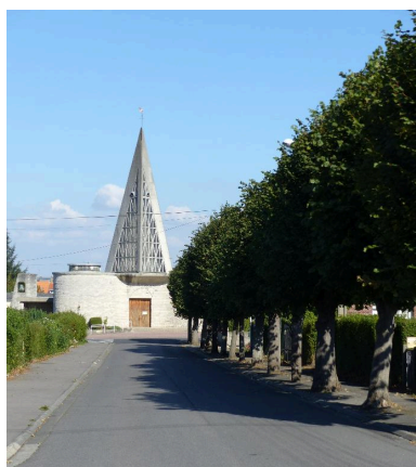
Vue de situation, dans la perspective de la rue du Général-De Gaulle.

IVR32_20168006239NUCA