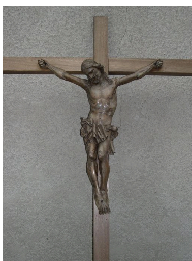
Christ en croix.