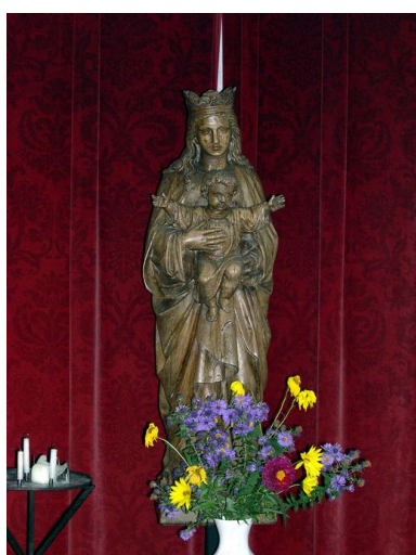
Vierge à l'Enfant.