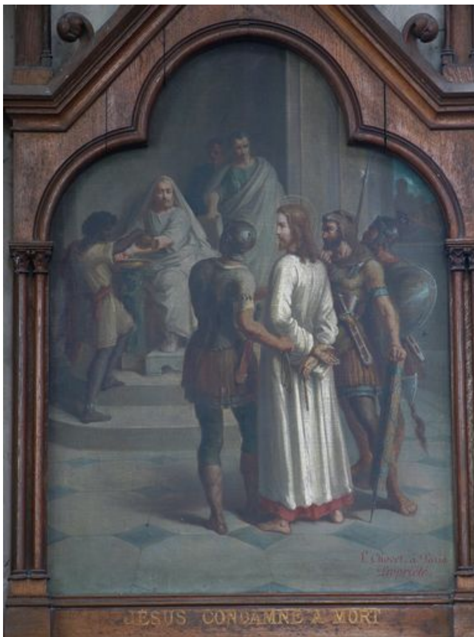
1ère station (bas-côté nord)