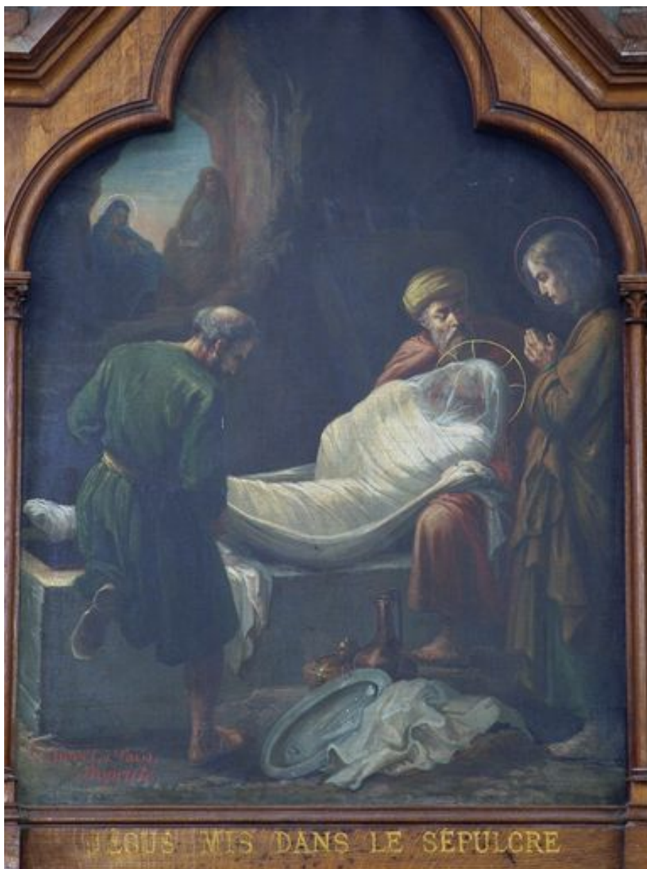
14e station (bas-côté sud)