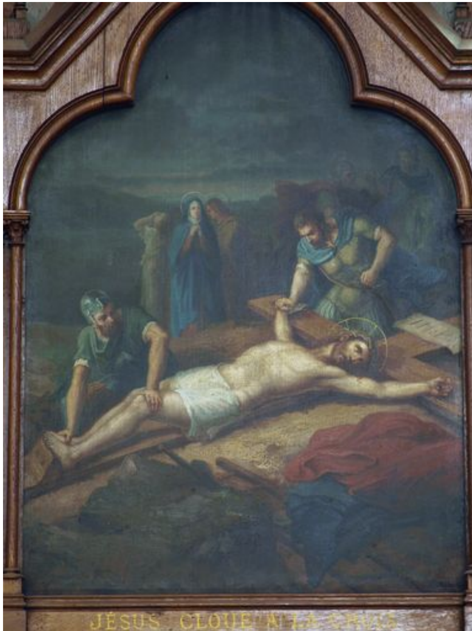
11e station (bas-côté sud)