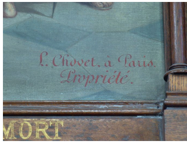
Détail : signature au bas de la 1ère station.