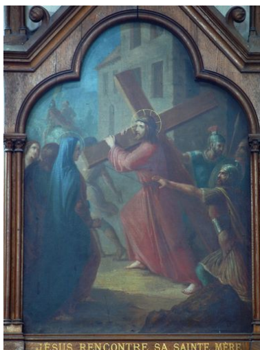
4e station (bas-côté nord) IVR31_20106202820NUCA