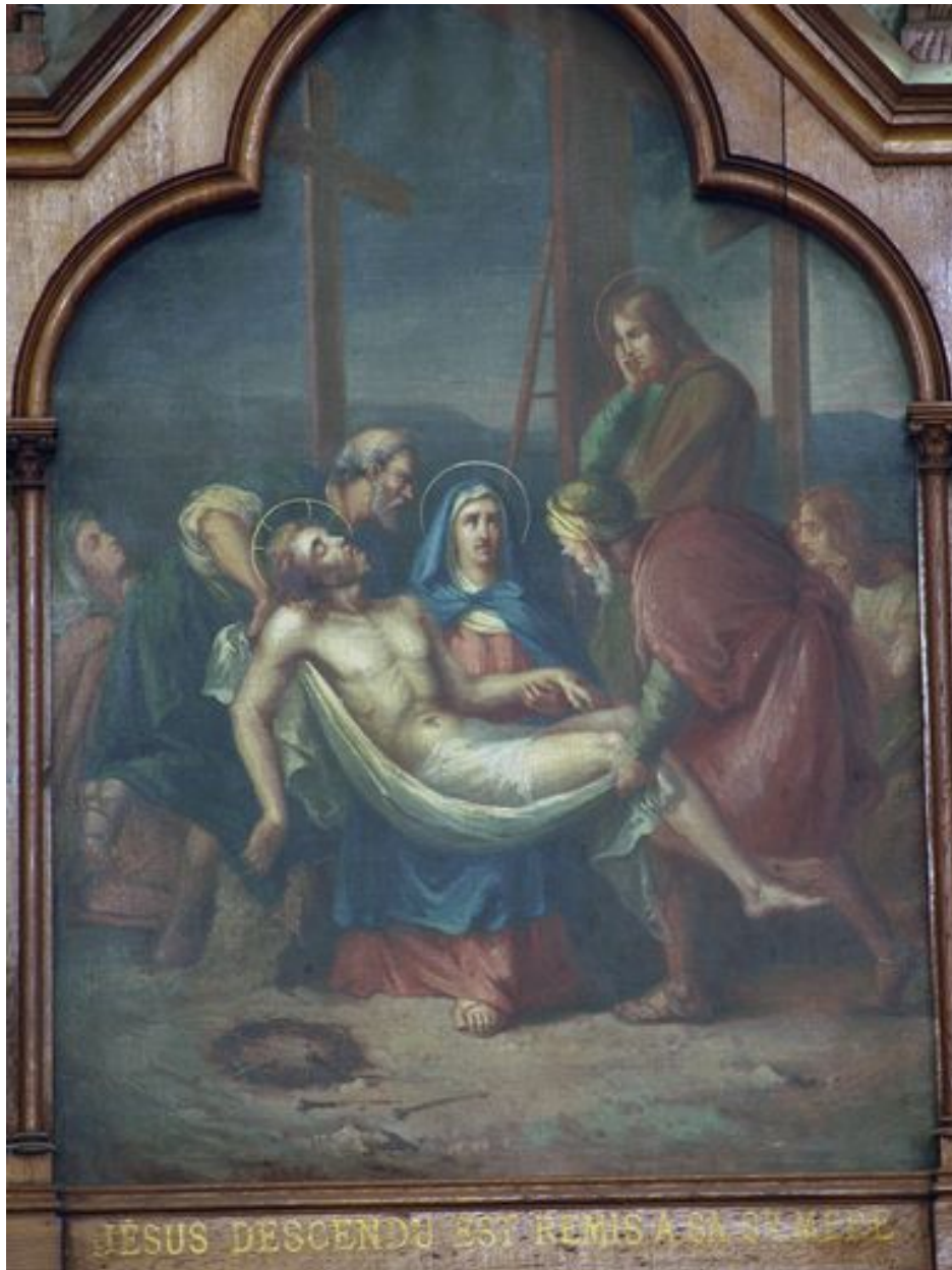
13e station (bas-côté sud)