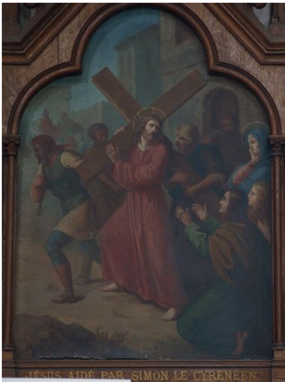
5e station (bas-côté nord)