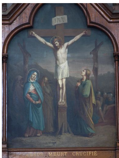
12e station (bas-côté sud) IVR31_20106202828NUCA