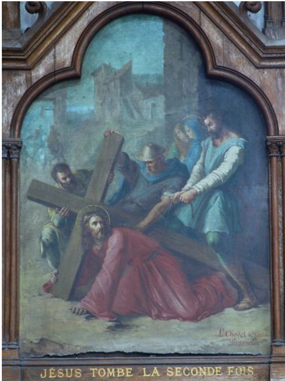
7e station (bas-côté nord)