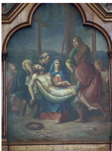
13e station (bas-côté sud)