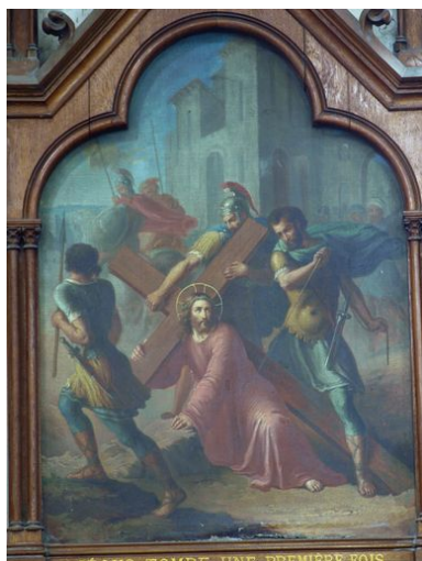
3e station (bas-côté nord) IVR31_20106202819NUCA