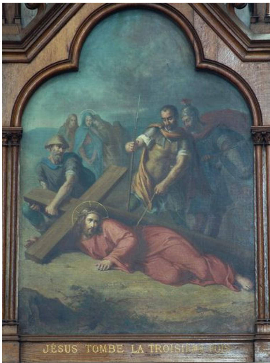
9e station (bas-côté sud)