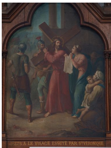
6e station (bas-côté nord) IVR31_20106202822NUCA