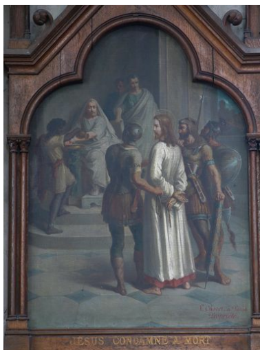
1ère station (bas-côté nord) IVR31_20106202816NUCA