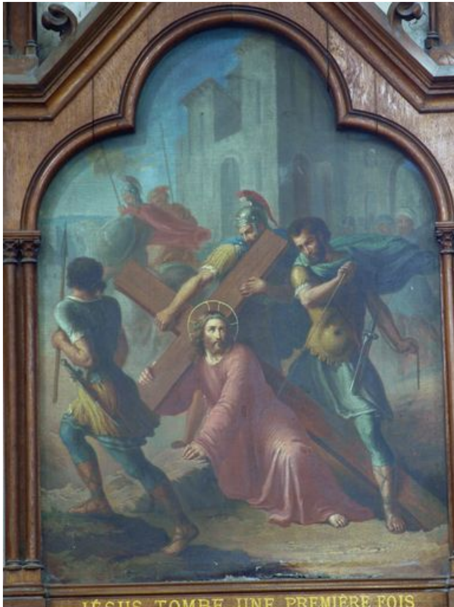
3e station (bas-côté nord)