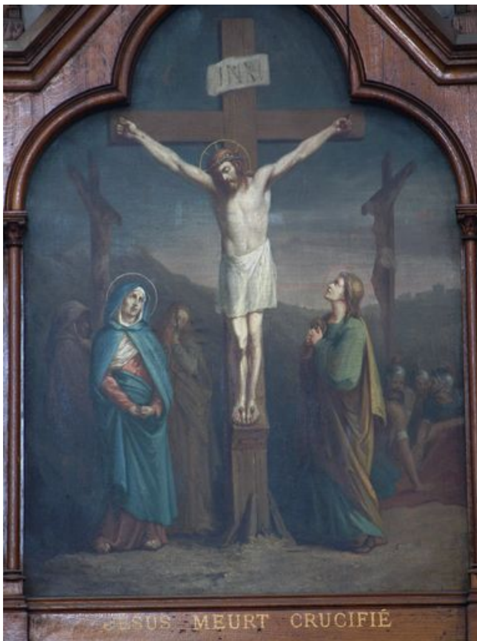
12e station (bas-côté sud)