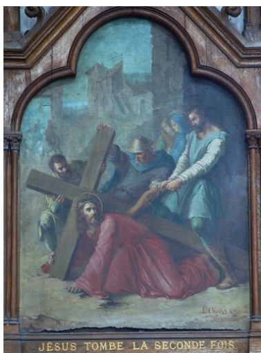
7e station (bas-côté nord) IVR31_20106202823NUCA