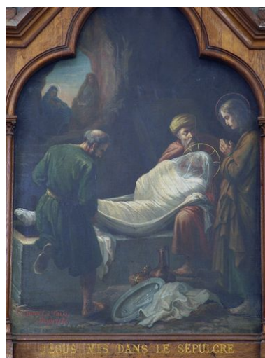
14e station (bas-côté sud)