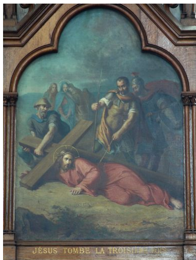
9e station (bas-côté sud) IVR31_20106202825NUCA