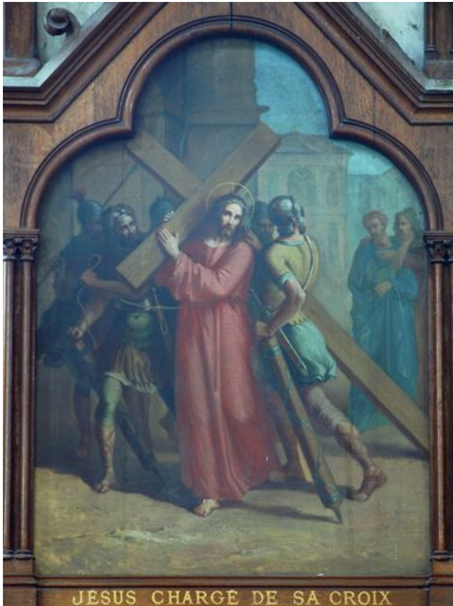
2e station (bas-côté nord)