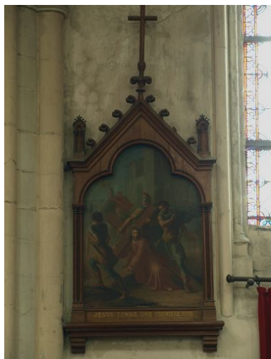
Vue générale, avec cadre (3e station) IVR31_20106202815NUCA