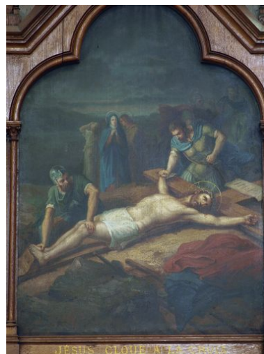
11e station (bas-côté sud)