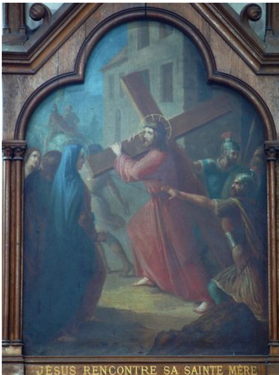
4e station (bas-côté nord)