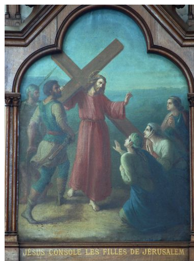
8e station (bas-côté sud) IVR31_20106202824NUCA