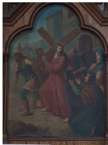
5e station (bas-côté nord) IVR31_20106202821NUCA