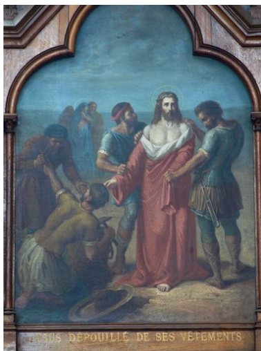
10e station (bas-côté sud) IVR31_20106202826NUCA