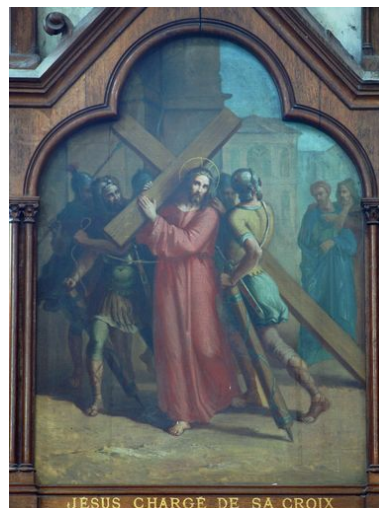
2e station (bas-côté nord) IVR31_20106202818NUCA