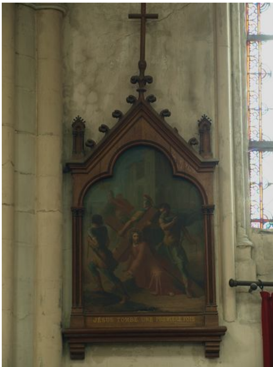
Vue générale, avec cadre (3e station)