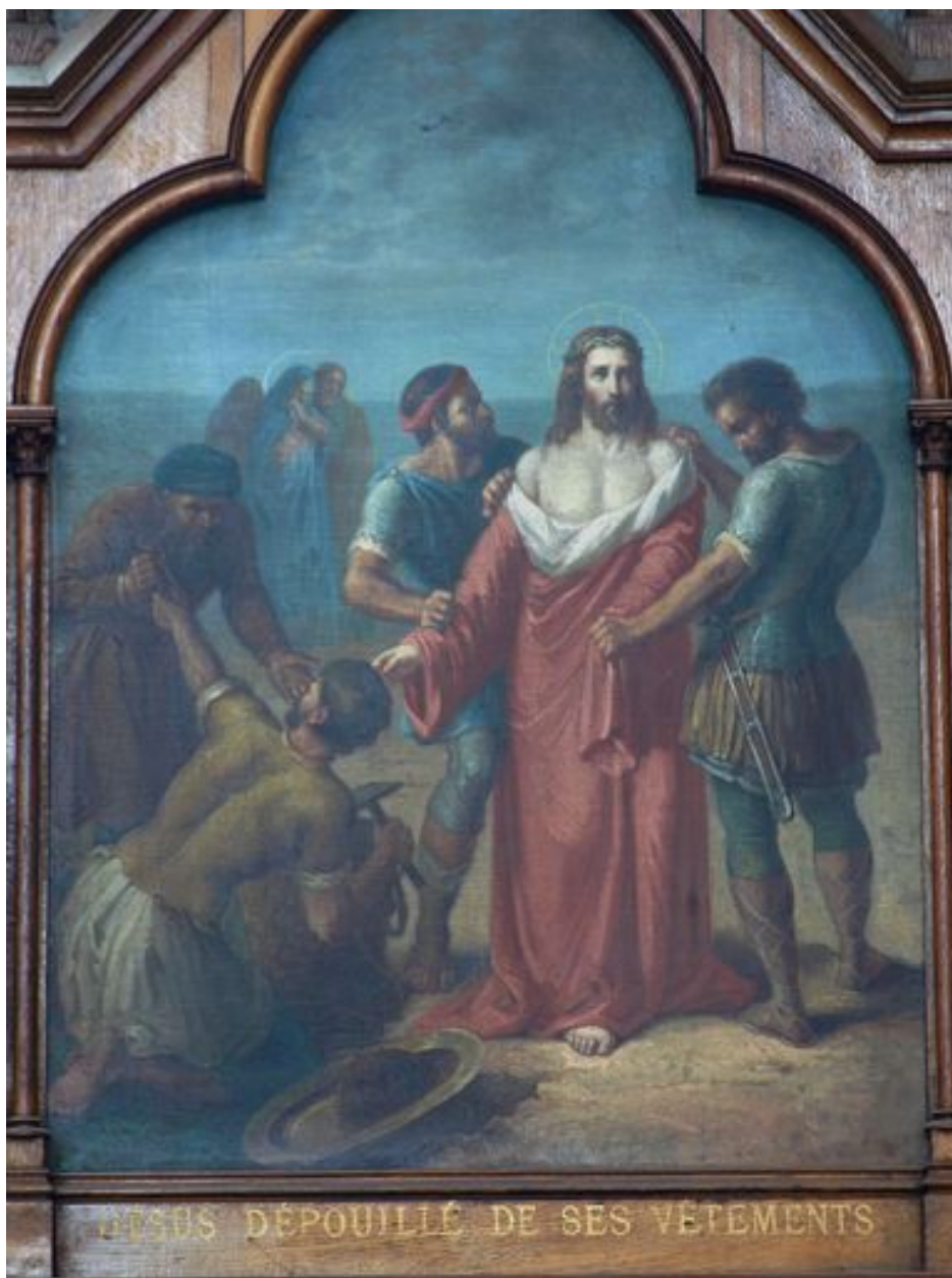
10e station (bas-côté sud)