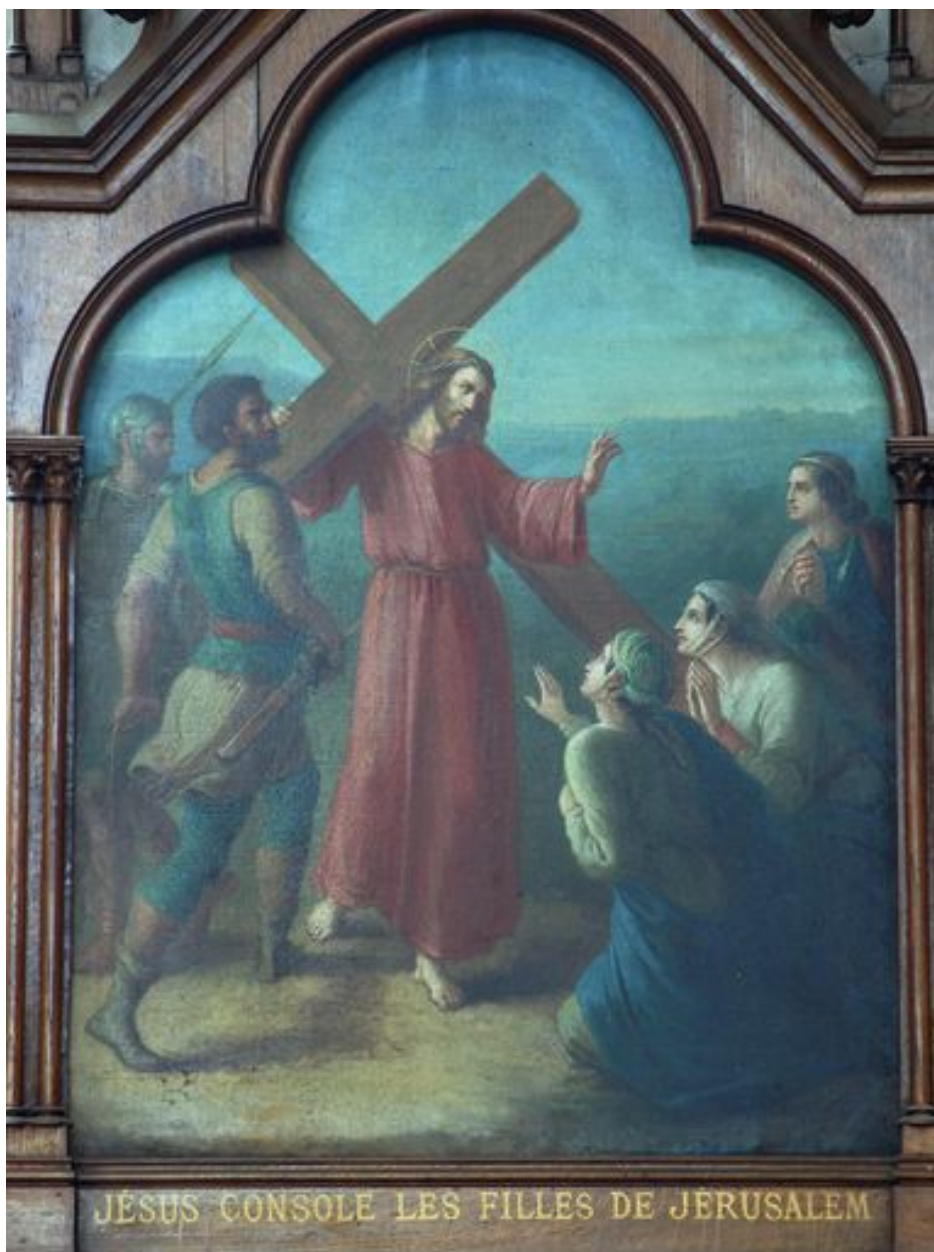
8e station (bas-côté sud)