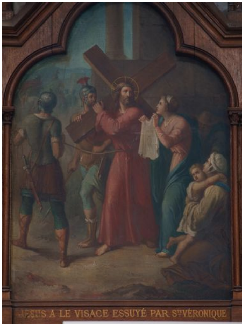
6e station (bas-côté nord)