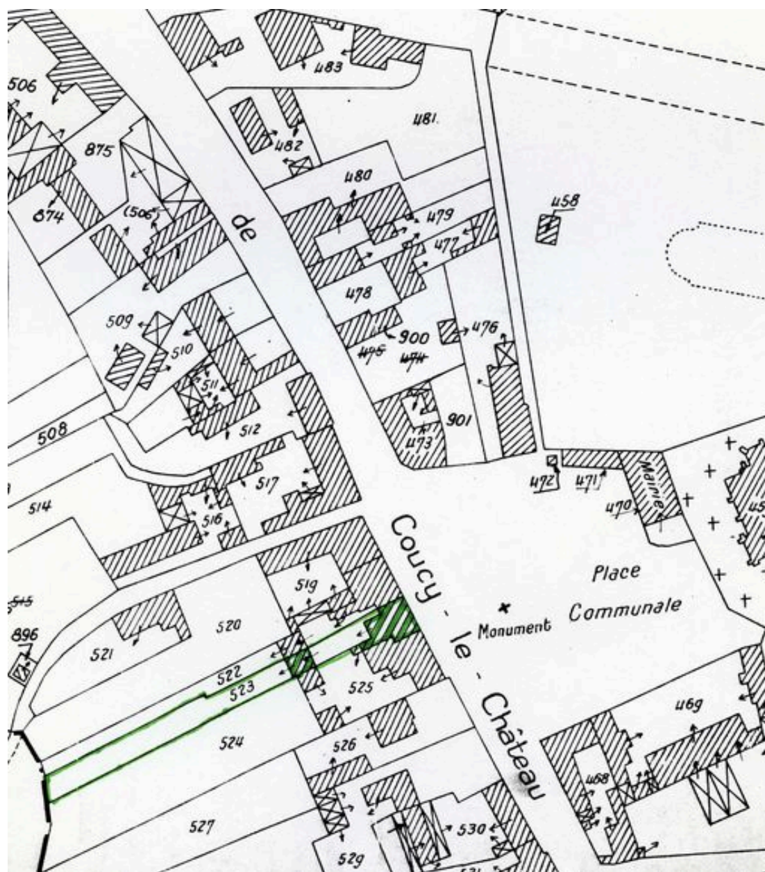
Plan de situation. Extrait du plan cadastral de 1962, section C2 523.