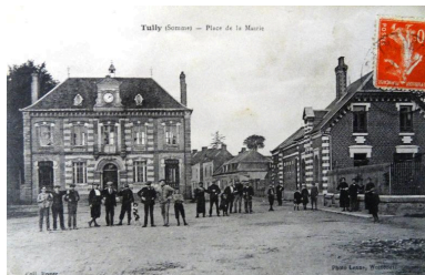
Place de la mairie, vers 1910 (coll. part.). IVR22_20148005047NUC2A