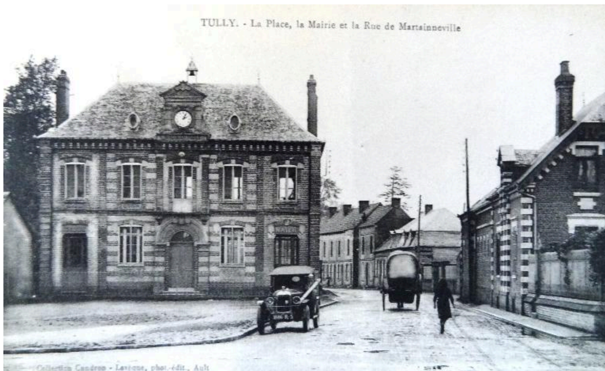
La place, la mairie et la rue de Martainneville, vers 1910.