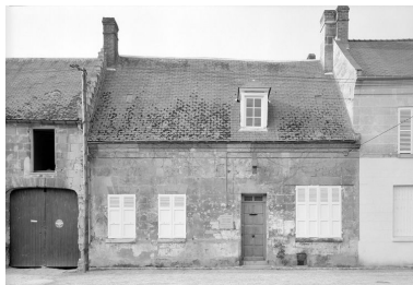
Elévation antérieure. IVR22_19856000796X