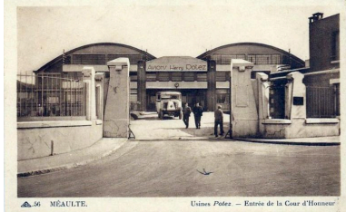
Entrée de la cour d'honneur de l'usine Potez, vers 1930 (coll.part.).

Phot. Fournier Bertrand (reproduction) IVR32_20168006462NUC