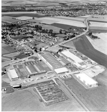
Vue aérienne, flanc sud-est.

Phot. Fournier Bertrand (reproduction) IVR32_20168006462NUC