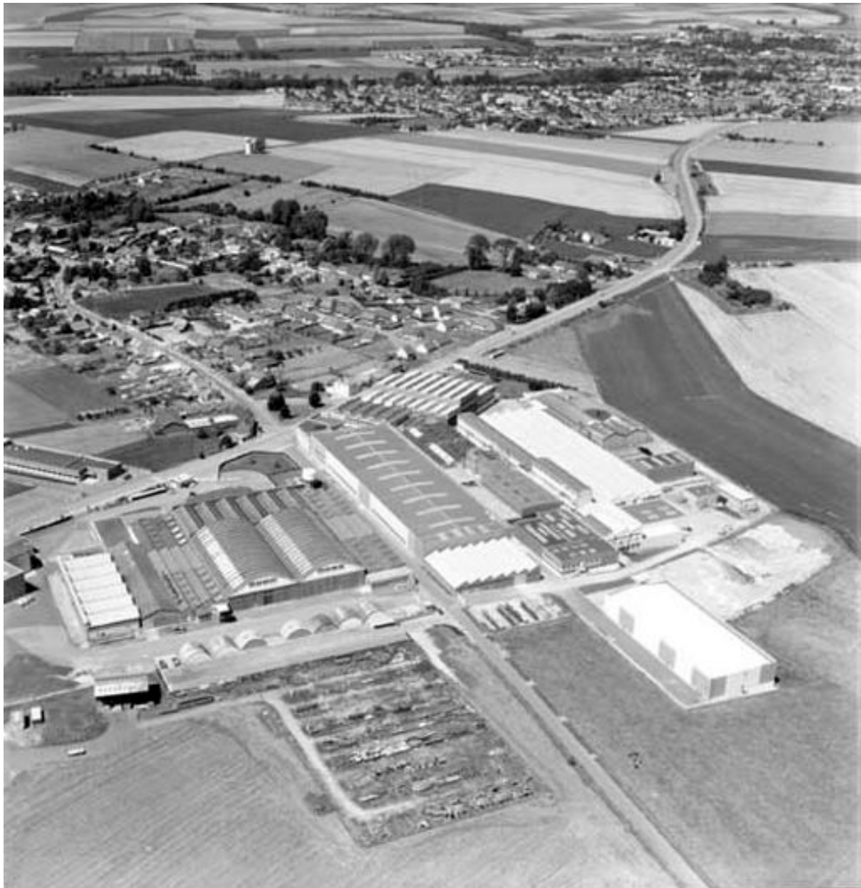
Vue aérienne, flanc sud-est.