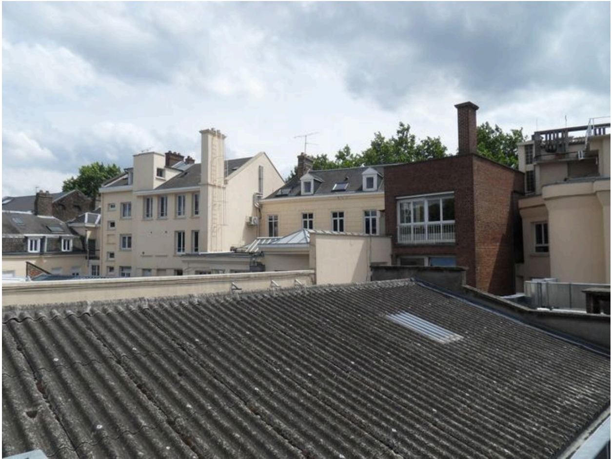
Façades arrières, depuis les salles des commissions.