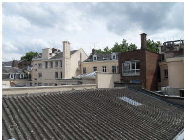
Façades arrières, depuis les salles des commissions.