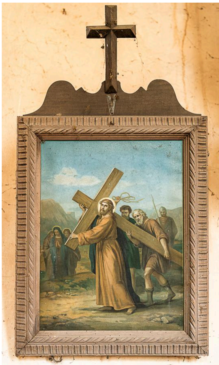
Station 5 du chemin de croix : Simon le Cyrénéen aide Jésus à porter sa croix, impression sur carton, 1er quart du 20e siècle.