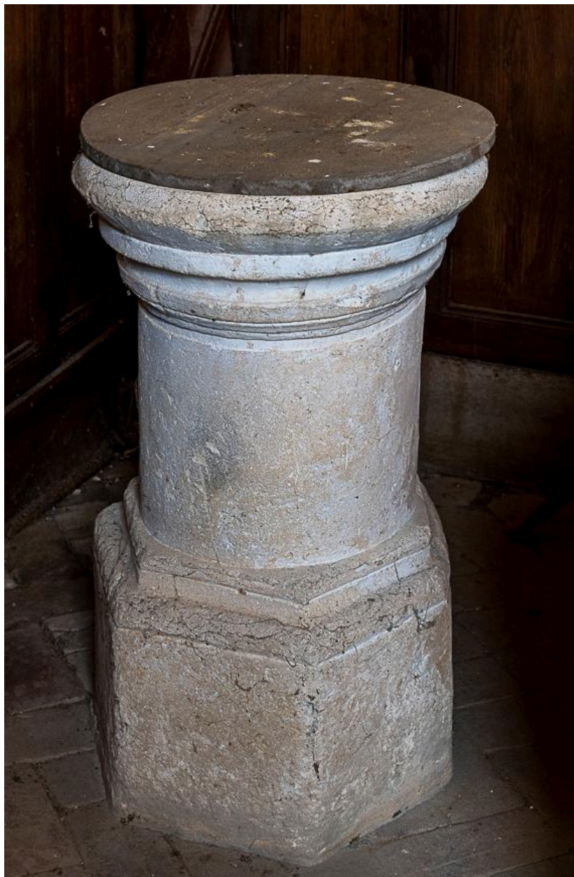
Fonts baptismaux, pierre, 17e siècle (?).