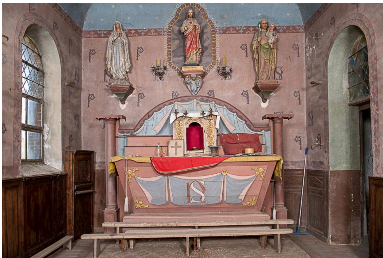
Vue générale du chœur.