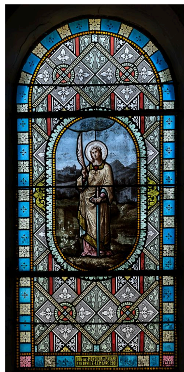
Verrière figurée et grisaille (baie 3) : sainte Philomène, atelier Tallon à Saint-Quentin, 1901.