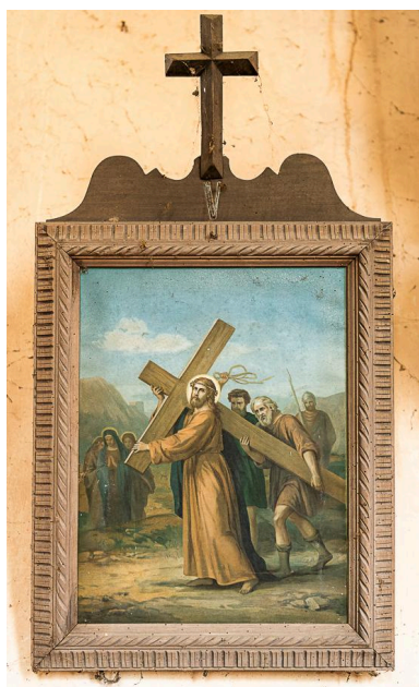
Station 5 du chemin de croix : Simon le Cyrénéen aide Jésus à porter sa croix, impression sur carton, 1er quart du 20e siècle. IVR32_20226000234NUCA