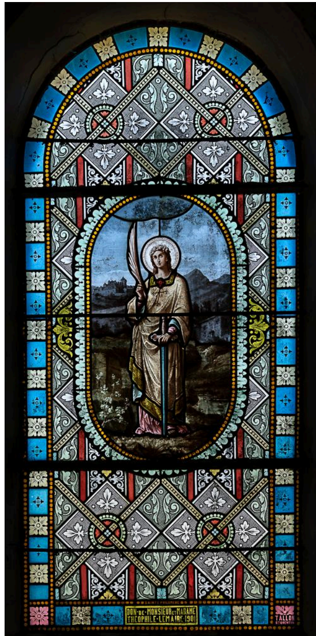
Verrière figurée et grisaille (baie 3) : sainte Philomène, atelier Tallon à Saint-Quentin, 1901.