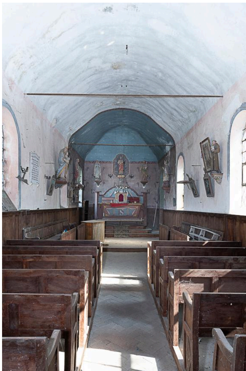
Vue générale vers le chœur.