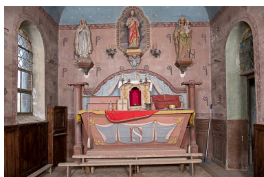
Vue générale du chœur. IVR32_20226000231NUCA