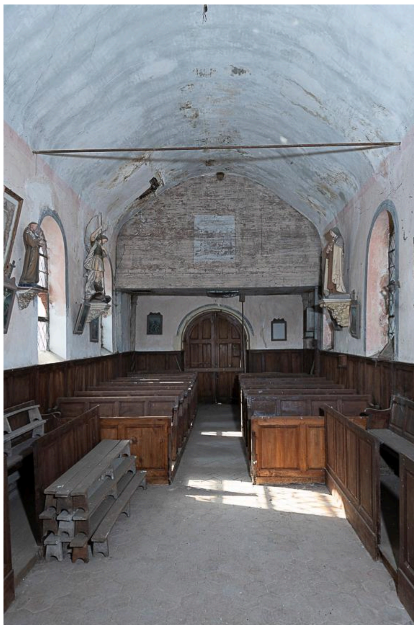
Vue générale vers la nef.