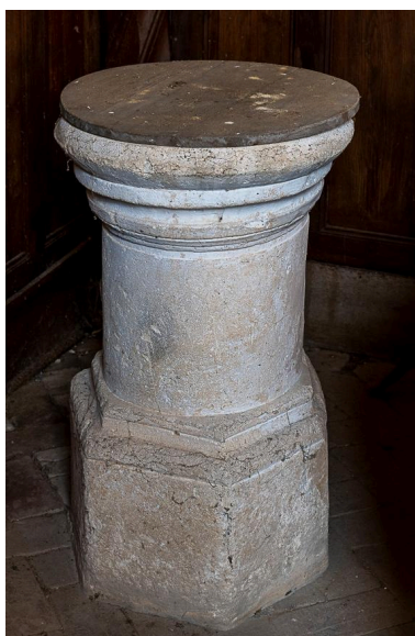
Fonts baptismaux, pierre, 17e siècle (?).