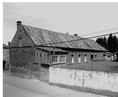
Vue depuis la rue de l'élévation postérieure du logis et de son mur pignon.