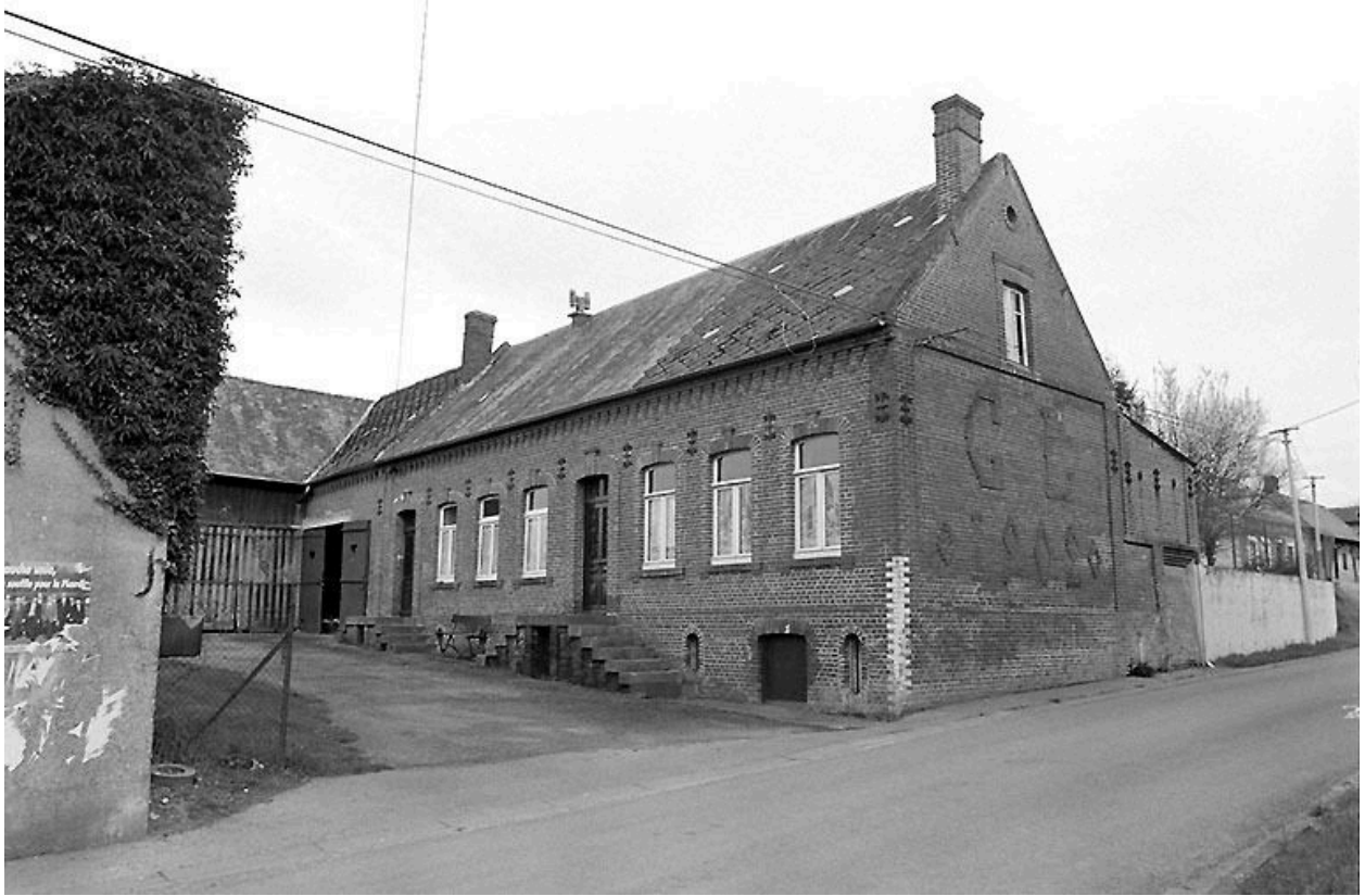
Vue du logis depuis le nord-est.