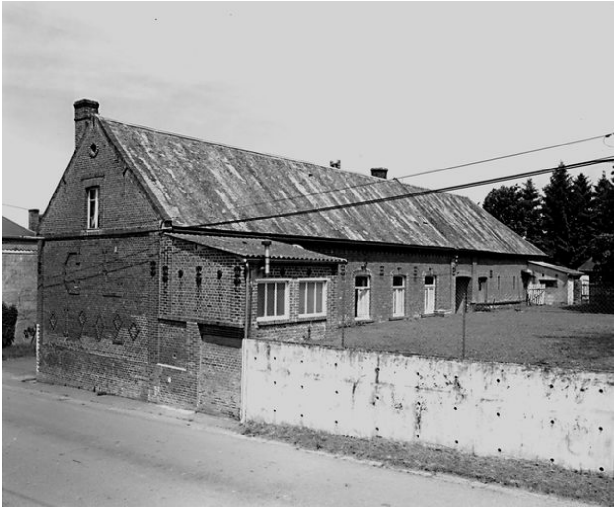
Vue depuis la rue de l'élévation postérieure du logis et de son mur pignon.