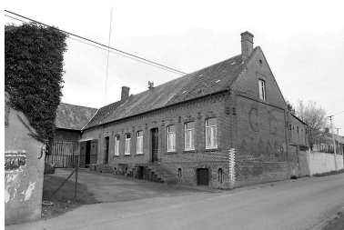
Vue du logis depuis le nord-est.