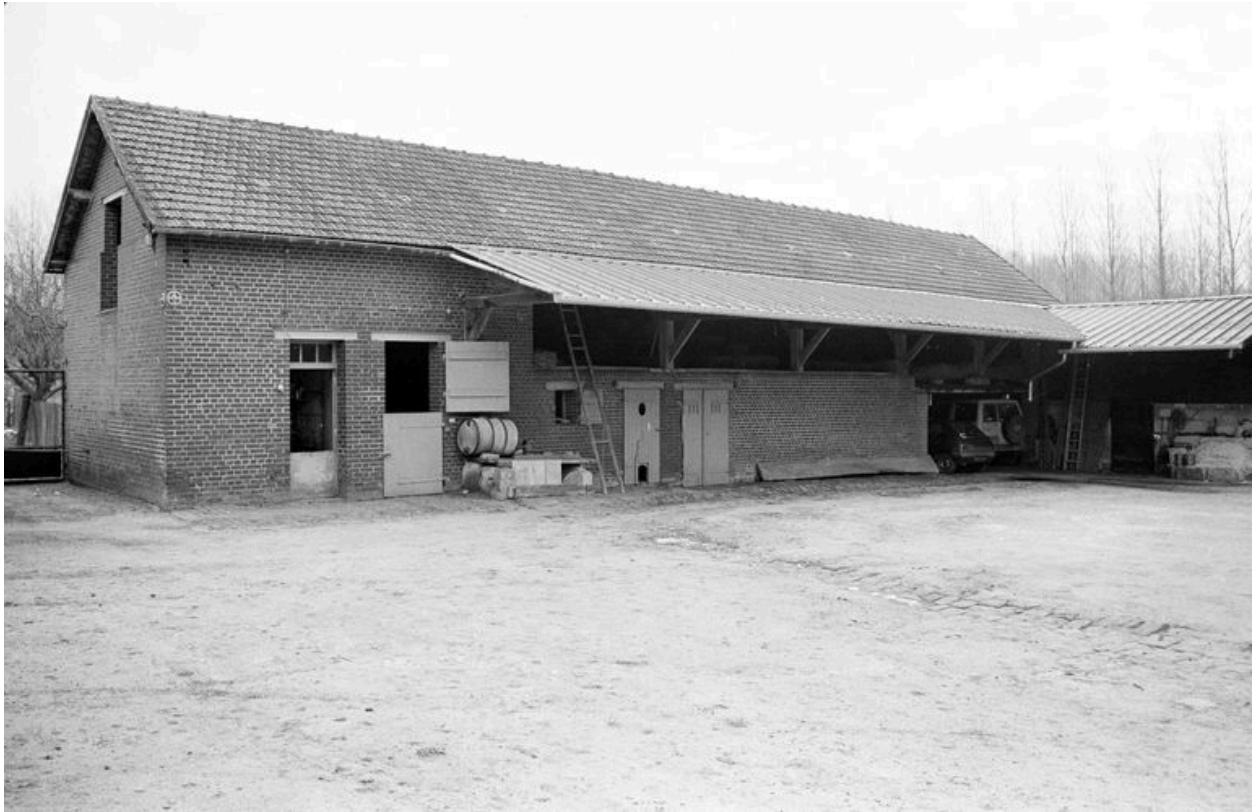
Ecurie et étable.