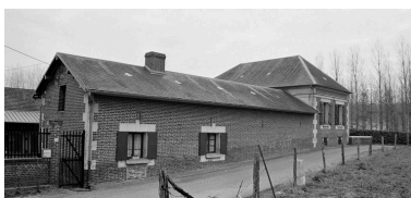
Maison d'habitation du moulin : façade sur rue. IVR22_20006000100Z