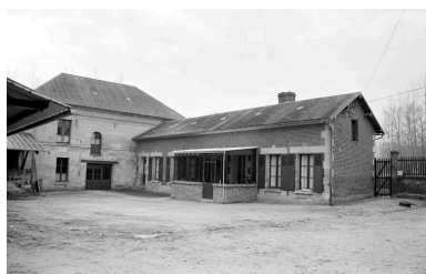
Maison d'habitation en brique et atelier de fabrication en retour construit en pierre : façades sur cour. IVR22_20006000105Z