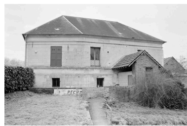
Atelier de fabrication doté de la cage de l'ancien moulin : façade postérieure. IVR22_20006000109Z