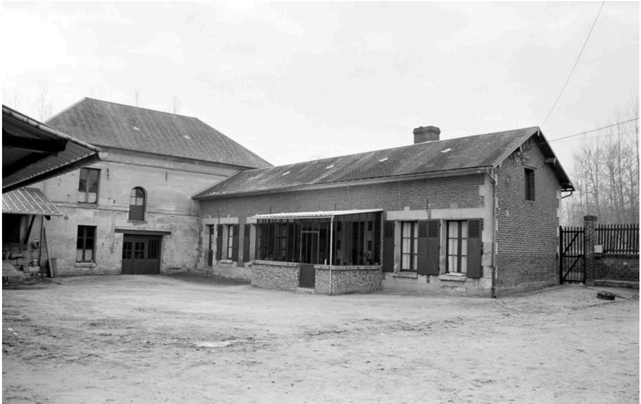
Maison d'habitation en brique et atelier de fabrication en retour construit en pierre : façades sur cour.