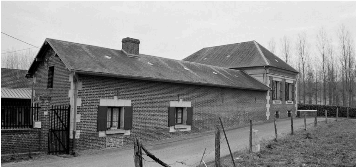
Maison d'habitation du moulin : façade sur rue.