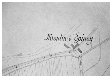
Plan du moulin d'Espinoy à Evricourt, sur le cours de la Divette, 1864 (AD Oise ; 7 Sp 246).