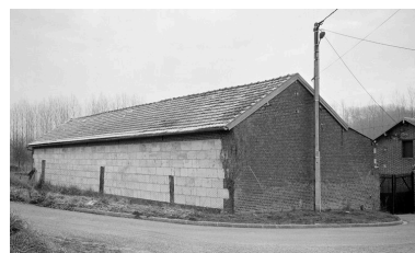
Remise agricole : façade sur rue. IVR22_20006000101Z