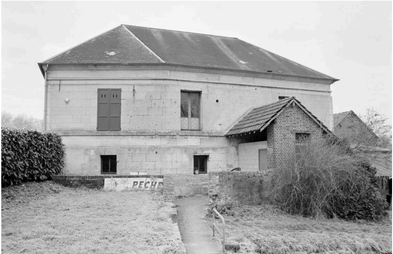
Atelier de fabrication doté de la cage de l'ancien moulin : façade postérieure.