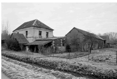
Vue générale. IVR22_20006000108Z