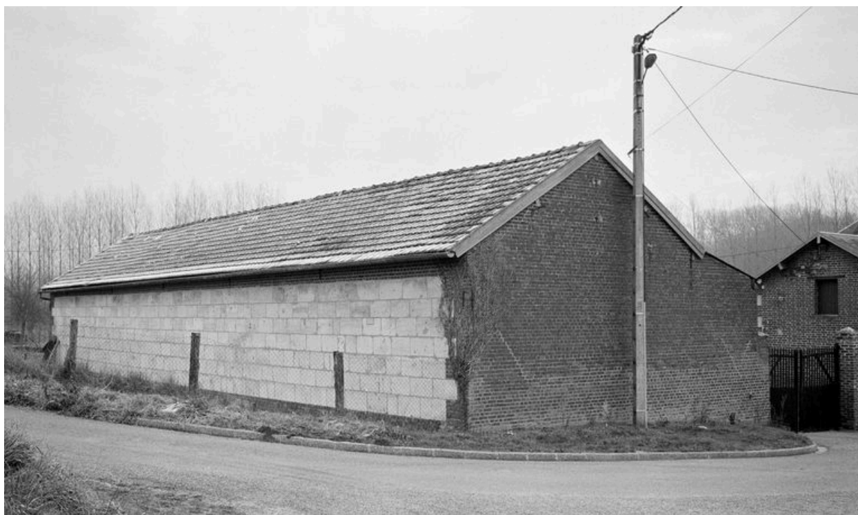
Remise agricole : façade sur rue.