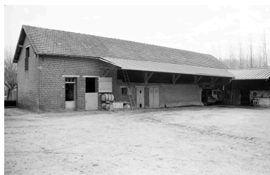
Ecurie et étable. IVR22_20006000106Z