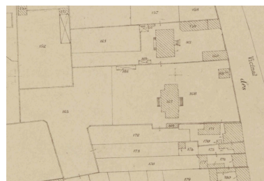
Extrait du cadastre de 1933. Section C1, parcelles 165 à 169 (AD Somme ; 73W_CP_496_6). IVR32_20208005165NUCA