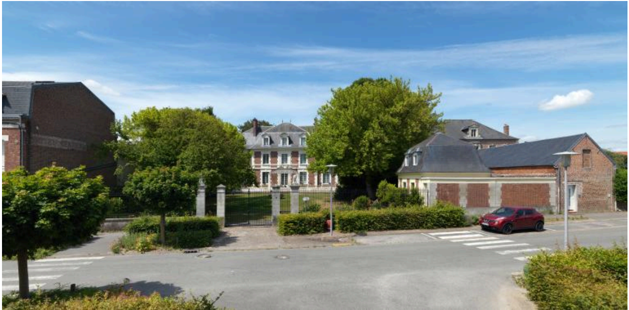
Vue de situation depuis la rue.