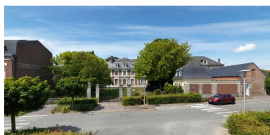
Vue de situation depuis la rue. IVR32_20208000128NUC2AQ