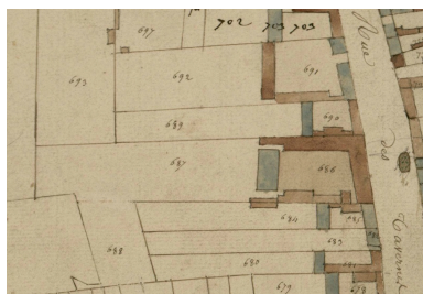
Extrait du cadastre de 1828. Section F, parcelles 686 à 690 (AD Somme ; 248_EDP).516