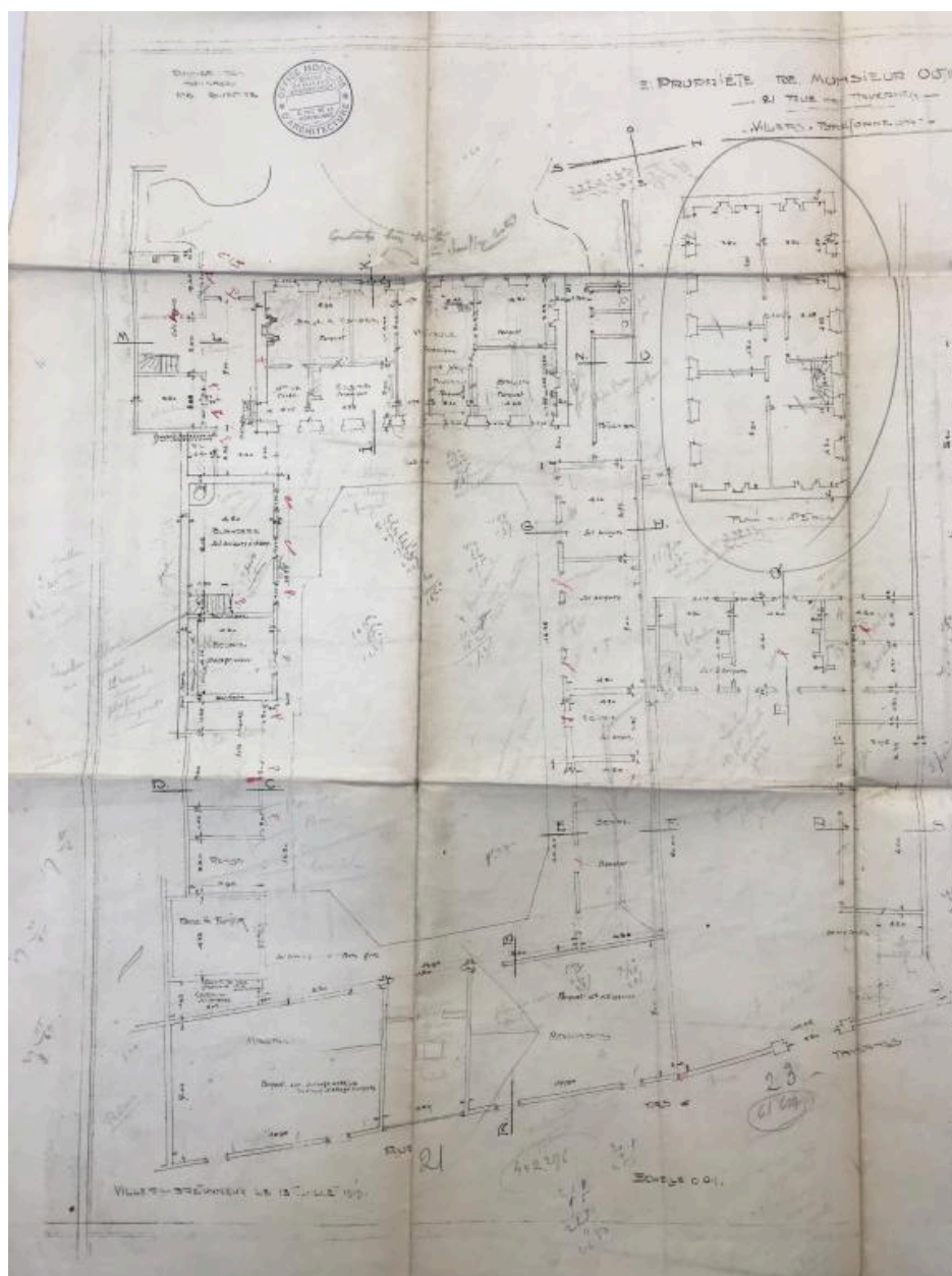
Propriété de M. Outrequin, 21 rue des Tavernes, 1919. (AD Somme ; 10R 1273).