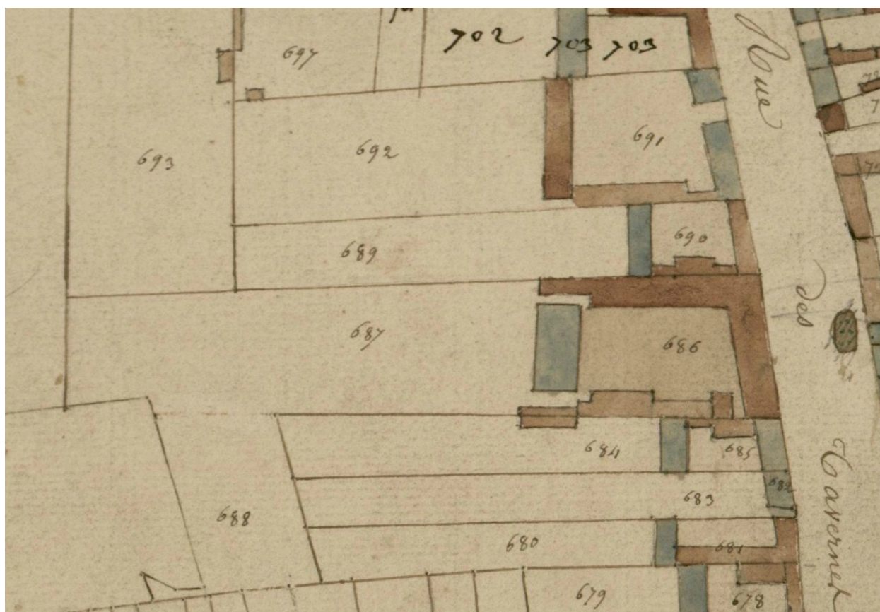
Extrait du cadastre de 1828. Section F, parcelles 686 à 690 (AD Somme ; 248_EDP).516