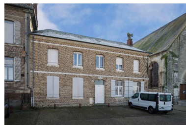
Façade sur rue de l'école.