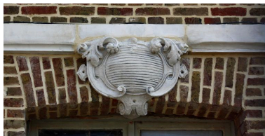
Cartouche en agrafe de l'entrée de l'école.