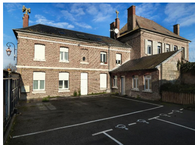
Façade postérieure de l'école.