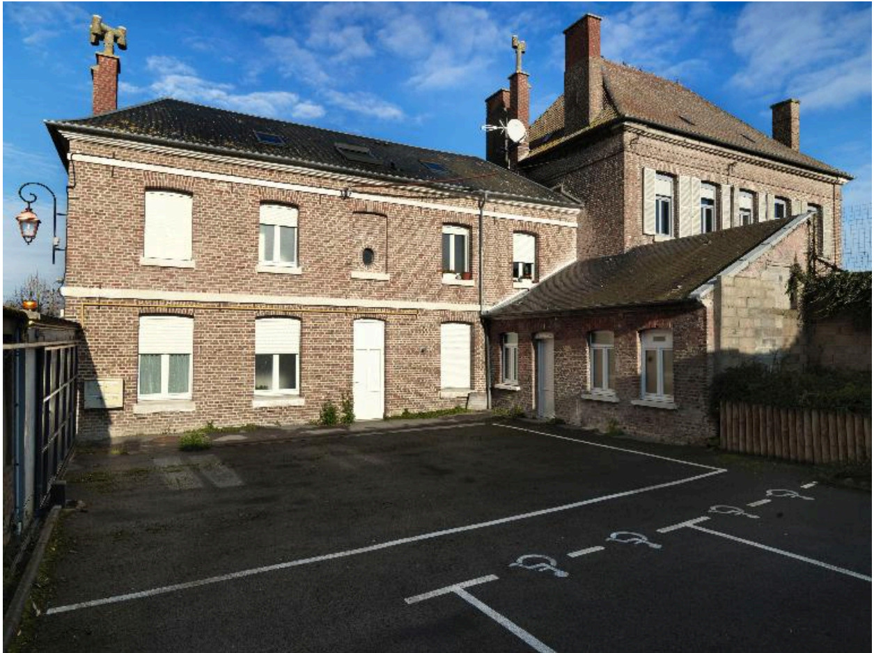
Façade postérieure de l'école.