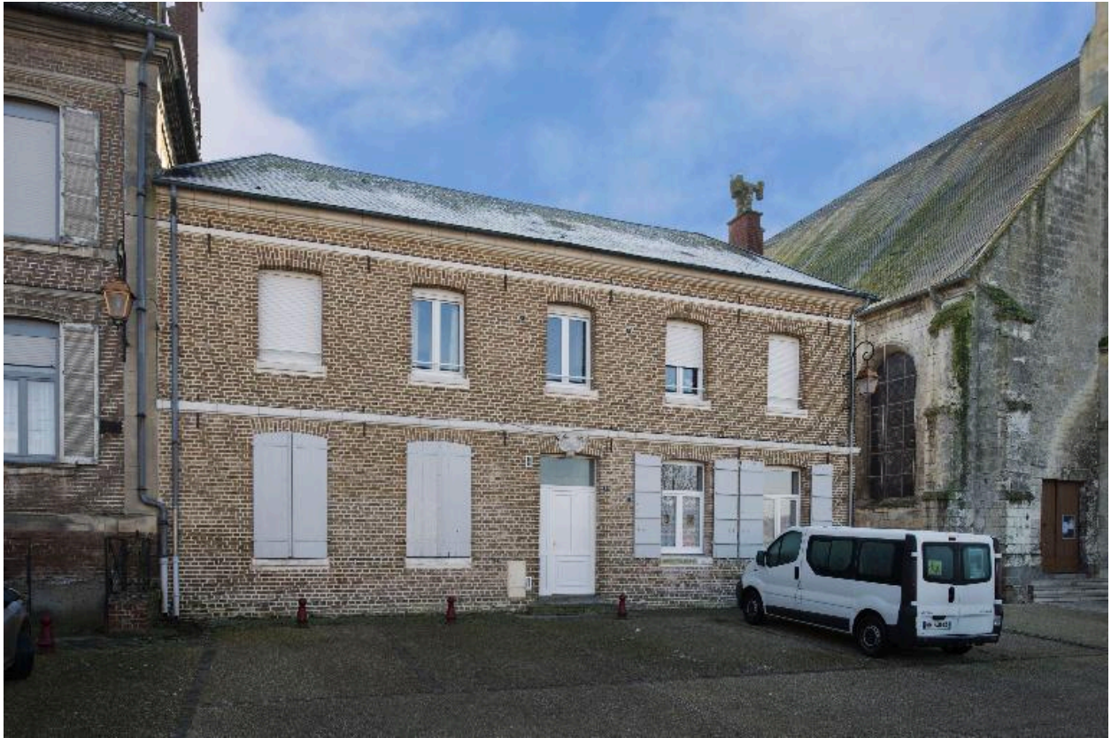
Façade sur rue de l'école.