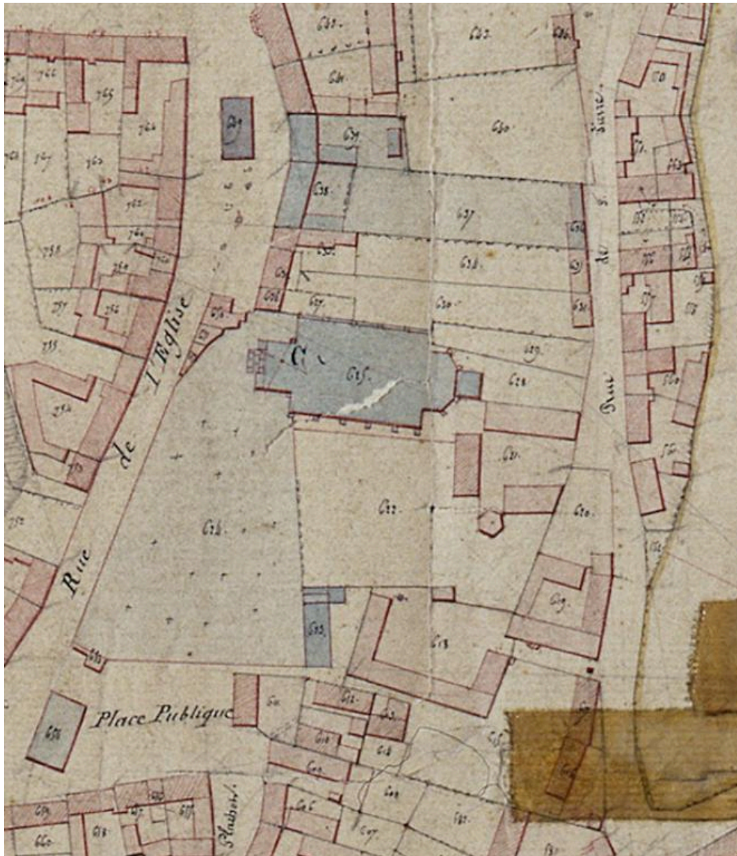
Extrait du cadastre napoléonien, 1834 (AD Somme ; 3P 1619/3).