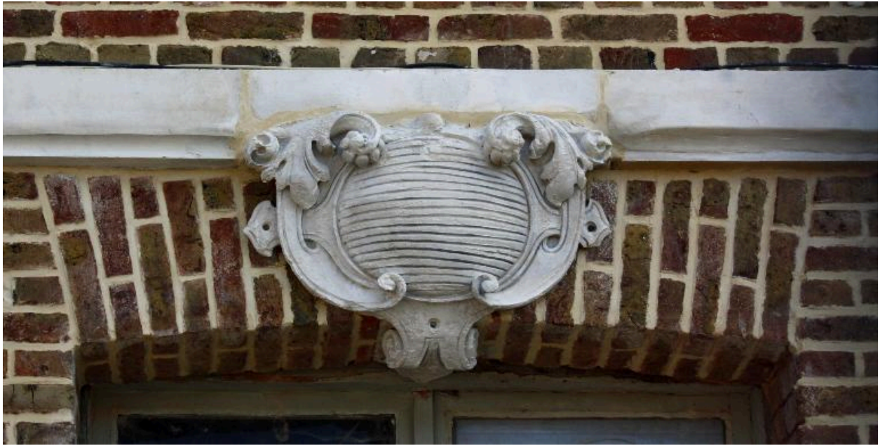
Cartouche en agrafe de l'entrée de l'école.