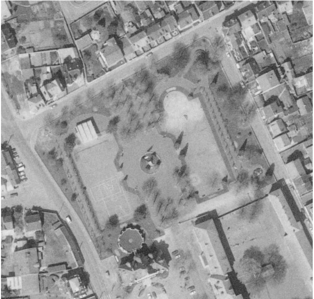
Le parc Sellier en 1985.