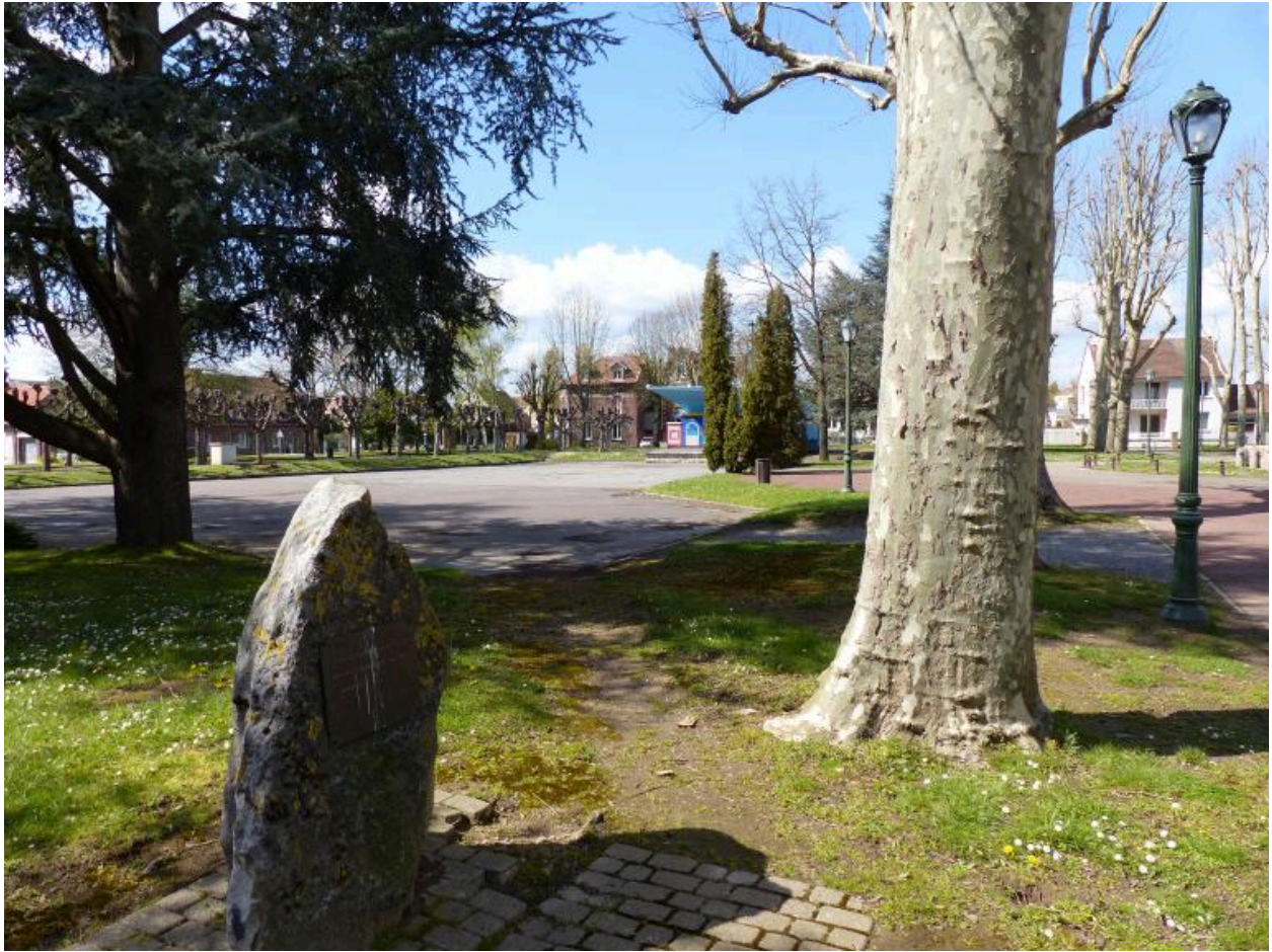
L'esplanade aménagée à l'ouest du jardin public.