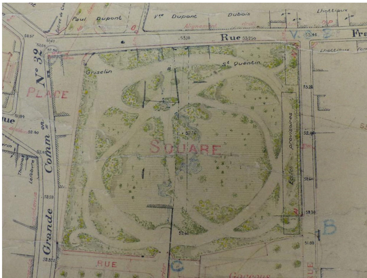
Le projet d'aménagement du parc sur le plan d'embellissement de 1920 (AC Tergnier).