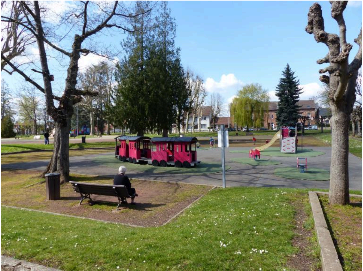
L'aire de jeux aménagée au sud-est du jardin public.