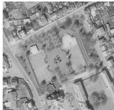
Le parc Sellier en 1985.