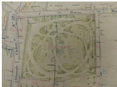
Le projet d'aménagement du parc sur le plan d'embellissement de 1920 (AC Tergnier). IVR32_20210205153NUCA