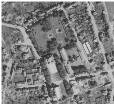
Le parc en 1944.