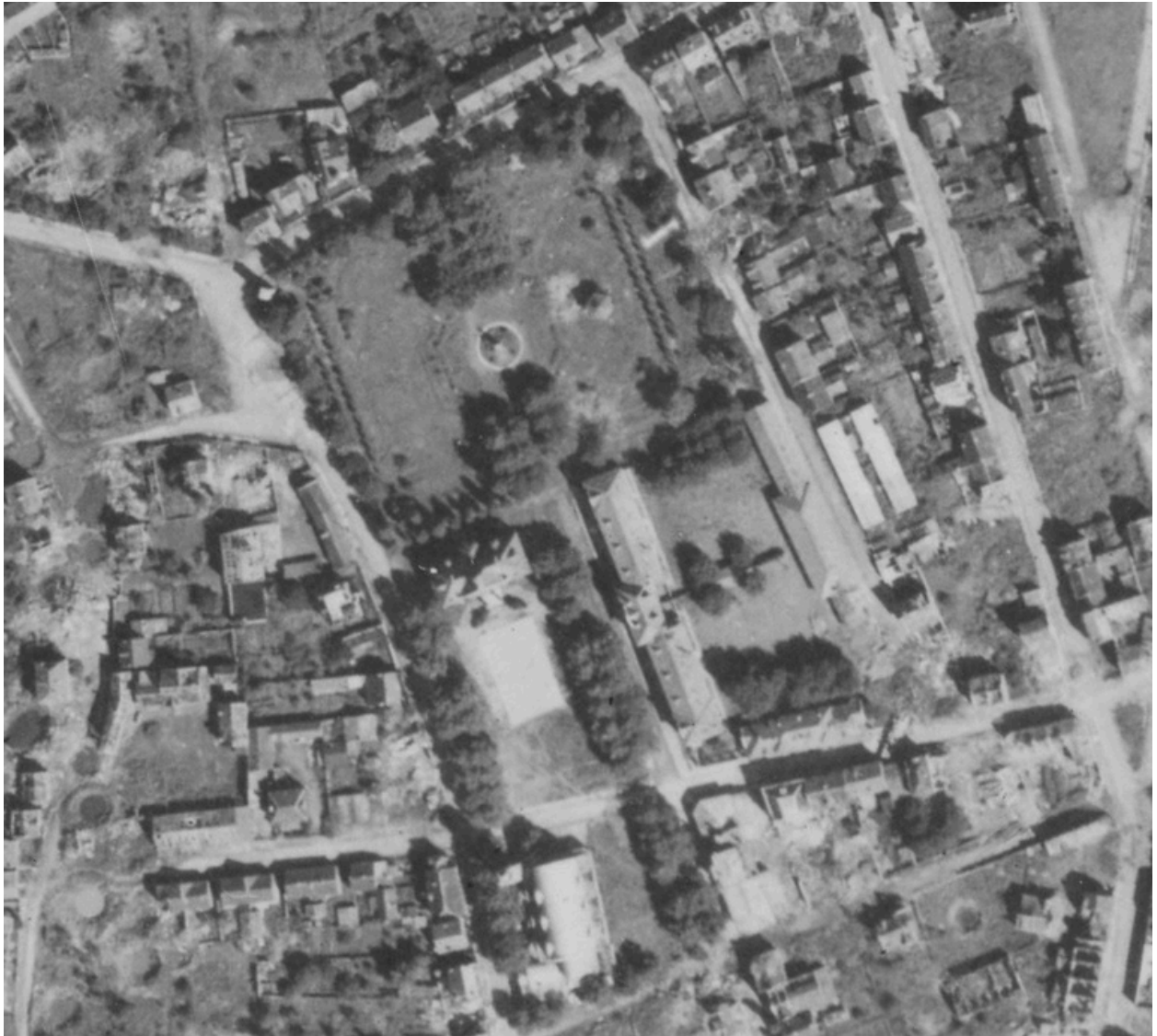
Le parc en 1944.