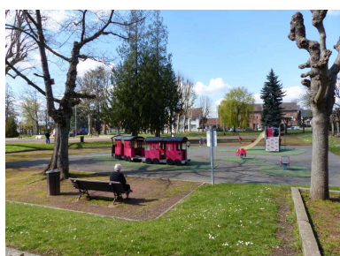
L'aire de jeux aménagée au sud-est du jardin public.