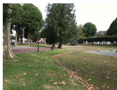
La partie est du jardin public.