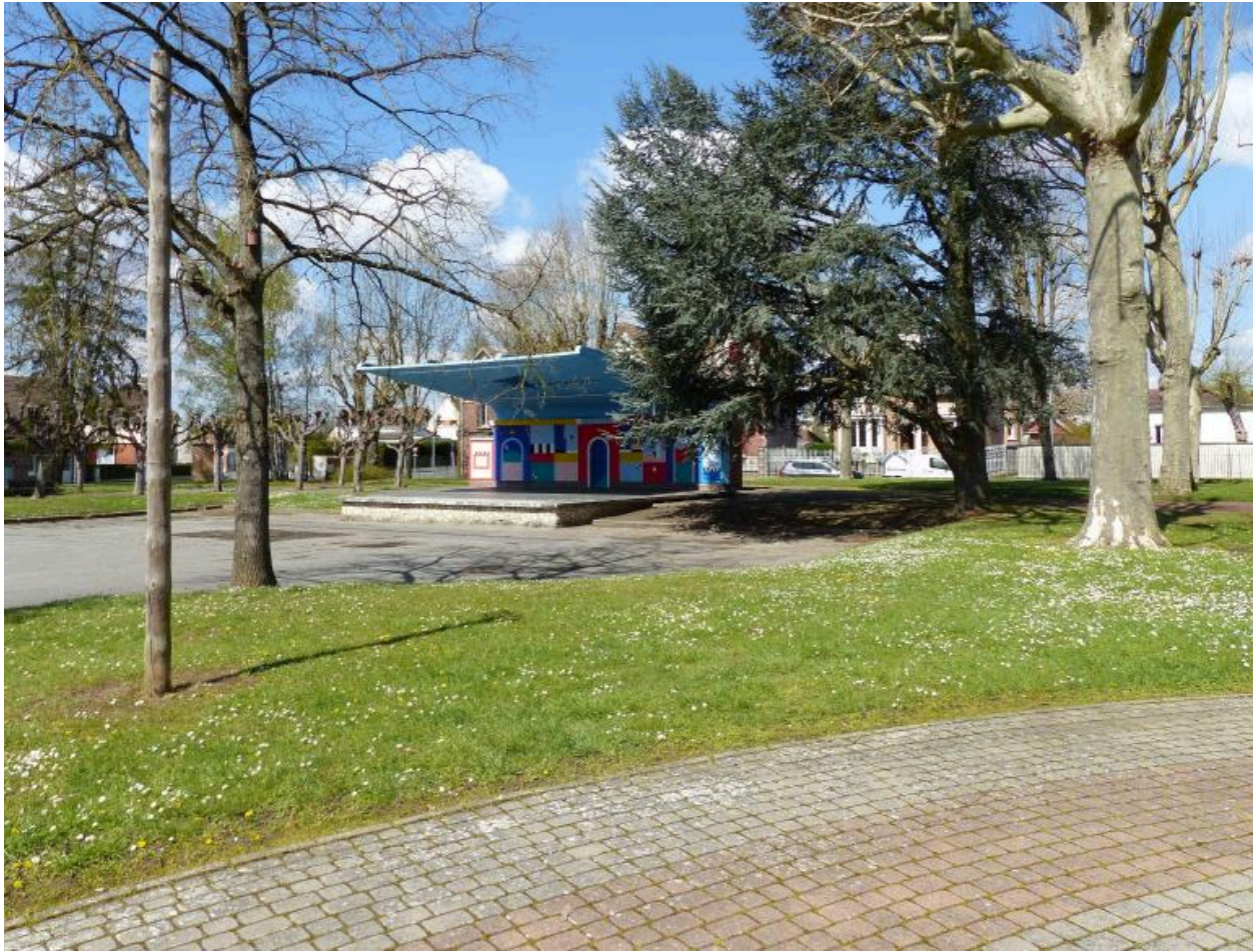
Le théâtre de verdure construit vers 1970, à l'ouest du jardin public.