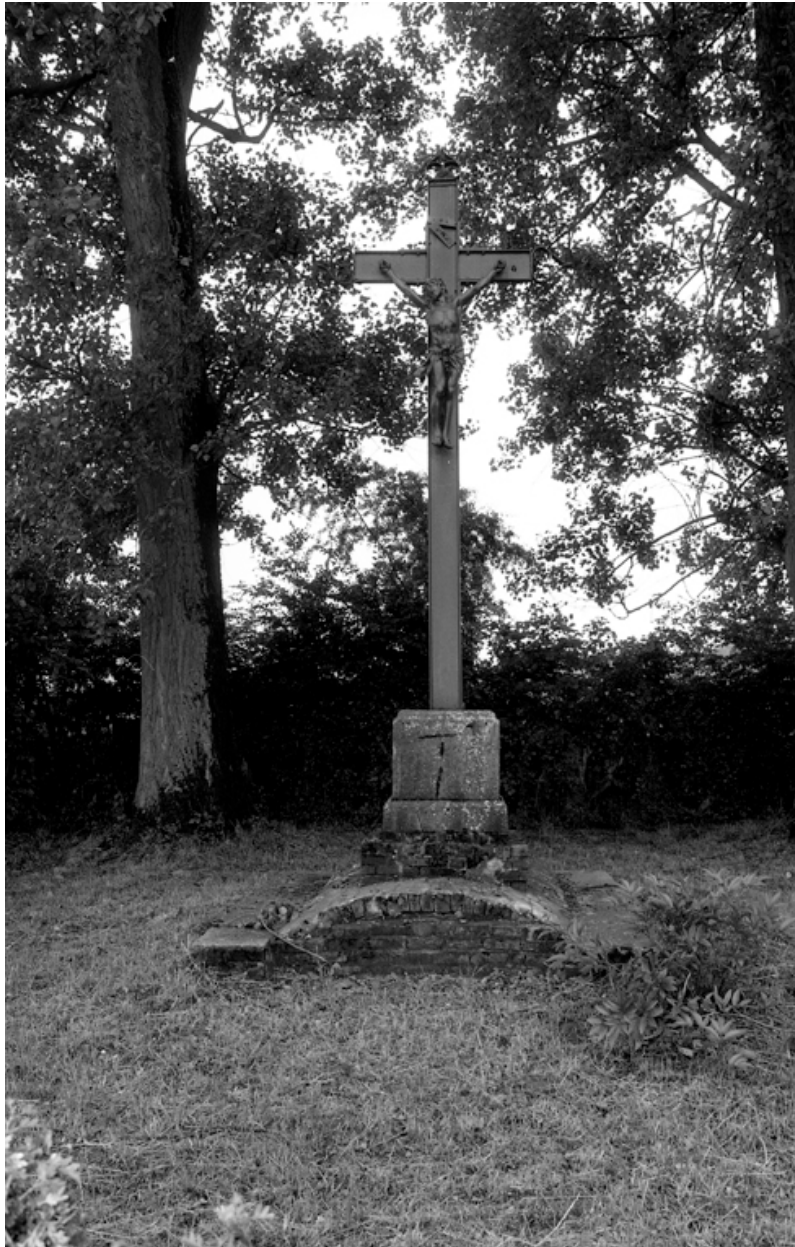
Vue d'ensemble de la croix, érigée en 1886.