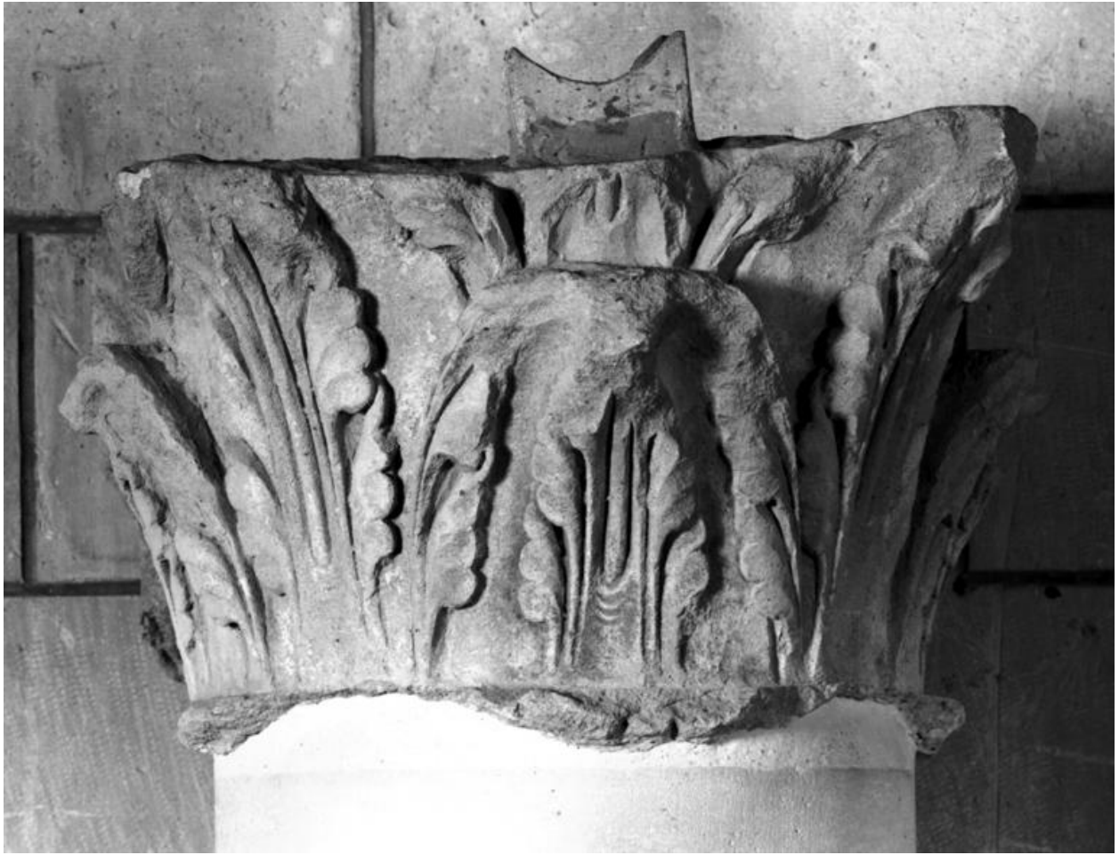
Vue de face d'un des chapiteaux.