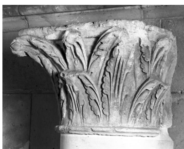
Vue de trois-quarts d'un des chapiteaux.