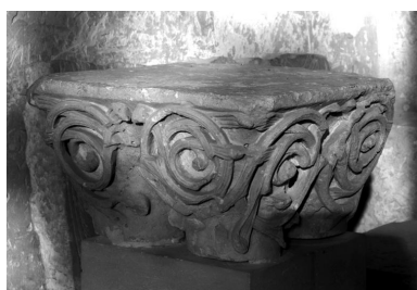
Vue de face du grand chapiteau.

IVR22_19990200142X