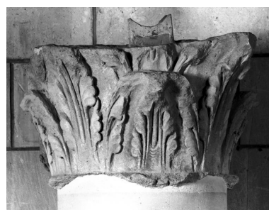
Vue de face d'un des chapiteaux.