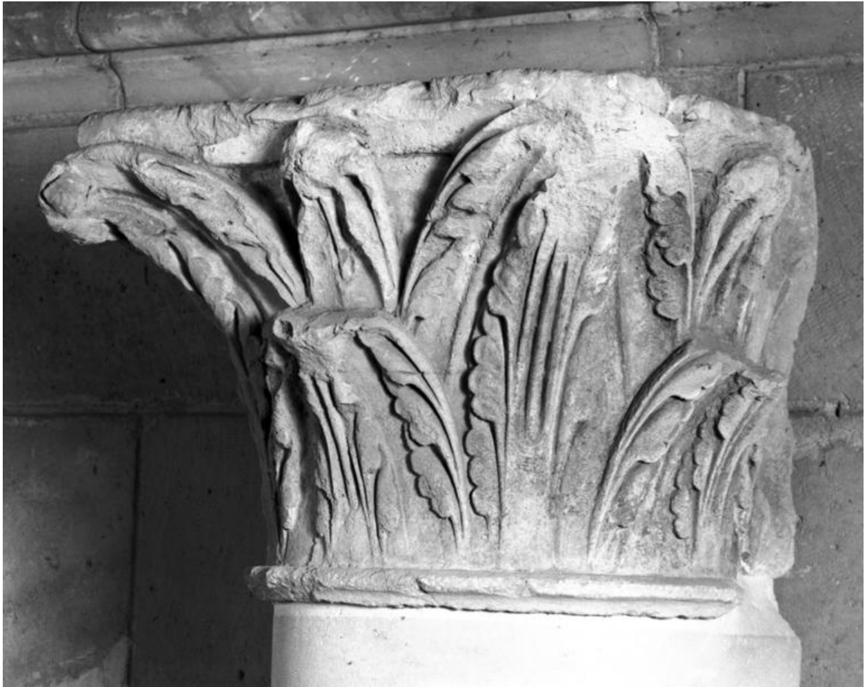
Vue de trois-quarts d'un des chapiteaux.