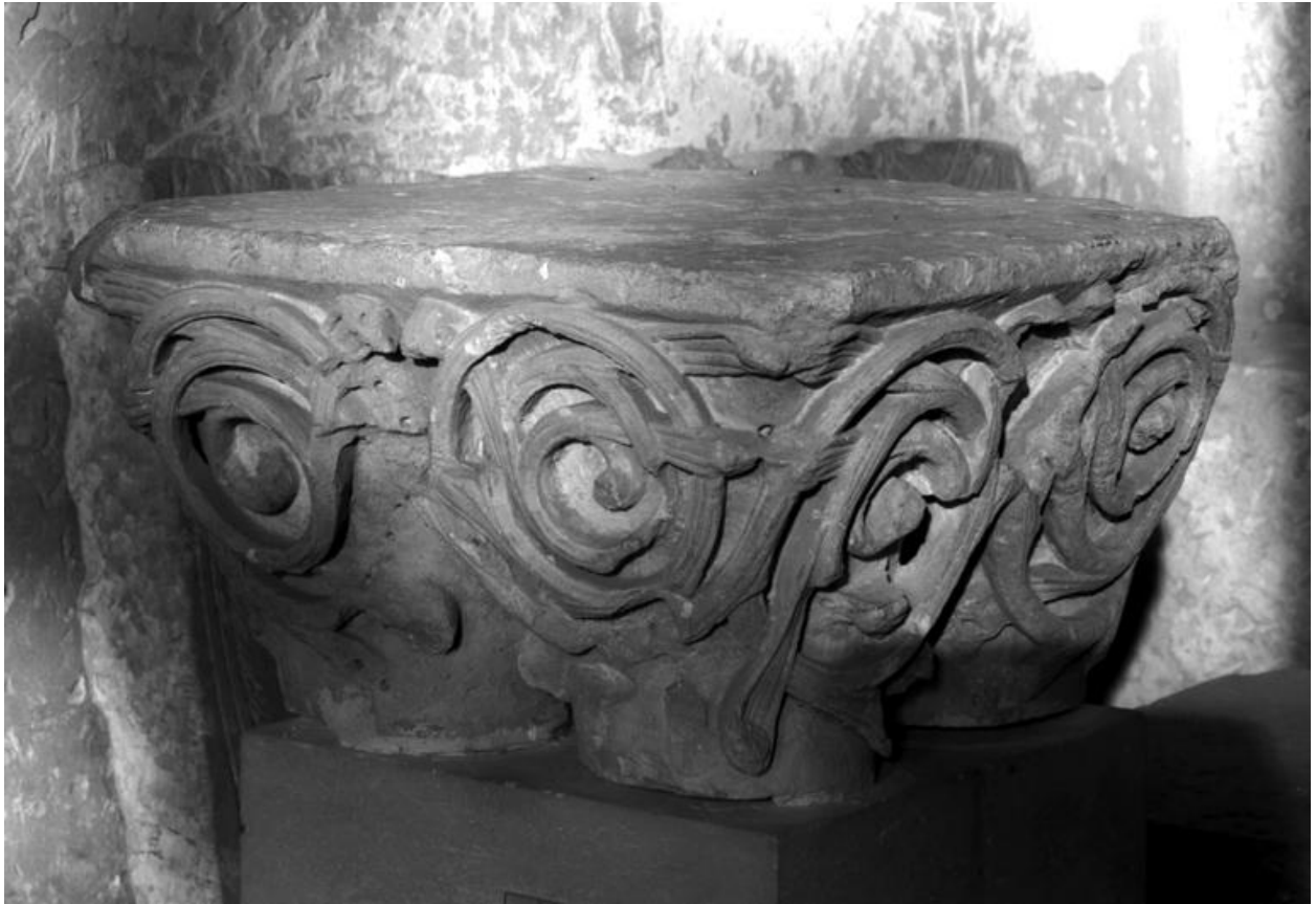
Vue de face du grand chapiteau.