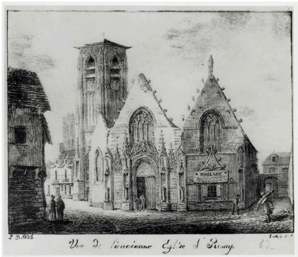
L'ancienne église Saint-Rémy, dessin de Louis Duthoit, 1825.