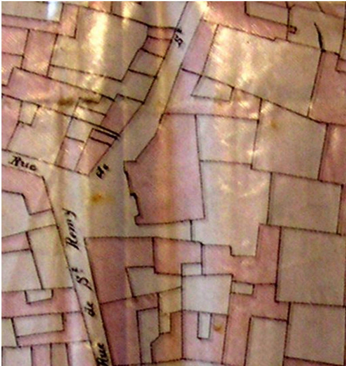
Extrait du cadastre napoléonien.