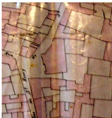
Extrait du cadastre napoléonien.