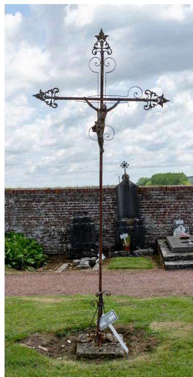
Croix funéraire en fer forgé et fonte.