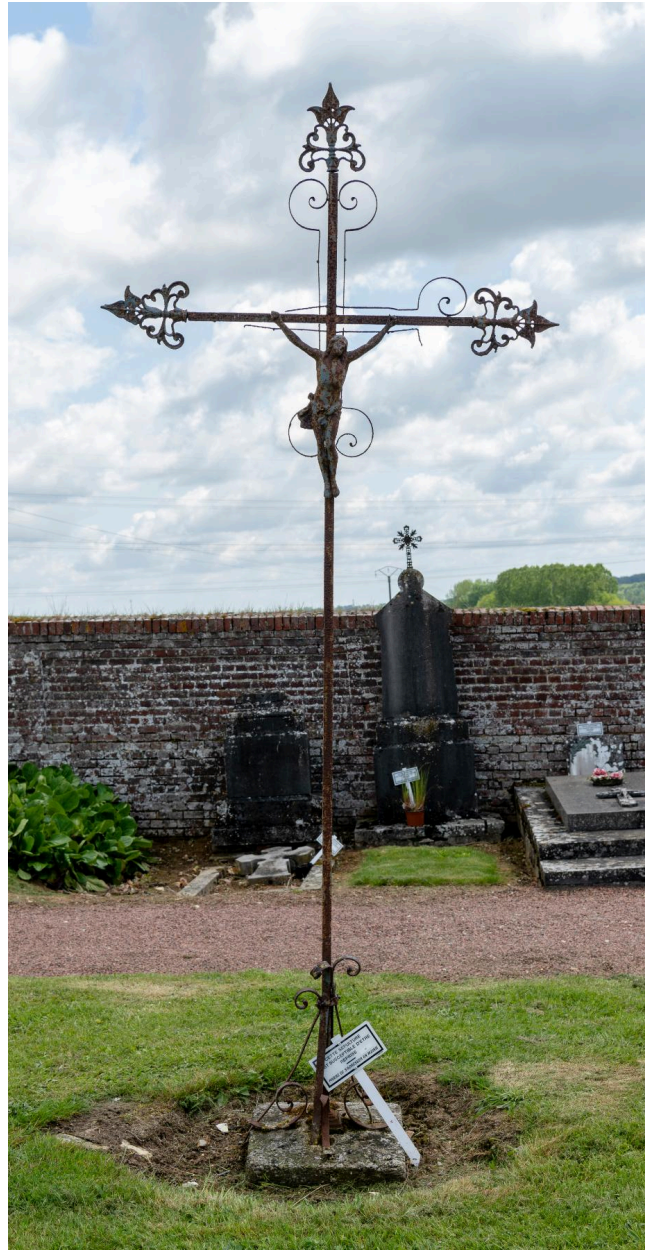
Croix funéraire en fer forgé et fonte.