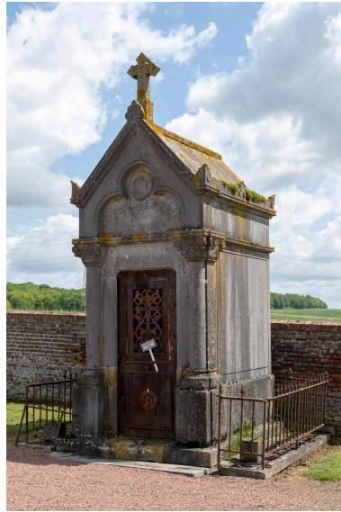
Tombeau en forme de chapelle de la famille Peucellier-Maillard.