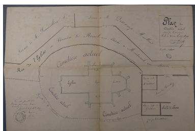
Plan de l'ancien cimetière de Reuil-sur-Brèche, 1887 (AD Oise ; 2 O 12625). IVR32_20236000233NUCA