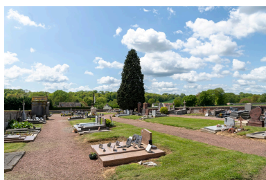
Vue générale du cimetière prise depuis l'angle nord-est. IVR32_20236000658NUCA