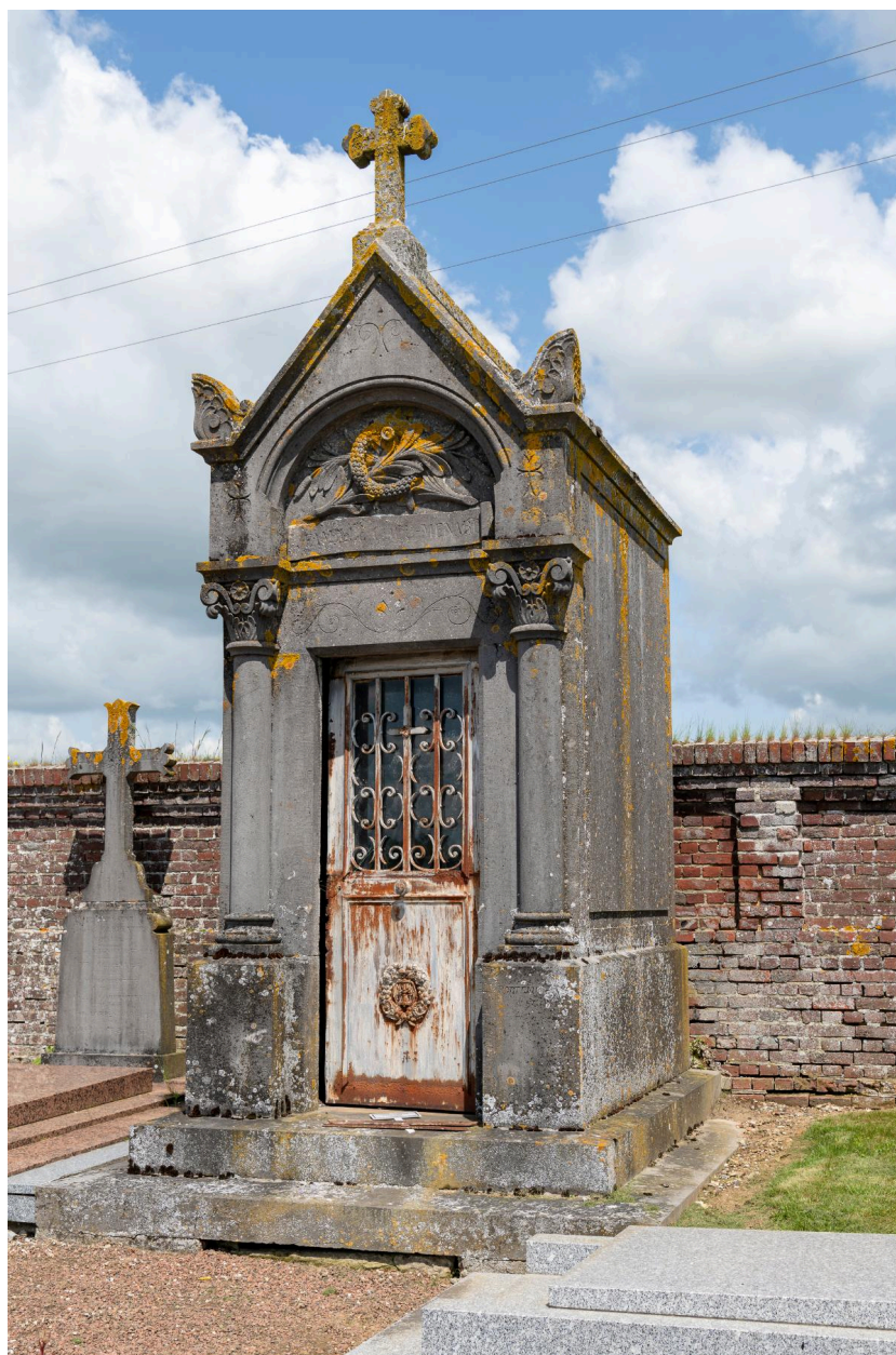
Tombeau en forme de chapelle de la famille Cocu-Ménard, signé Portemer à St-Just.