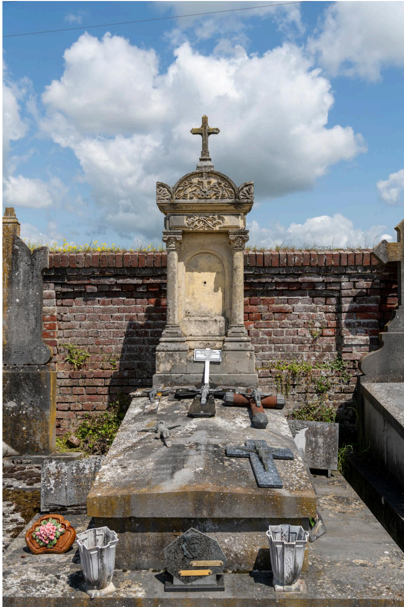
Tombeau avec stèle funéraire signé Anty à La Chaussée du Bois d'Écu.