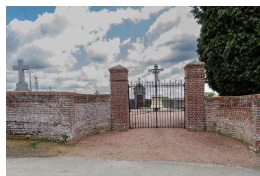
Vue générale de l'entrée du cimetière. IVR32_20236000663NUCA