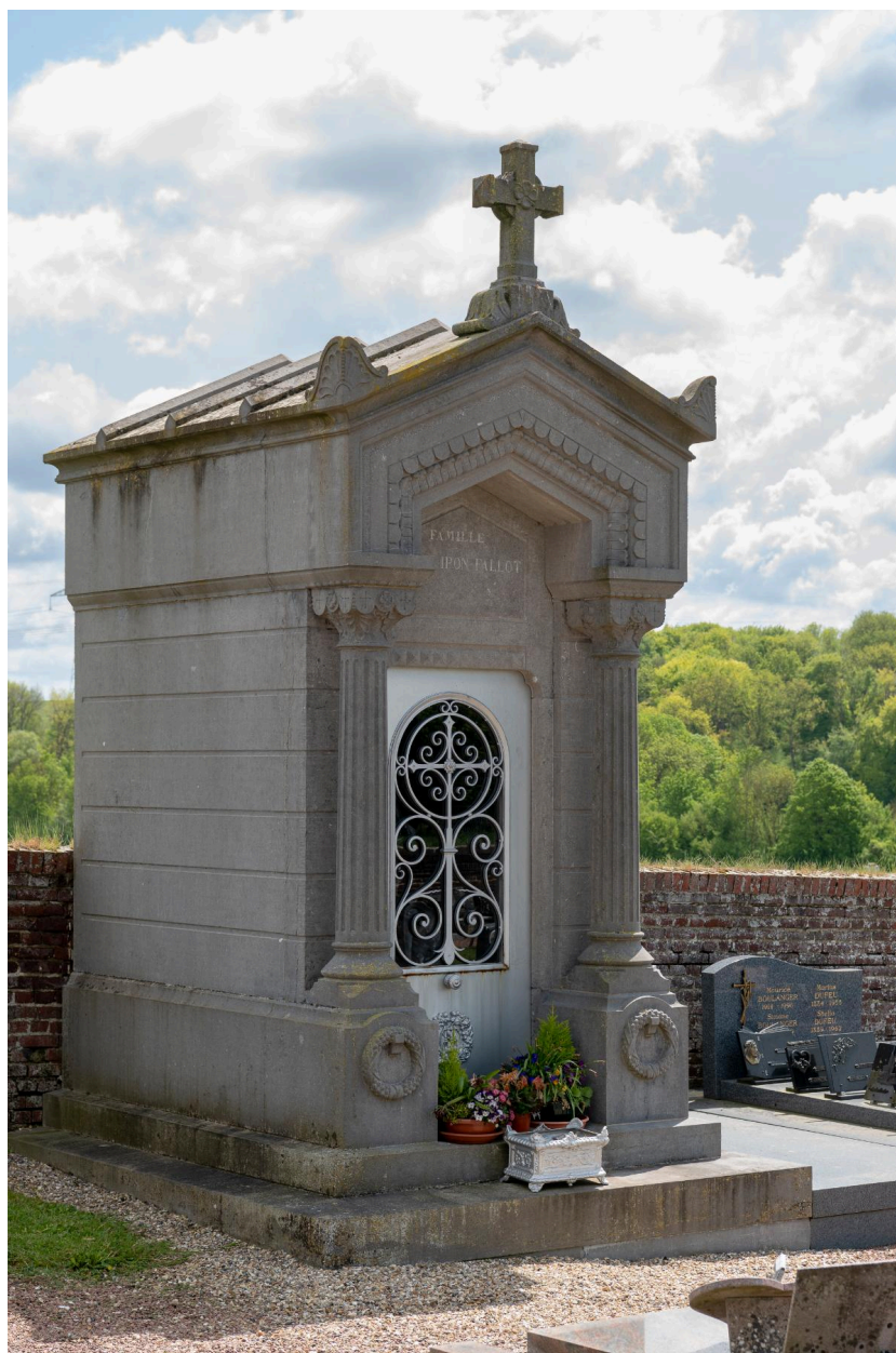
Tombeau en forme de chapelle de la famille Watrison-Fallot, signé J. Dubois à Beauvais.