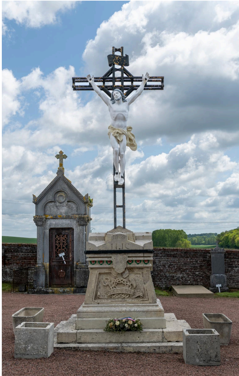
Croix du cimetière par Decaux, 1889.