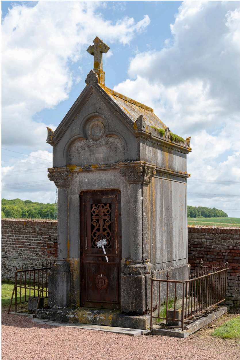
Tombeau en forme de chapelle de la famille Peaucellier-Maillard.