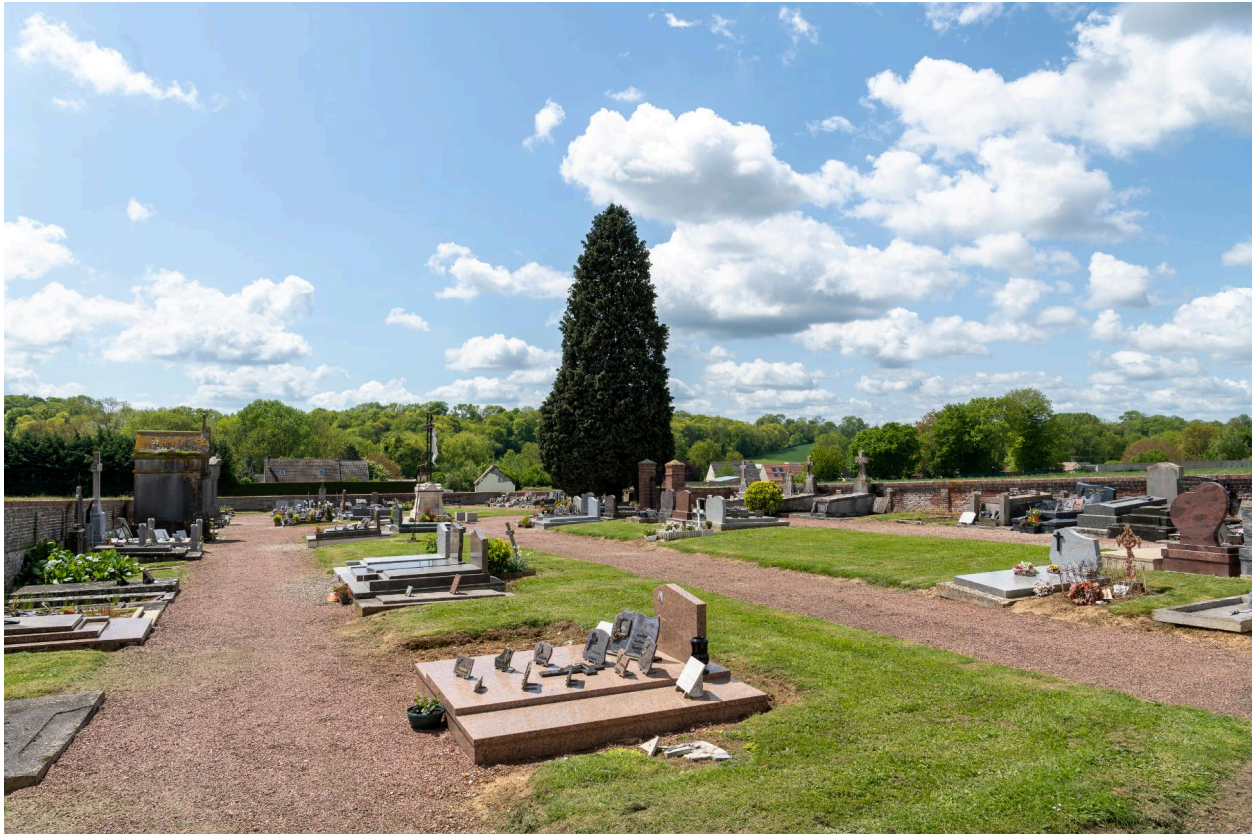
Vue générale du cimetière prise depuis l'angle nord-est.