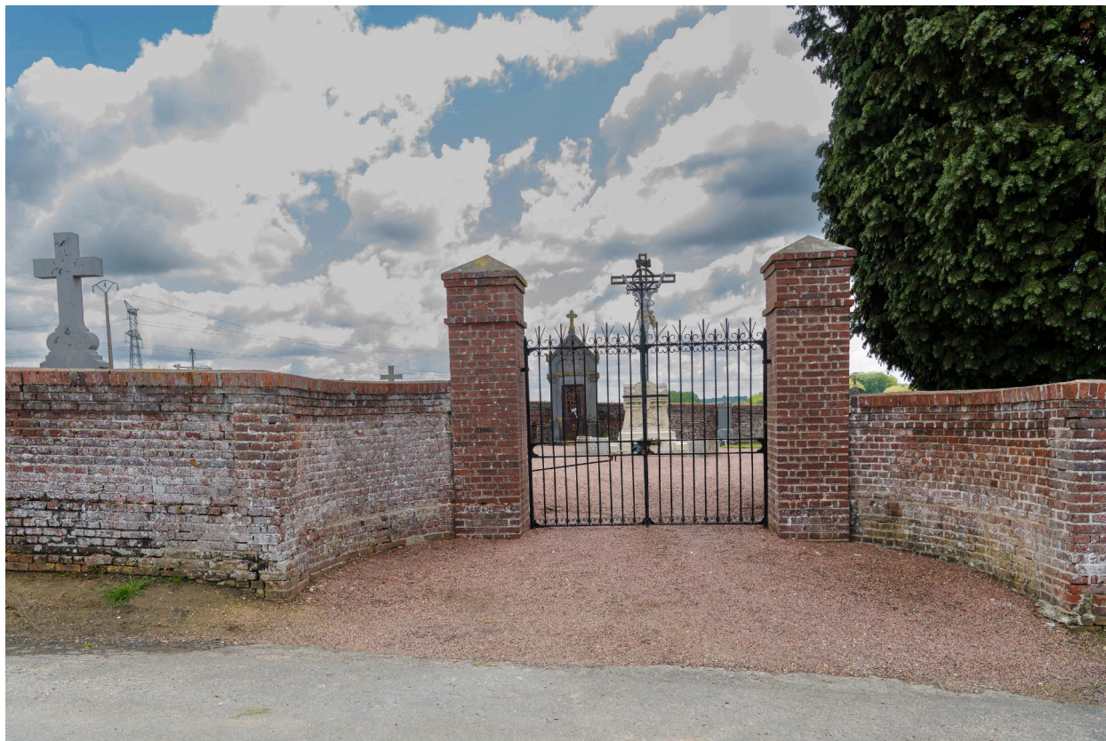
Vue générale de l'entrée du cimetière.