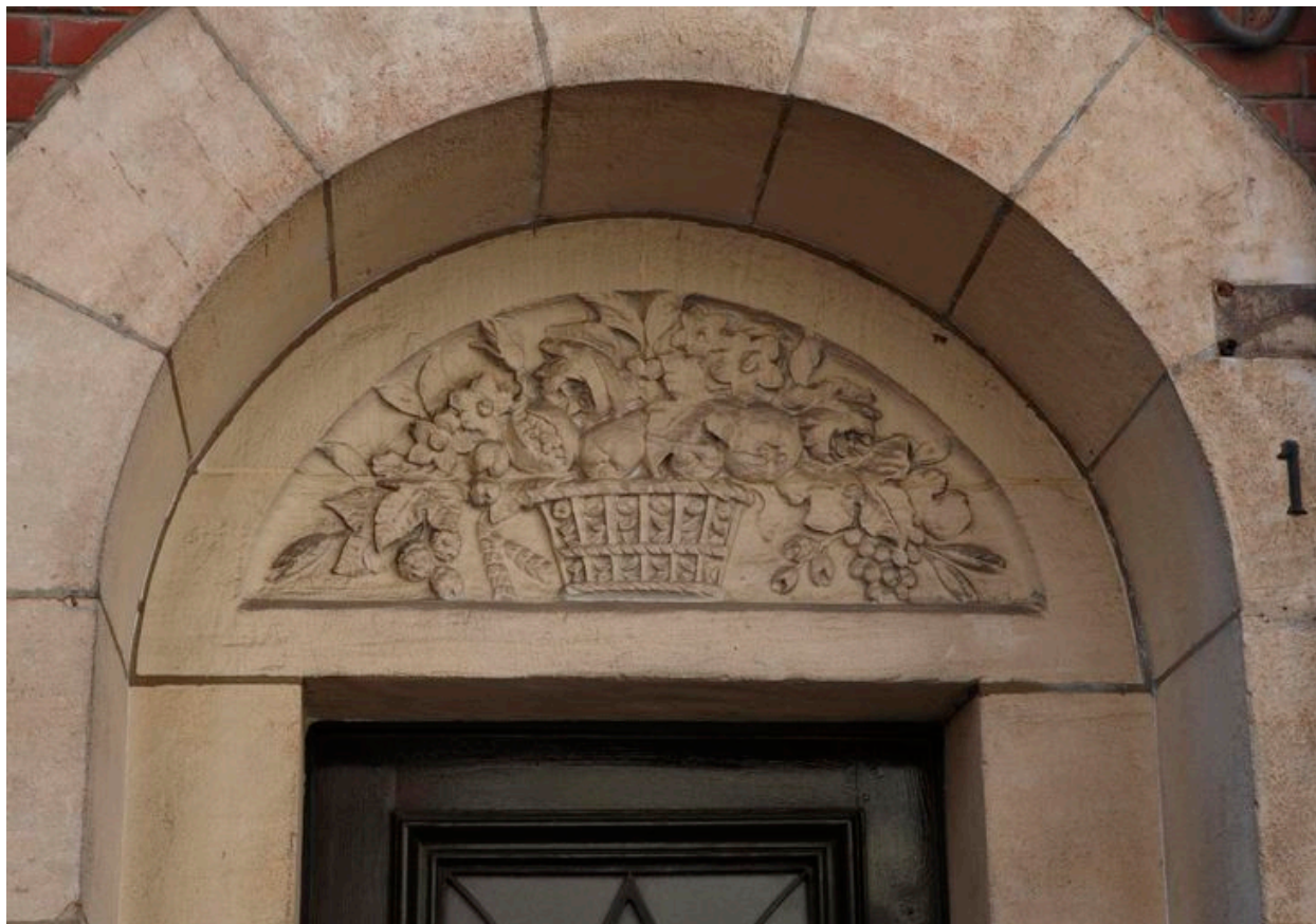
Couronnement Art déco de la porte d'entrée.