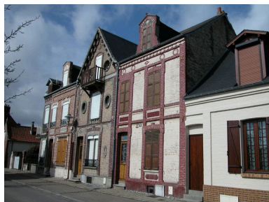
Vue d'ensemble. IVR22_20058003714NUCA