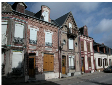
Vue d'ensemble. IVR22_20058003715NUCA