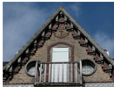
Détail du décor en brique figurant une ancre de marine. IVR22_20058003716NUCA