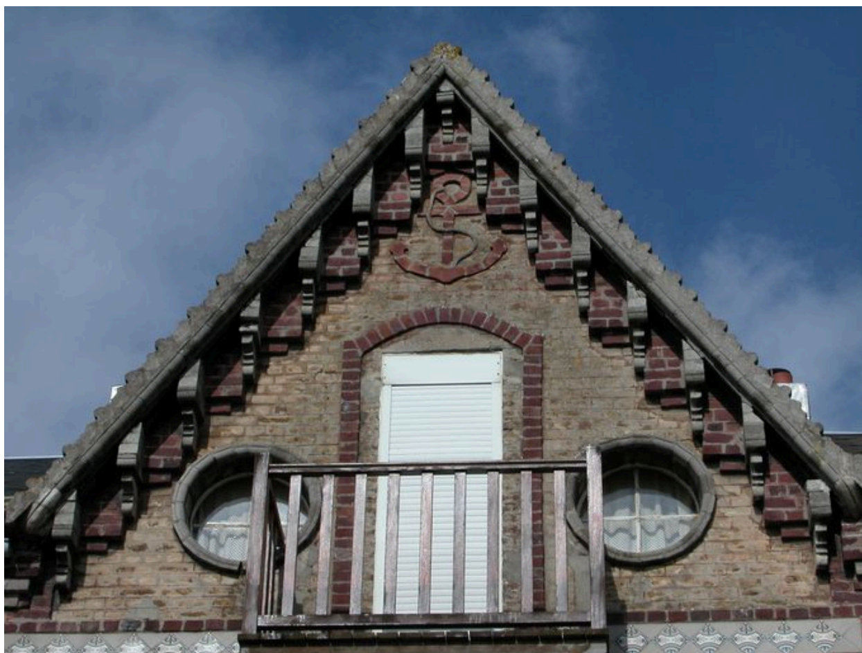
Détail du décor en brique figurant une ancre de marine.