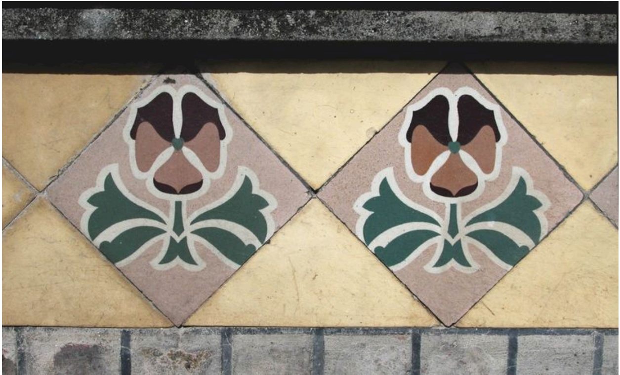
Détail d'une frise de céramique portée sur le logement médian