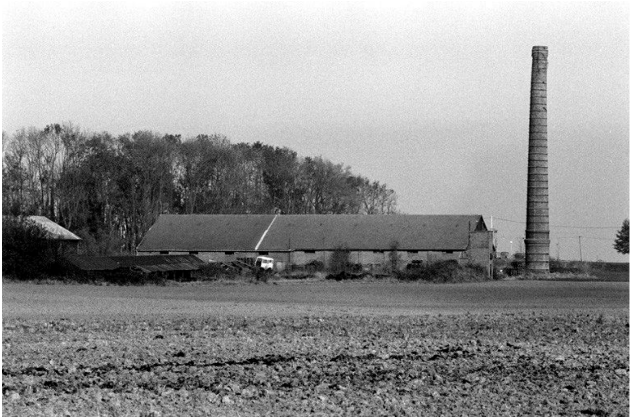
Four industriel et cheminée d'usine, vue flanc ouest.