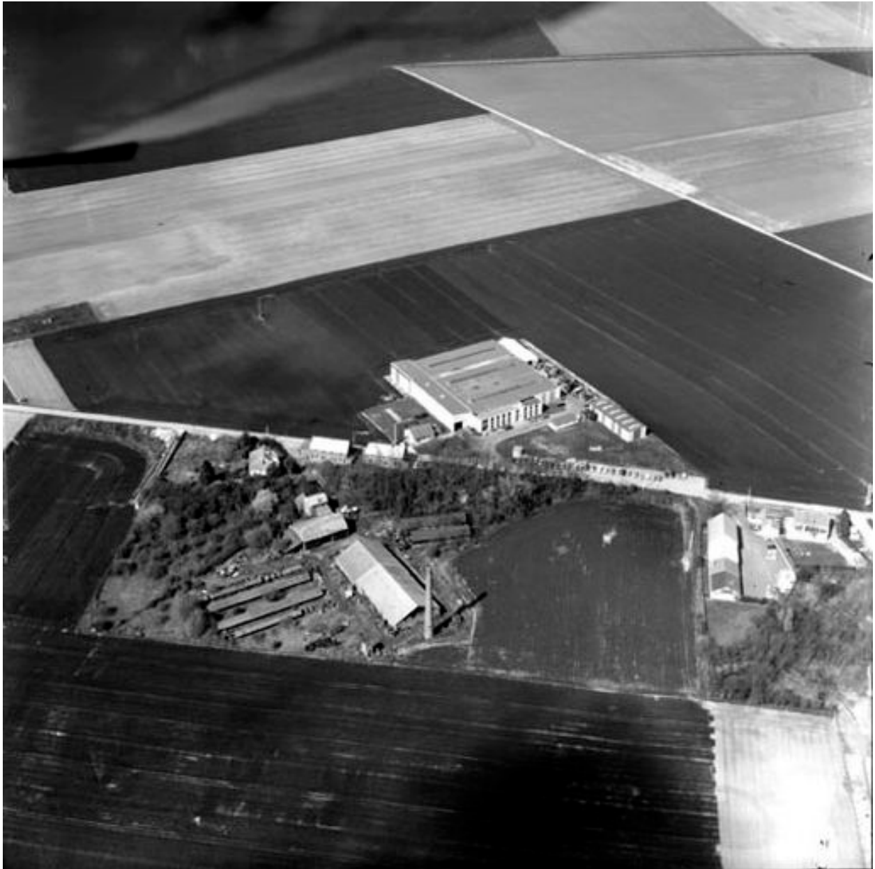
Vue aérienne, flanc sud.