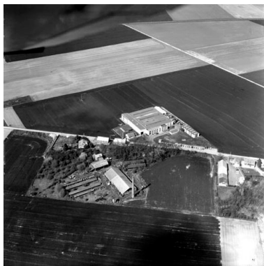
Vue aérienne, flanc sud.