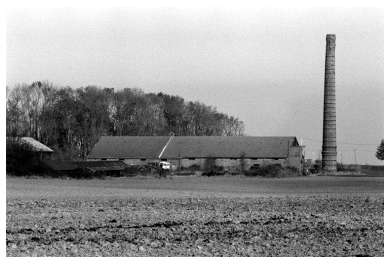
Four industriel et cheminée d'usine, vue flanc ouest. IVR22_19878000195Z