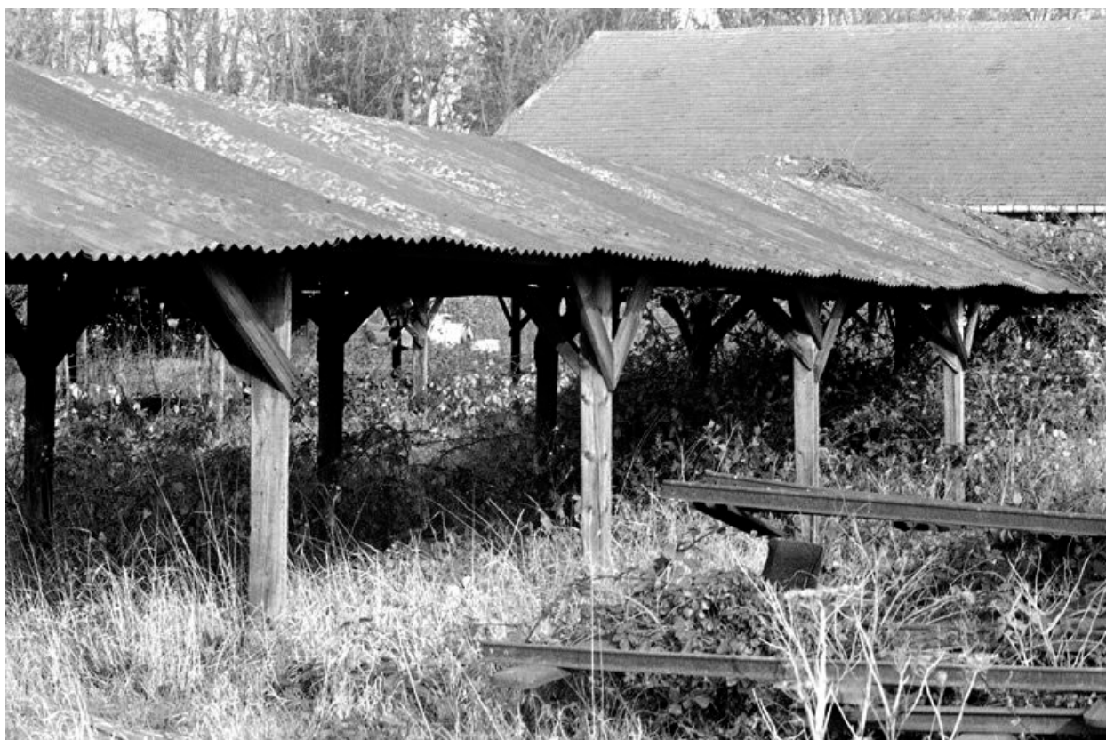
Halette de séchage.