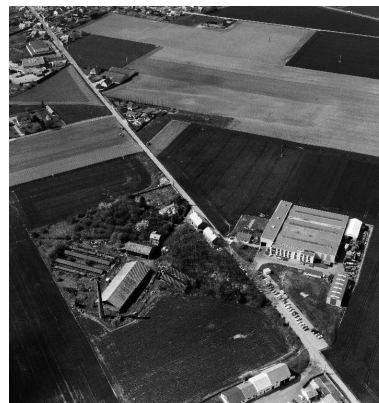
Vue aérienne, flanc sud-est. On distingue, alignés sur la route, les bureaux et le logis.