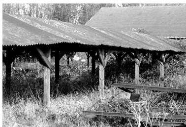
Halette de séchage. IVR22_19878000197Z