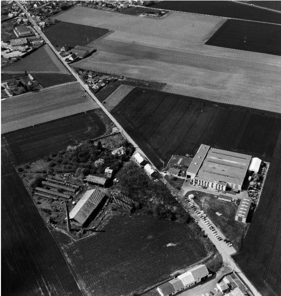
Vue aérienne, flanc sud-est. On distingue, alignés sur la route, les bureaux et le logis.