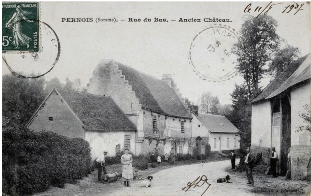
Vue de l'ancien logis, avant 1907 (coll. part.).