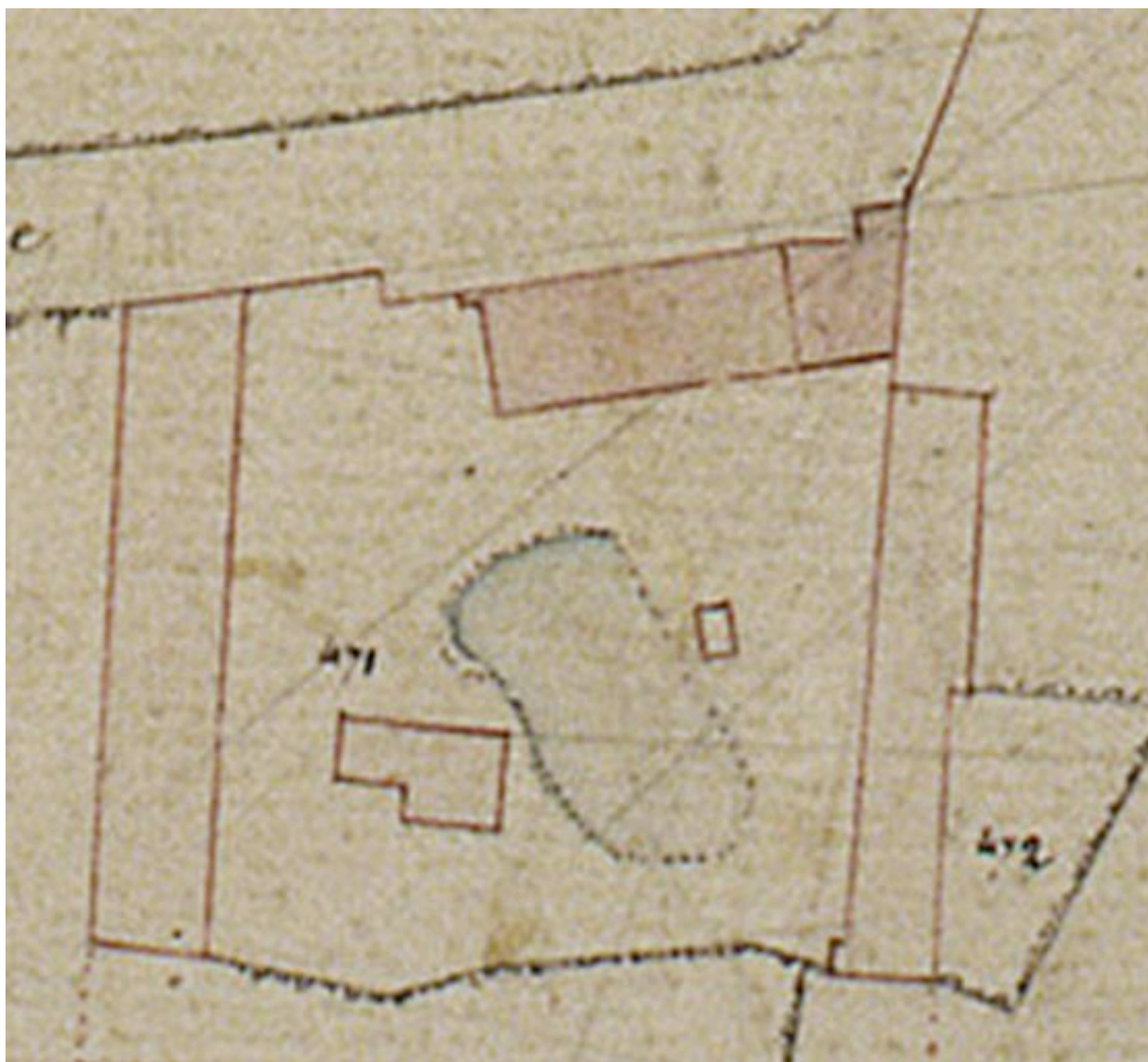
Détail du plan cadastral, section B, par Carette, 1832 (AD Somme ; 3P 1447/4).