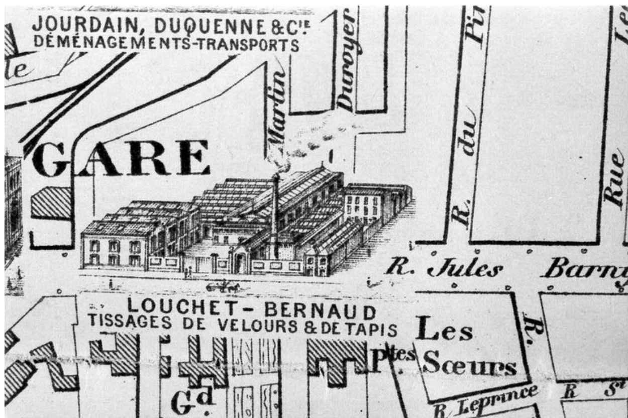
Tissage Louchet-Bernaud. Extrait du Nouveau plan d'Amiens monumental, industriel et commercial, vers 1893 (BM Amiens).