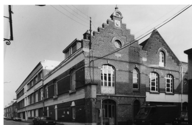
Vue des bureaux.