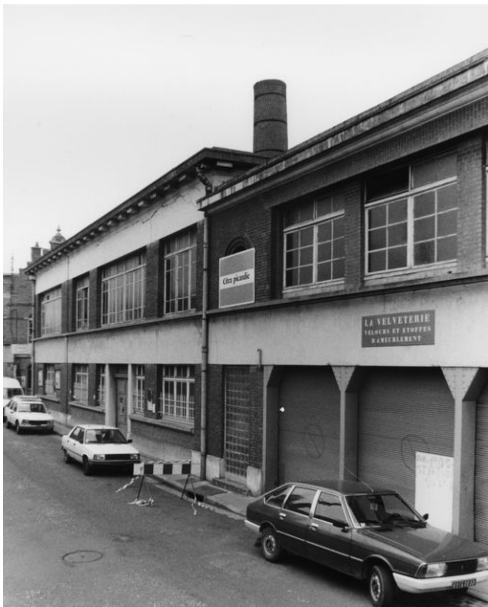
Vue partielle, flanc est.