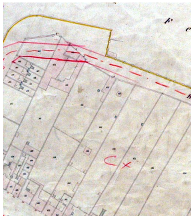
Extrait du cadastre de 1852 (DGI).