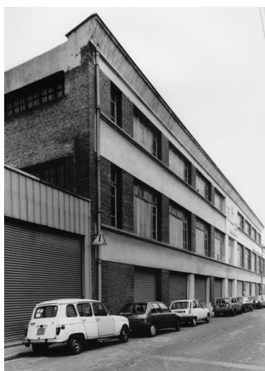
Magasin industriel, vue depuis le nord-est.