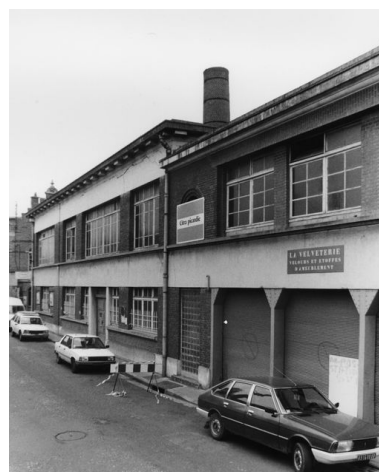
Vue partielle, flanc est.