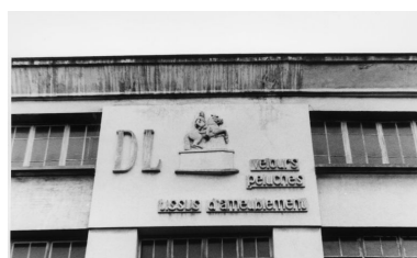
Détail sur le cartel de l'entreprise Delaroïère et Leclercq.