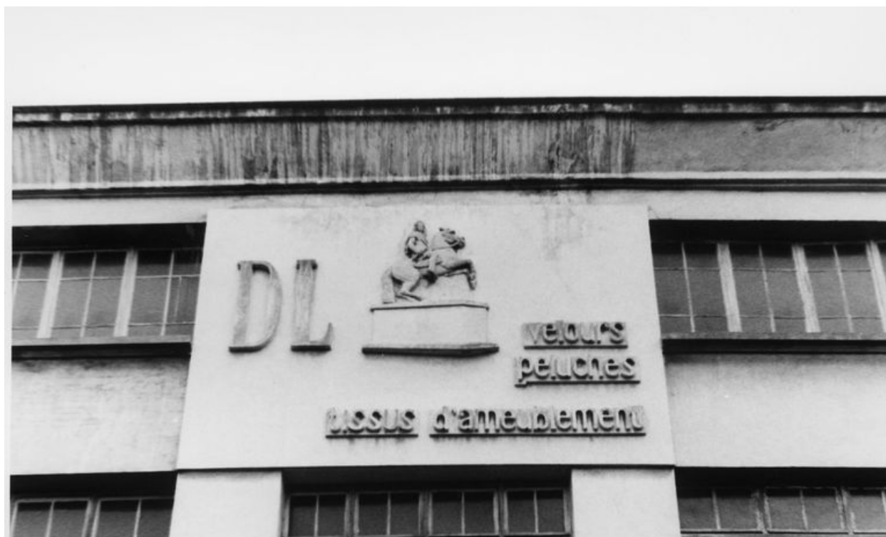
Détail sur le cartel de l'entreprise Delaroière et Leclercq.