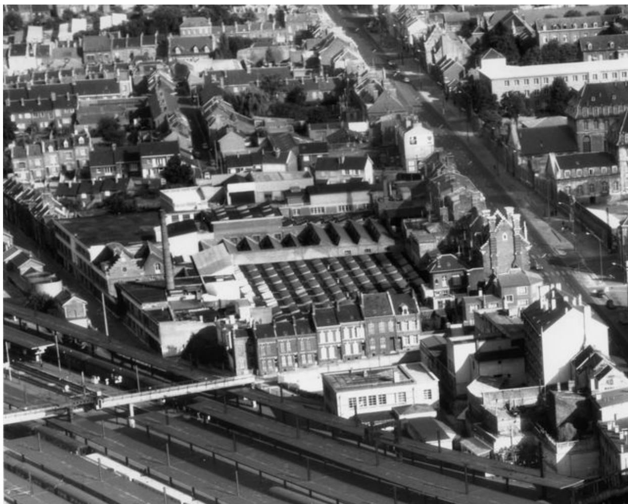
Vue aérienne vers 1965.