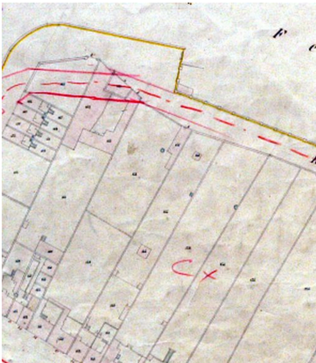
Extrait du cadastre de 1852 (DGI).