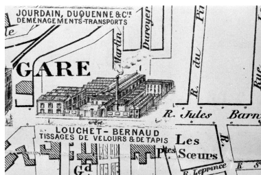
Tissage Louchet-Bernaux. Extrait du Nouveau plan d'Amiens monumental, industriel et commercial, vers 1893 (BM Amiens).