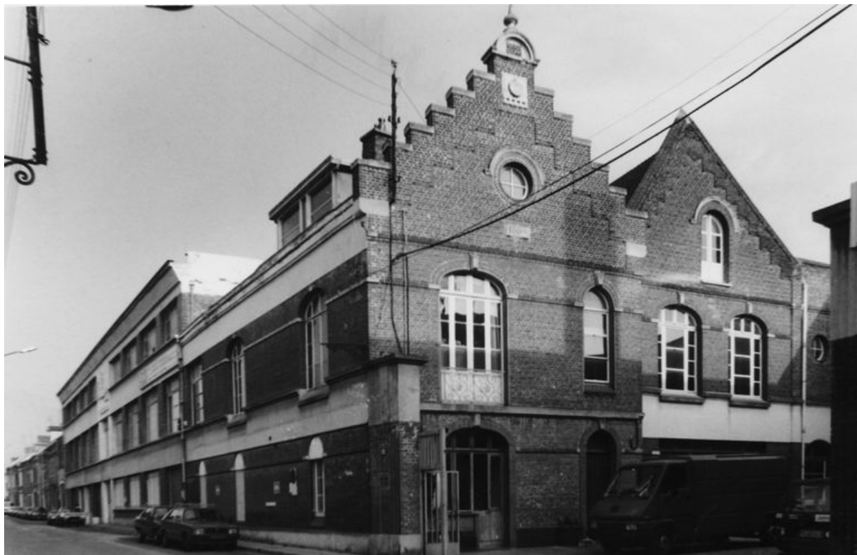
Vue des bureaux.