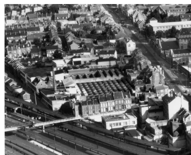
Vue aérienne vers 1965, Henrard (AD Somme).