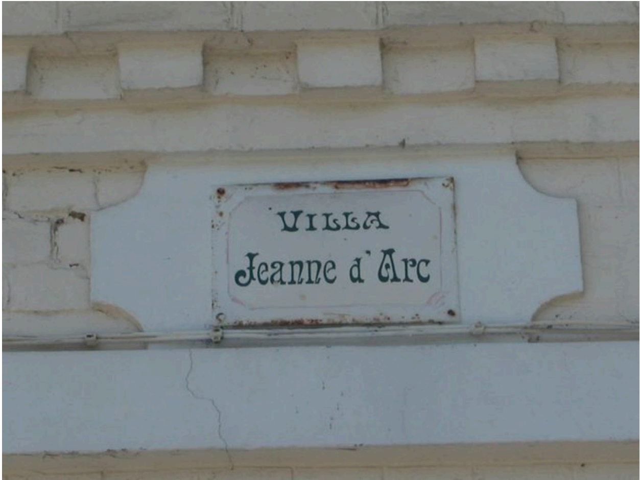
Détail de la plaque portant appellation de la maison.