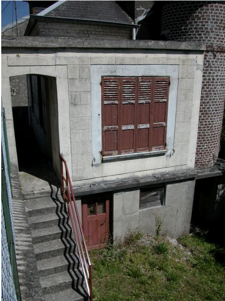
Détail du soubassement.