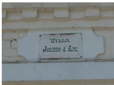
Détail de la plaque portant appellation de la maison.