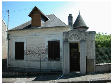
Vue d'ensemble. IVR22_20058003347NUCA