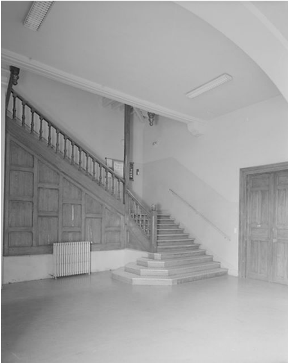
Vestibule et escalier.