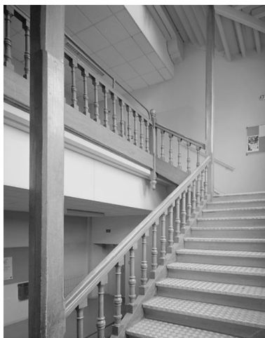
Cage d'escalier. IVR22_19978000839V