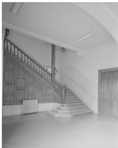
Vestibule et escalier.