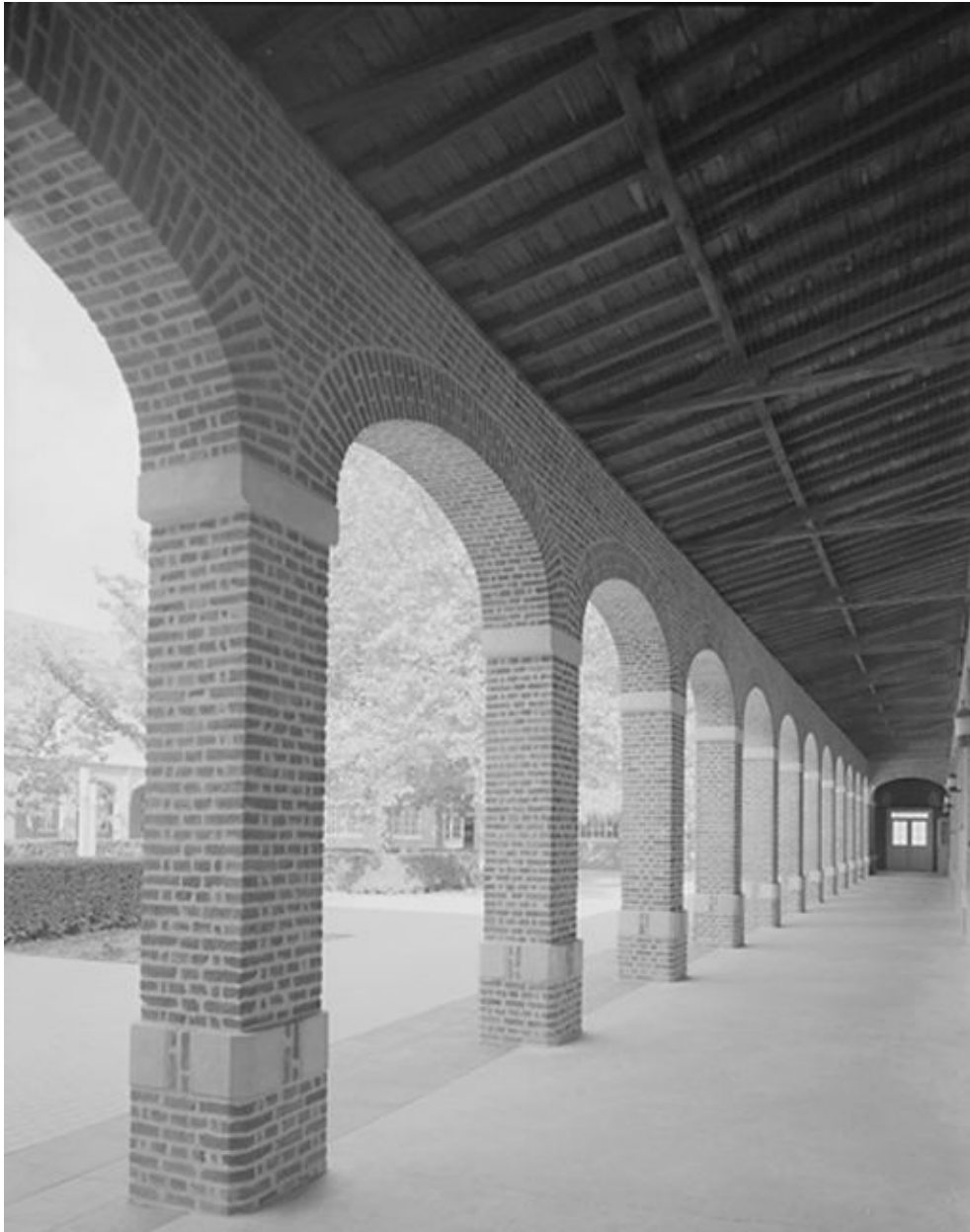
Galerie de la cour intérieure.