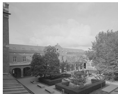
Cour intérieure.