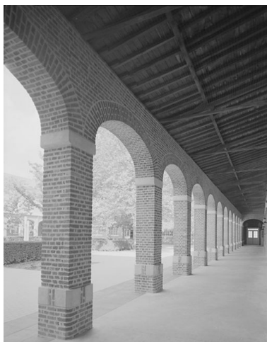
Galerie de la cour intérieure.