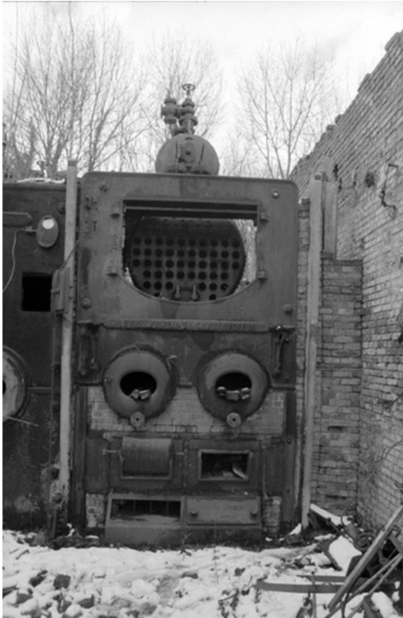
Chaufferie, chaudières à vapeur (constructeur Louis Fontaine).