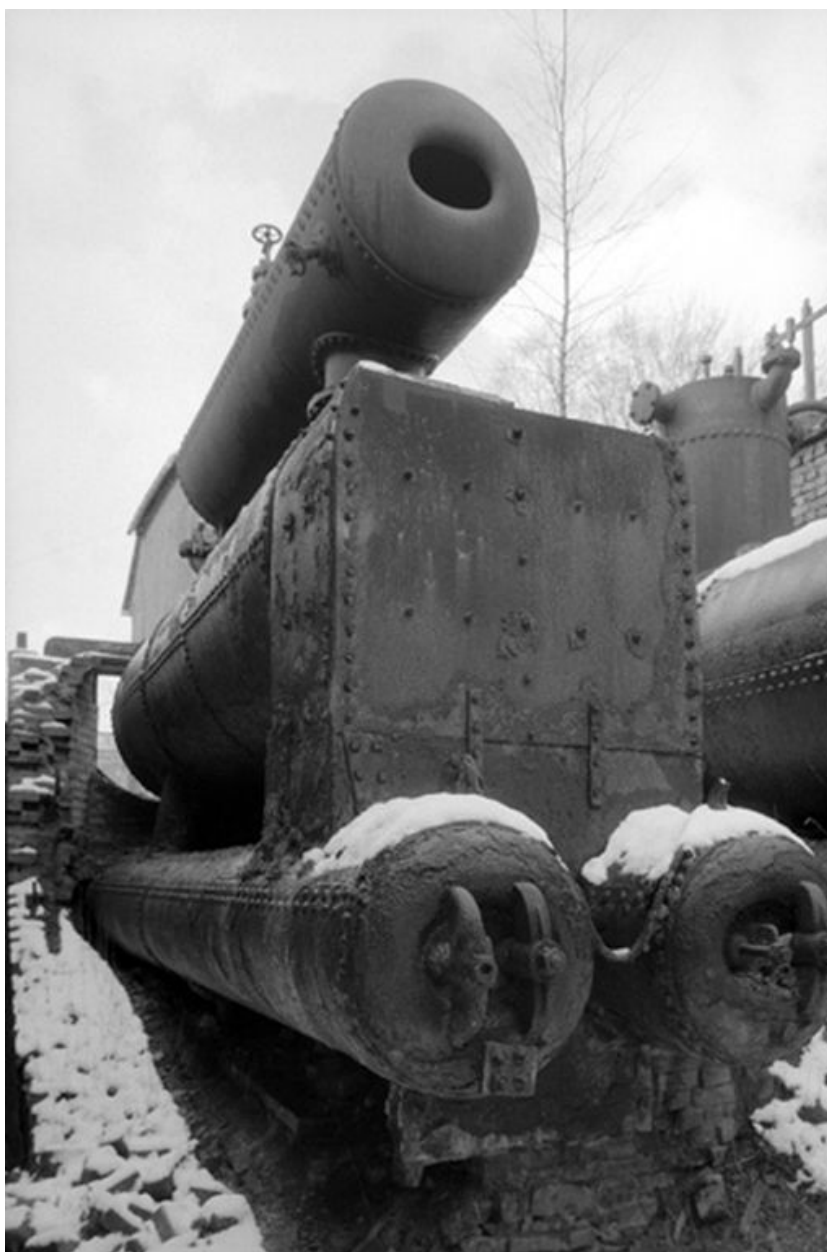
Chaufferie, chaudière à vapeur (Louis Fontaine).