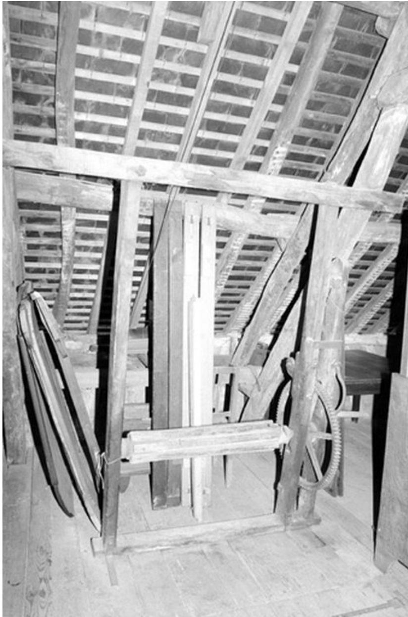
Atelier de fabrication, monte sacs (étage de comble).