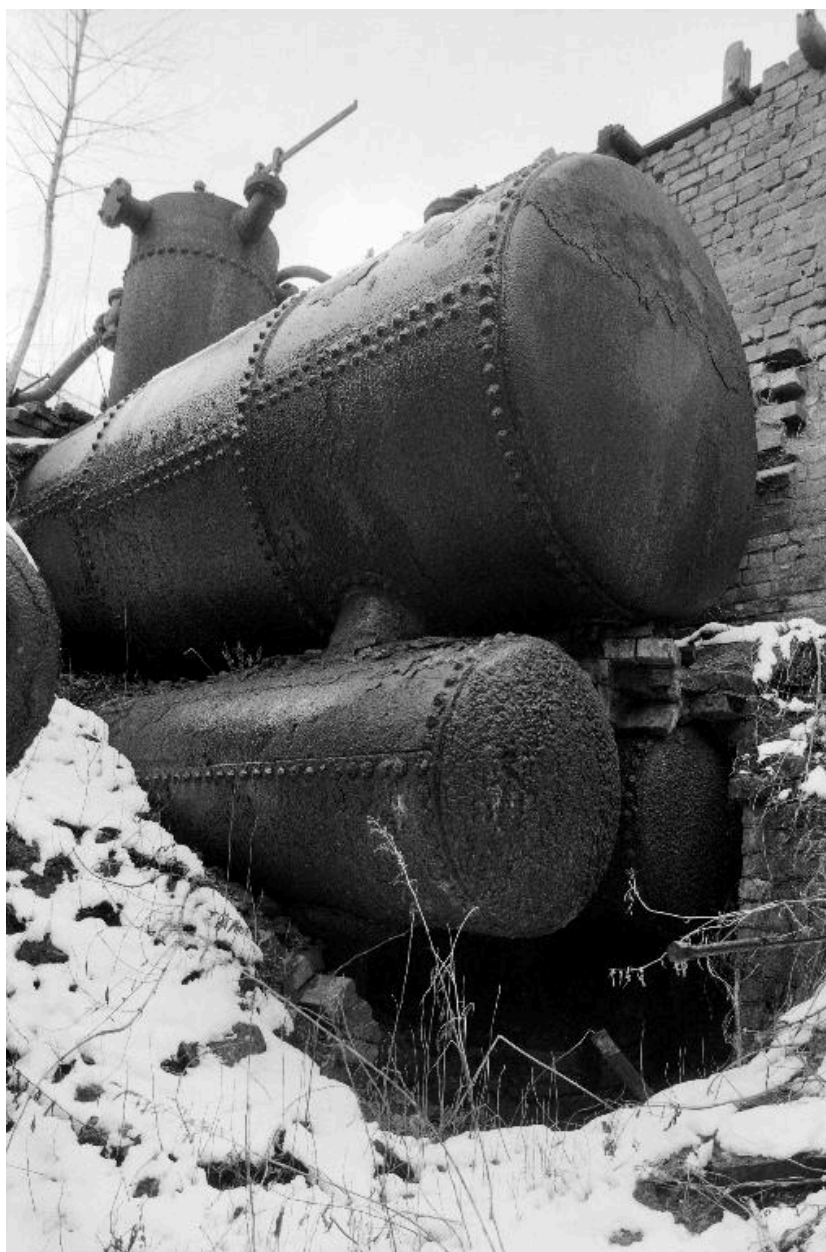
Chaufferie. Chaudière à vapeur (Veillet et Lescure).