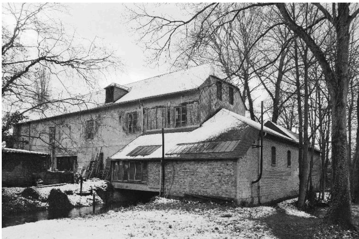
Atelier de fabrication, élévation postérieure.