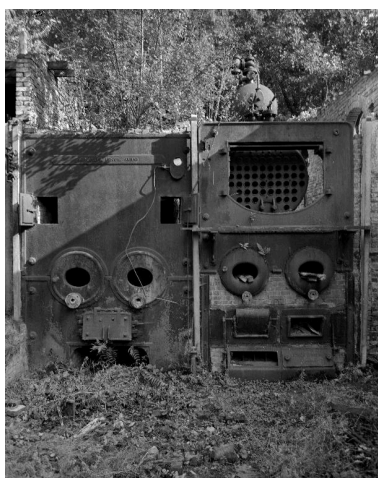
Chaufferie, chaudières à vapeur (constructeur : Veillet et Lescure Amiens et Louis Fontaine).