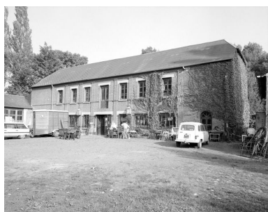
Atelier de fabrication, élévation antérieure. IVR22_19898000414X