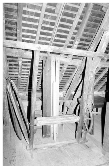
Atelier de fabrication, monte sacs (étage de comble). IVR22_19888000135Z