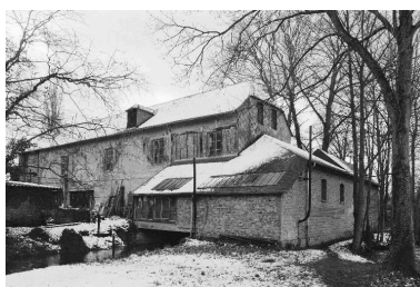
Atelier de fabrication, élévation postérieure. IVR22_19888000133Z