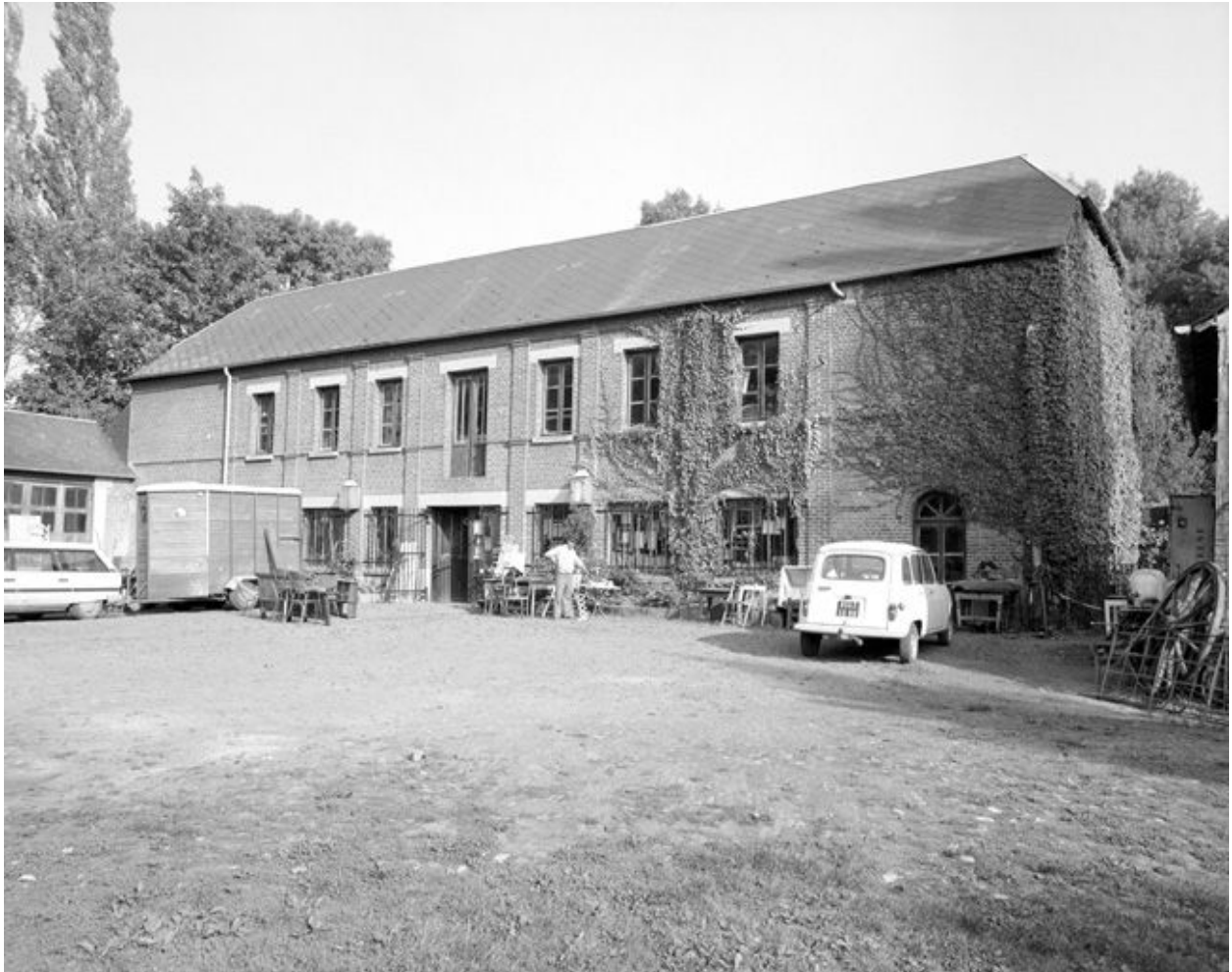
Atelier de fabrication, élévation antérieure.