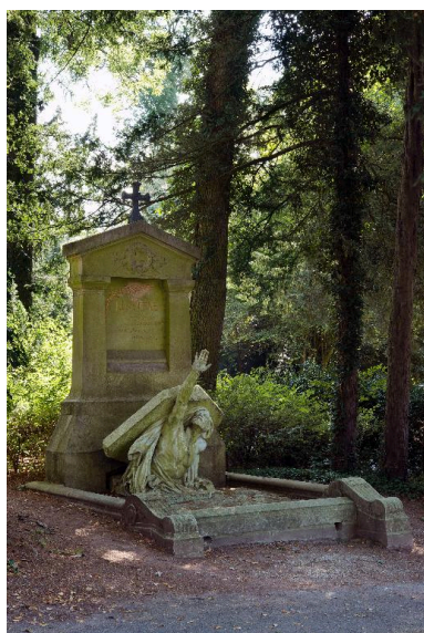
Vue générale.