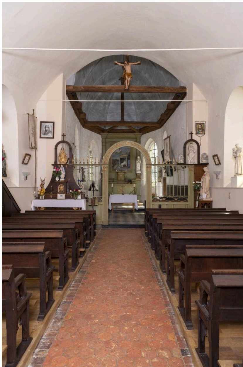
Vue vers le chœur.