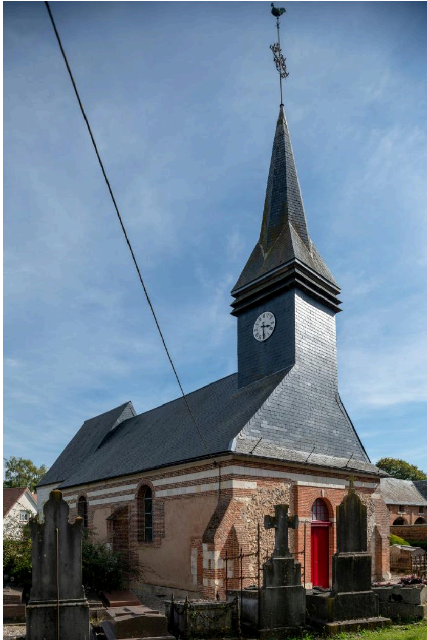
Vue depuis le nord-ouest.