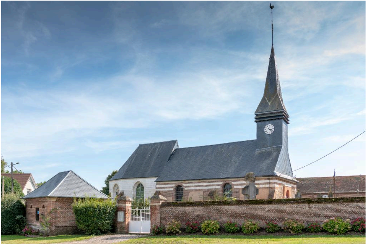
Vue d'ensemble de l'église, avec le bâtiment des pompes et l'entrée du cimetière (depuis le nord-ouest).