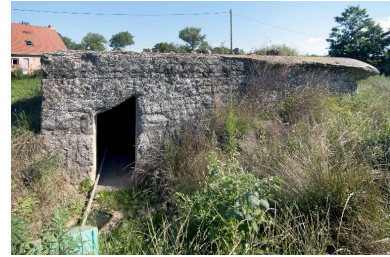
Elévation sud IVR31_20145904504NUCA