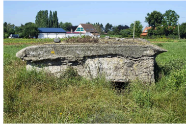
Vue générale vers l'ouest IVR31_20145904503NUCA