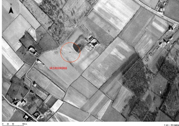
Situation de l'édifice sur une photographie aérienne du 13 Mars 1965. IVR32_20175901715NUCA