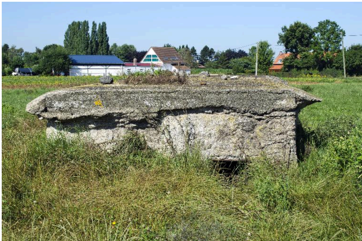
Vue générale vers l'ouest