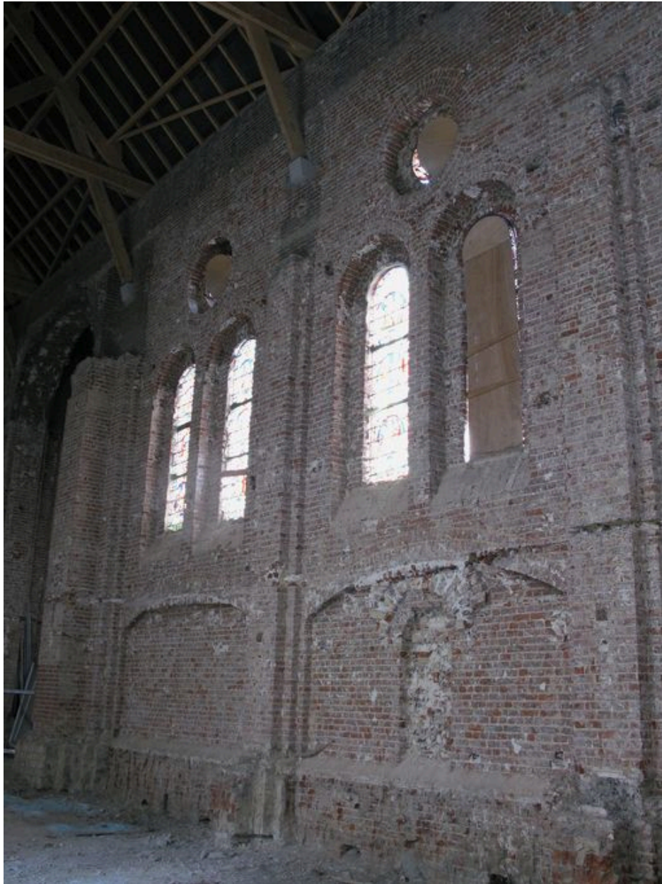
Mur sud de la nef