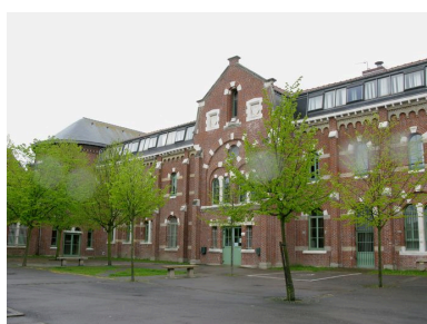
Vue du bâtiment du lycée accolé au mur nord de la chapelle dont le chœur est visible, à gauche