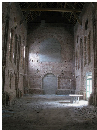
Nef depuis le chœur