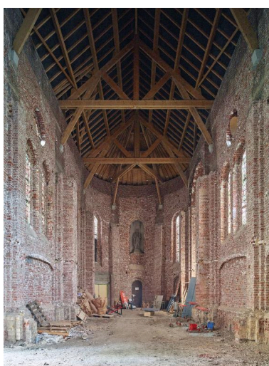
Vue générale de la nef, vers le chœur.