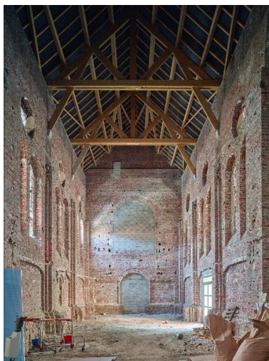
Vue générale de la nef, depuis le chœur.