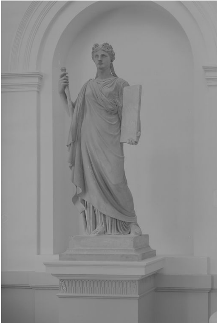
Statue représentant la Loi, par Sanson, 1873.