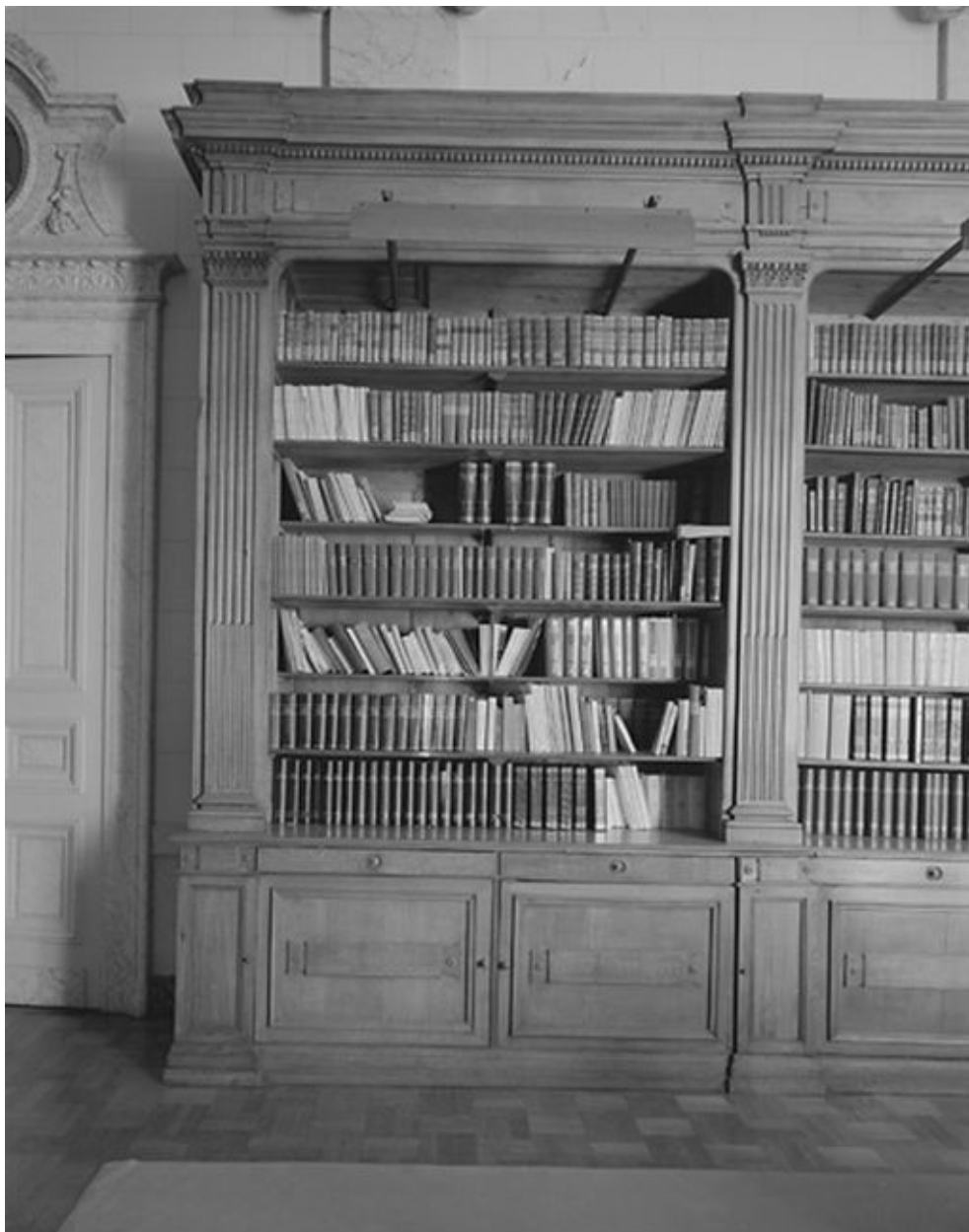
Bibliothèque, détail des rayonnages.