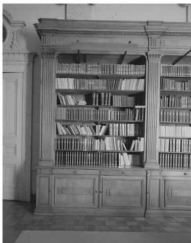
Bibliothèque, détail des rayonnages. IVR22_19978000886V