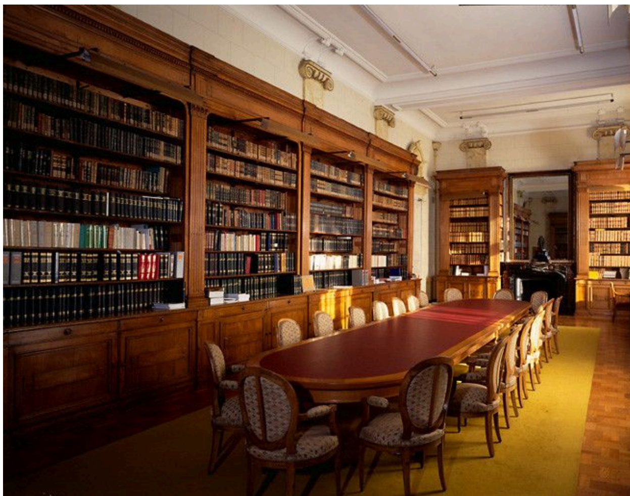
Vue générale de la bibliothèque.