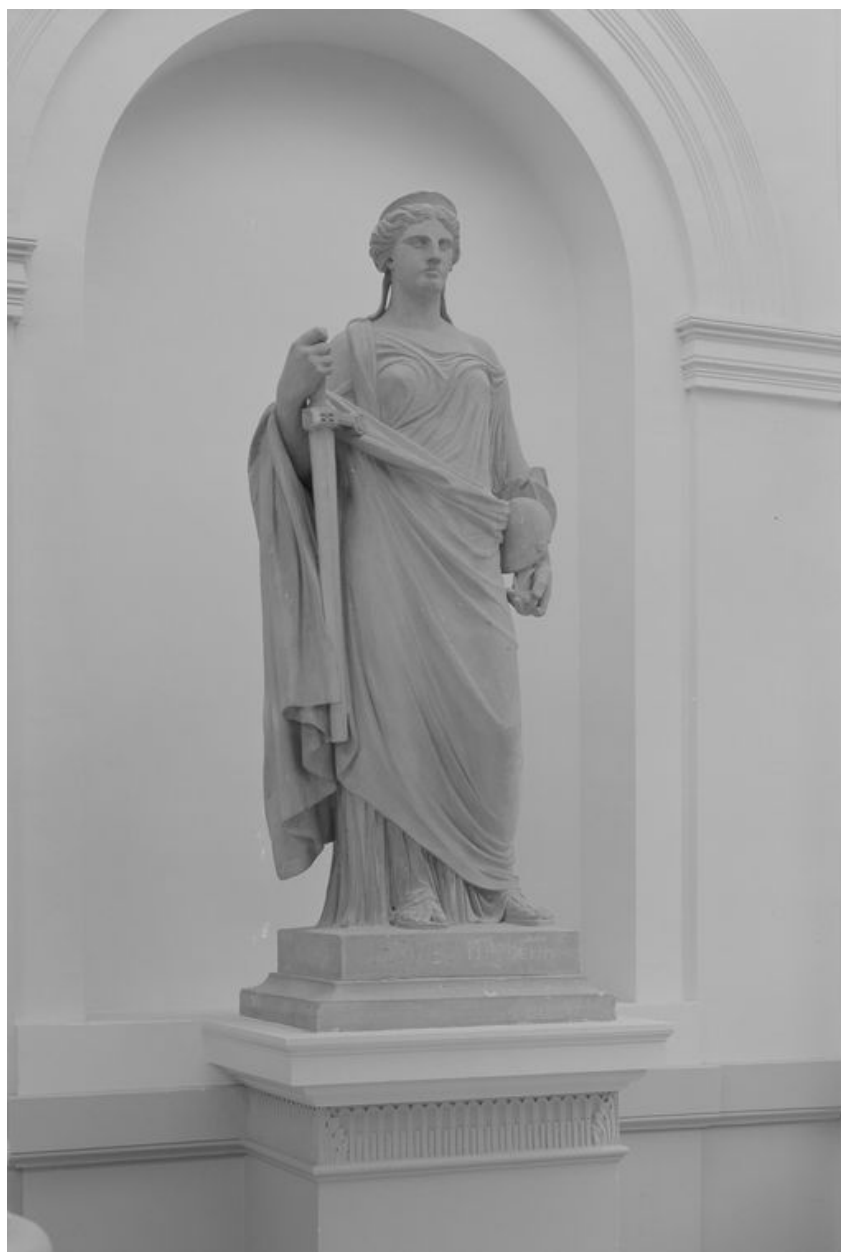
Statue représentant la Justice, par Sanson, 1873.