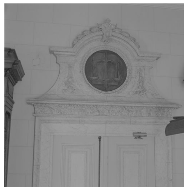
Vue de détail d'un dessus de porte (bibliothèque). IVR22_19978000918X