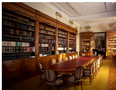
Vue générale de la bibliothèque.