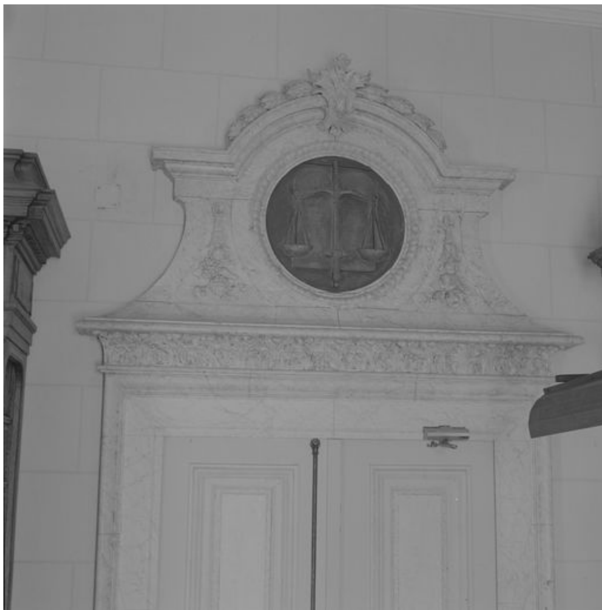
Vue de détail d'un dessus de porte (bibliothèque).