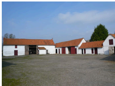
Vue générale. IVR22_20078005686NUCA