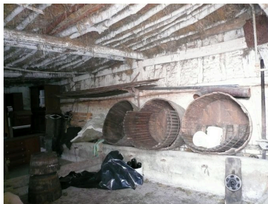
Vue intérieure de la partie étable située dans la grange.