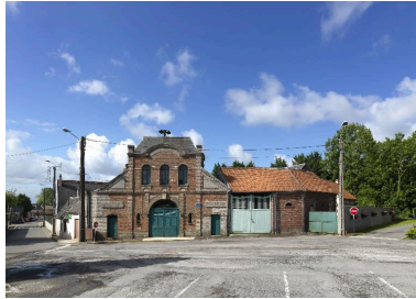
Vue d'ensemble. IVR22_20158000486NUC2A