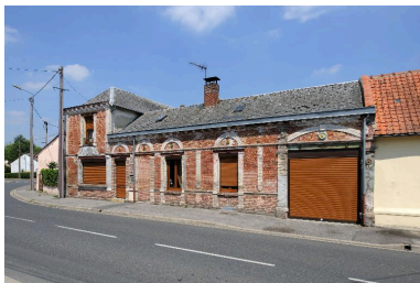
Vue d'ensemble sur rue. IVR22_20128000312NUC2A