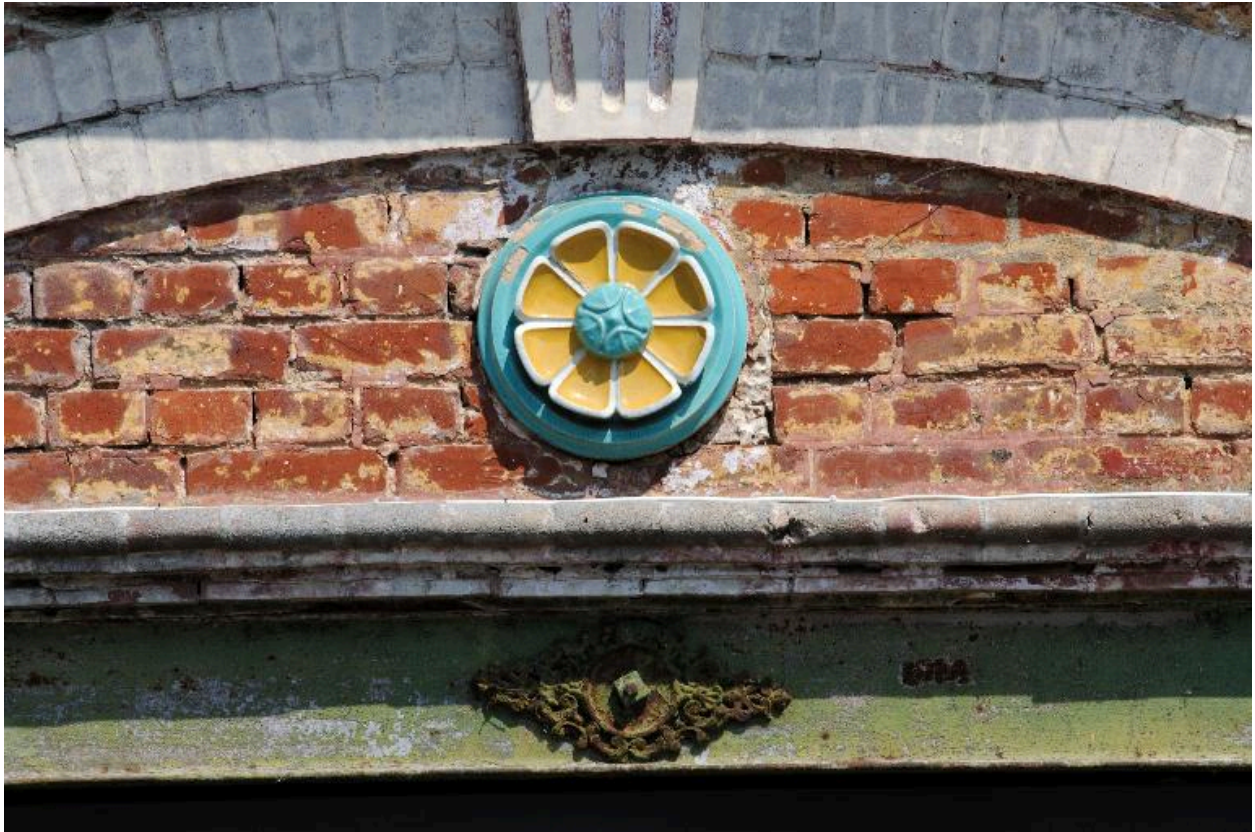
Détail du motif floral en céramique vernissée surmontant l'entrée charretière.