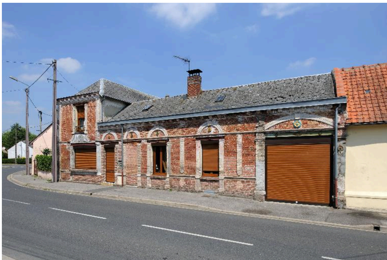
Vue d'ensemble sur rue.