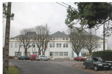
Vue actuelle de l'édifice. IVR22_20058002600NUCA