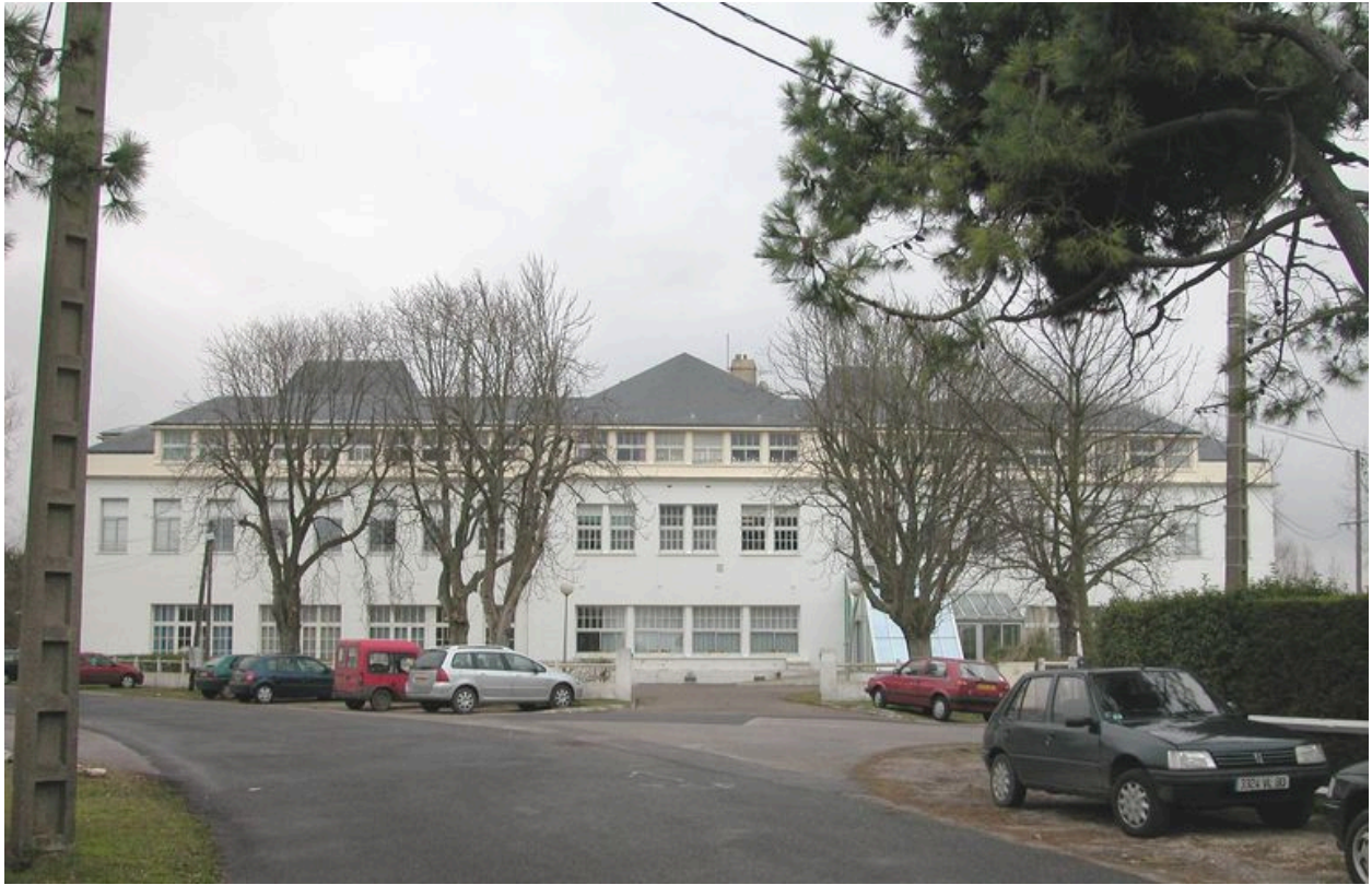
Vue actuelle de l'édifice.