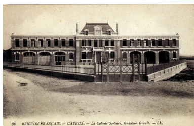
Vue d'ensemble, carte postale, 1er quart 20e siècle. IVR22_20058000496XAB