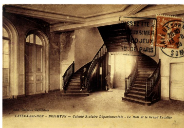
L'escalier de distribution intérieure, carte postale, 1er quart 20e siècle (coll. part.). IVR22_20058000497XAB