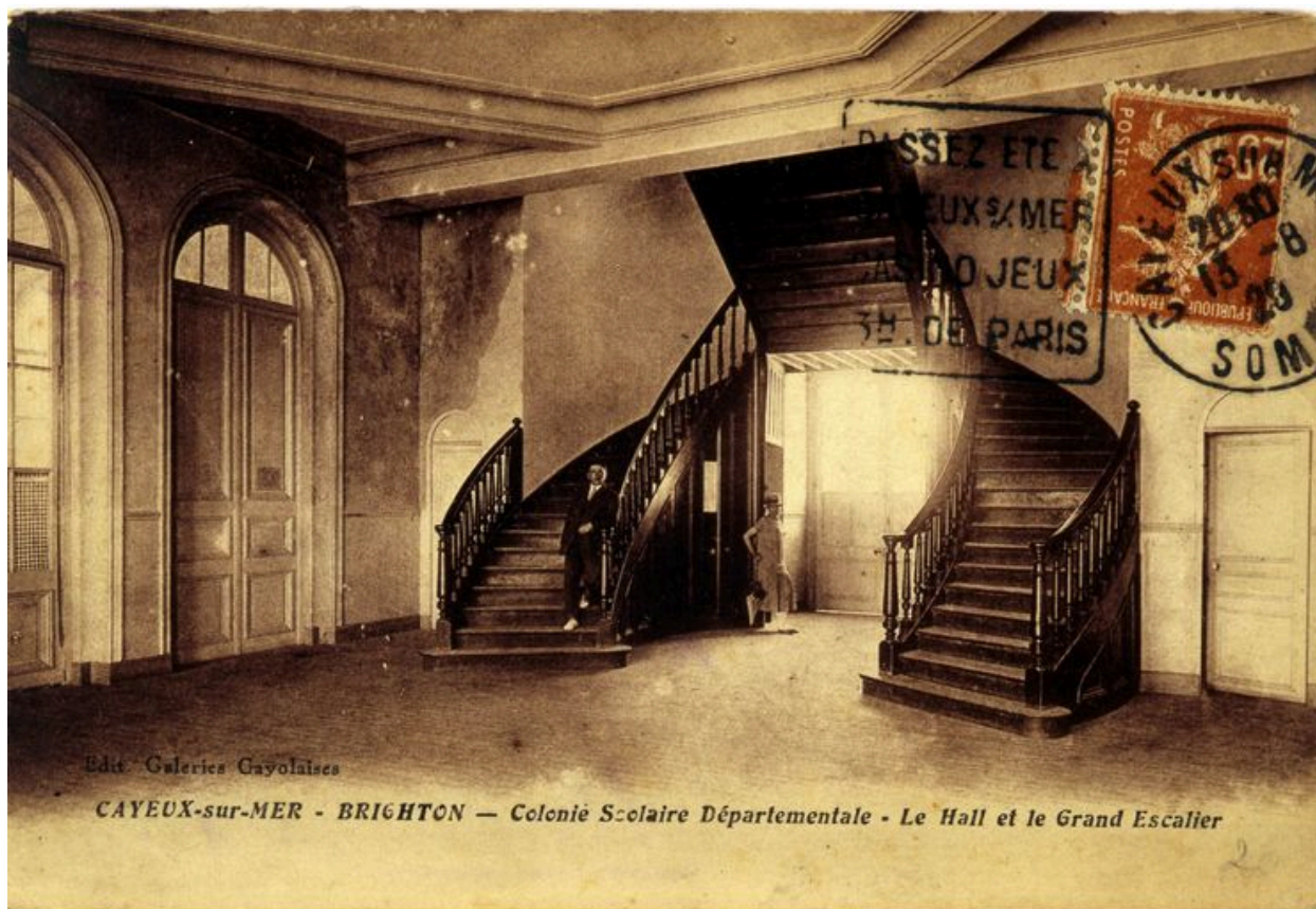
L'escalier de distribution intérieure, carte postale, 1er quart 20e siècle.