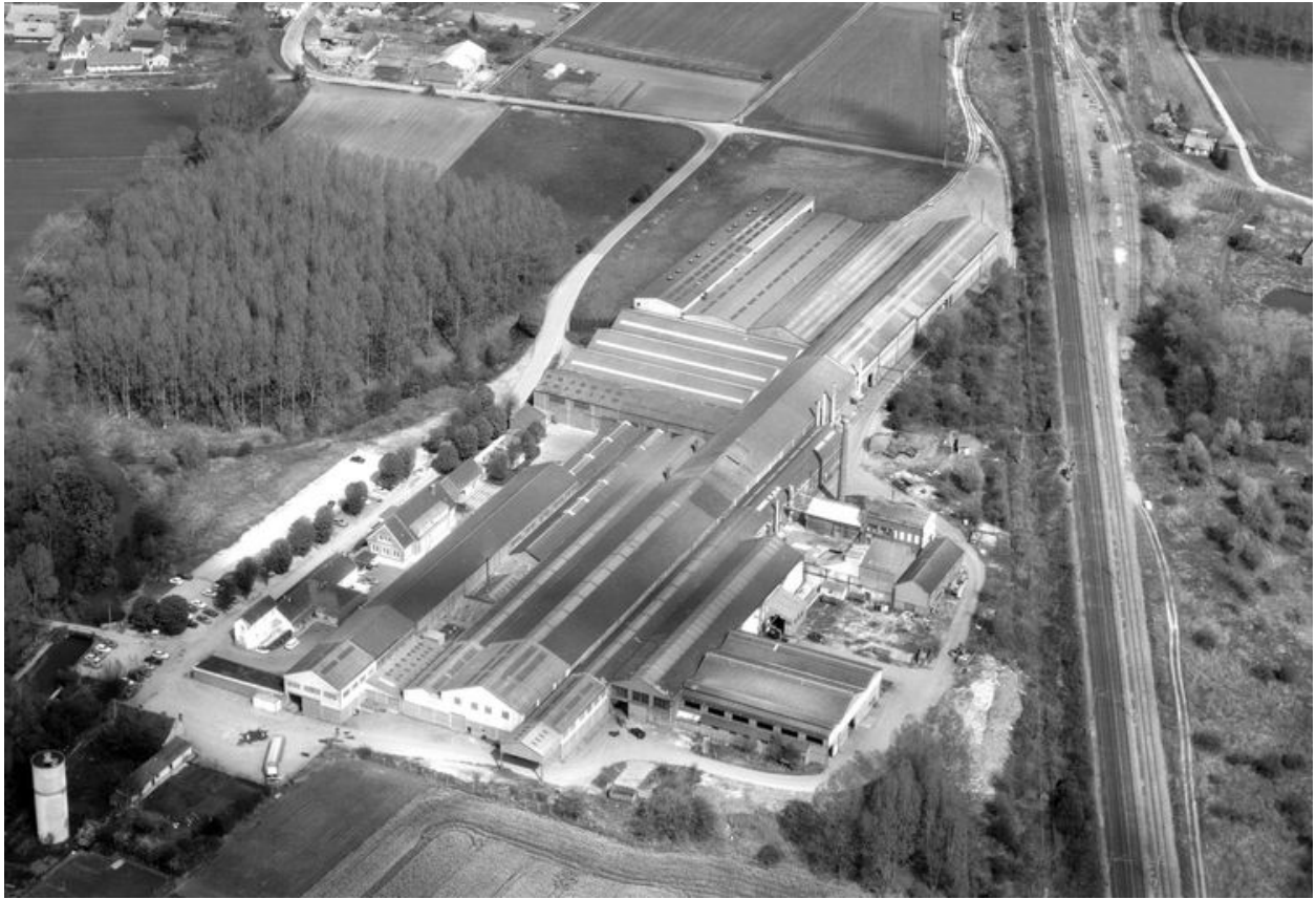
Vue aérienne, vue de l'ouest.