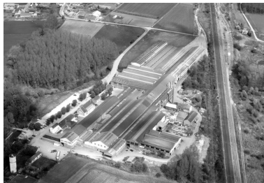
Vue aérienne, vue de l'ouest.