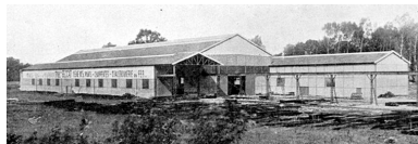
Vue générale de l'usine après sa reconstruction (Le Monde Illustré, 25 octobre 1921).