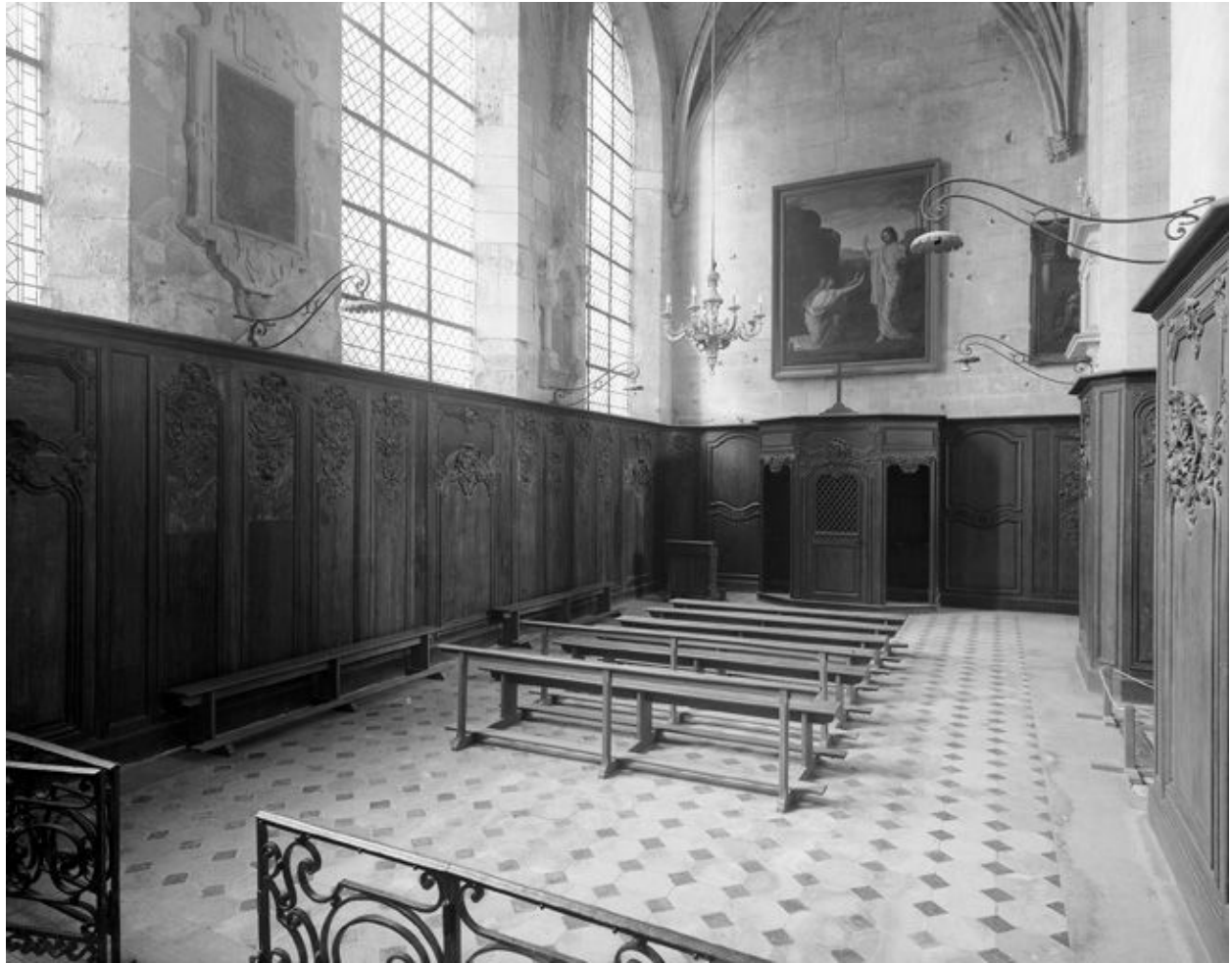
3e chapelle sud. Vue d'ensemble des murs sud et ouest.