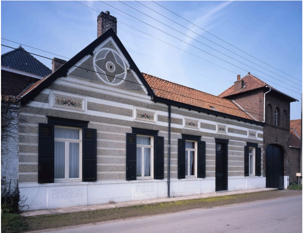
Vue générale de la façade en gravier roulé sur rue.