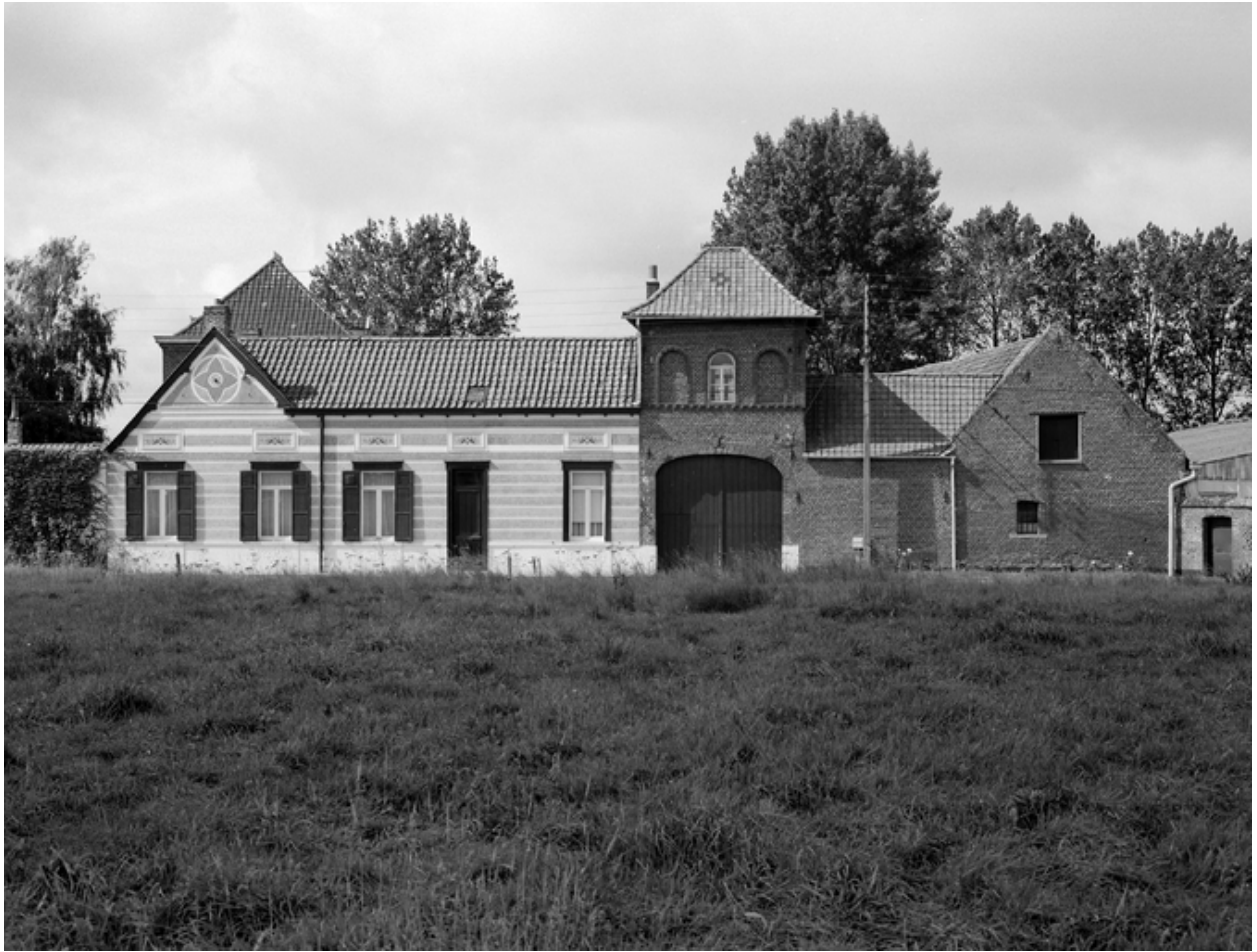
Vue générale de la façade sur rue.