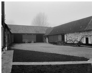
Grange, étables, écuries et porcherie, façades sur cour.