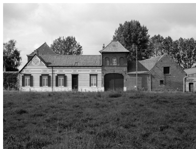
Vue générale de la façade sur rue.