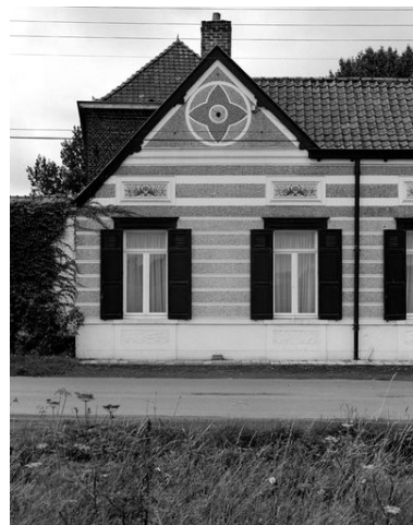
Détail de la façade sur rue du premier logis, cartouche en carreaux de céramique. IVR31_20045900432X