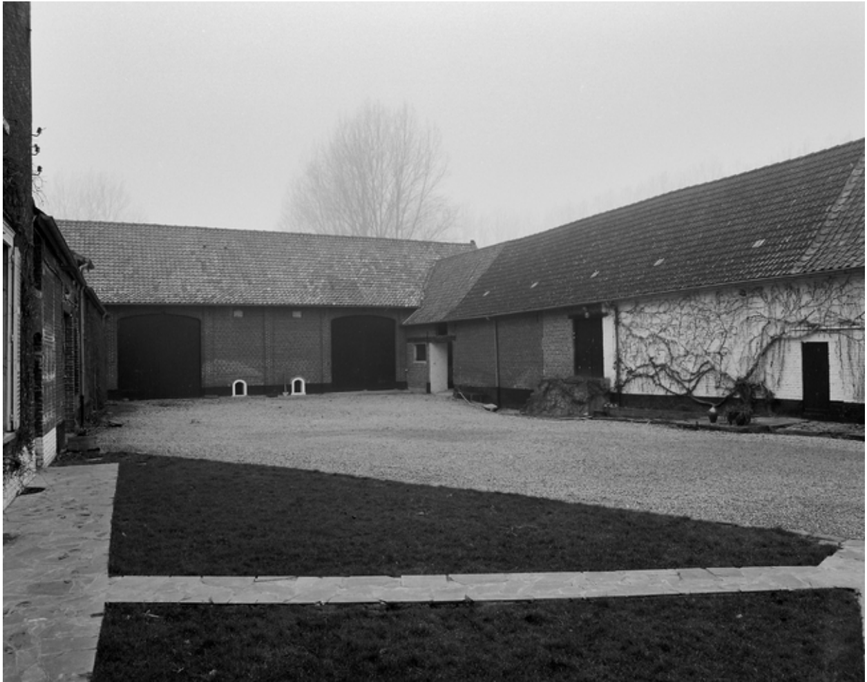
Grange, étables, écuries et porcherie, façades sur cour.