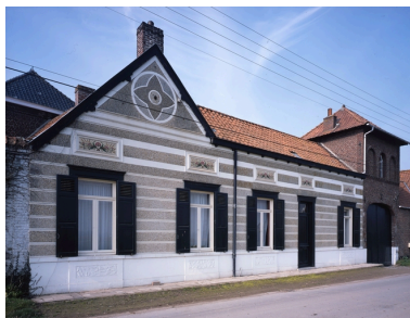
Vue générale de la façade en gravier roulé sur rue.