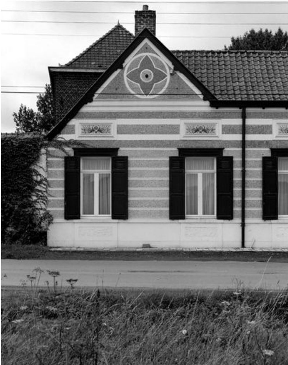
Détail de la façade sur rue du premier logis, cartouche en carreaux de céramique.