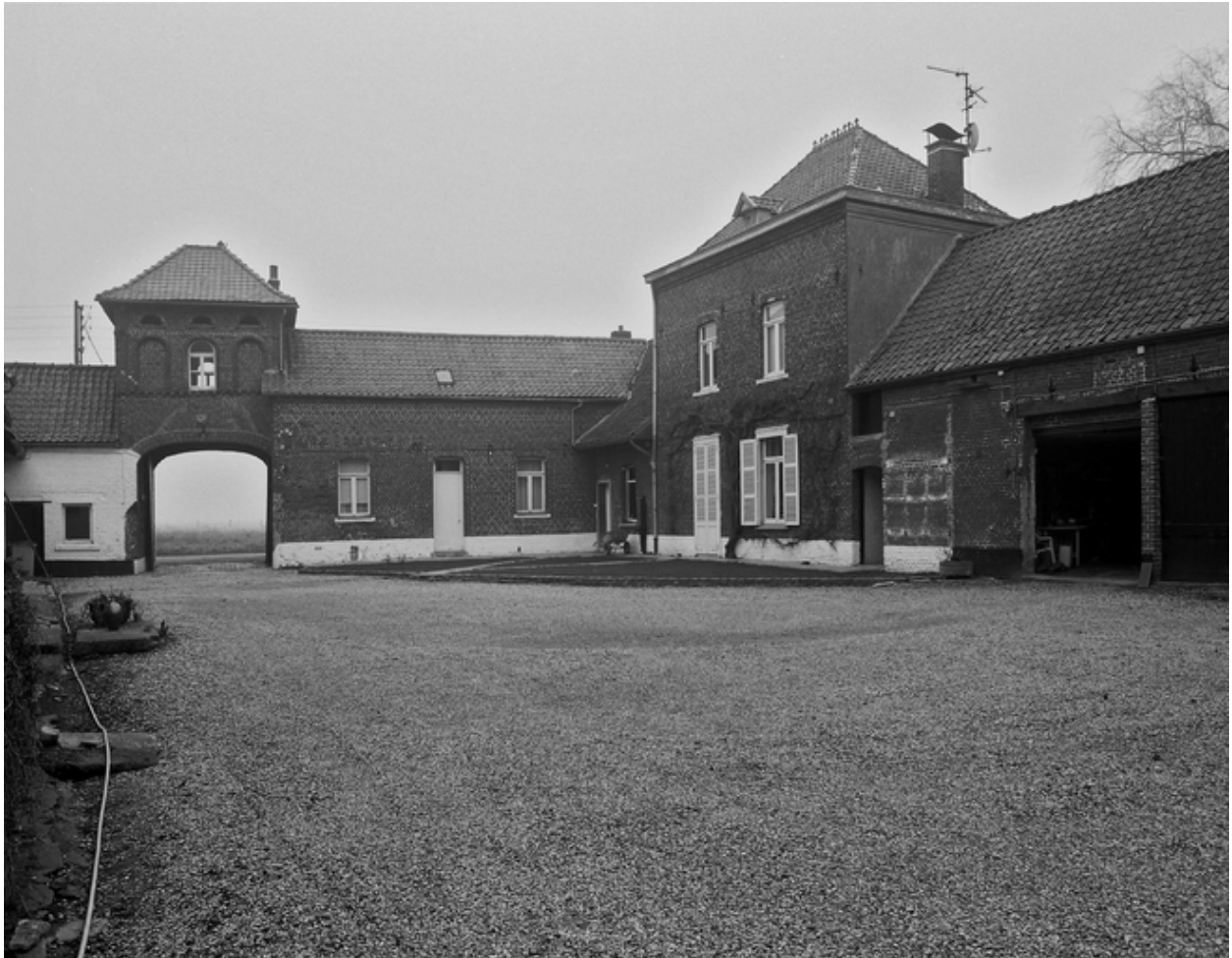
Vue des deux logis, façades sur cour.