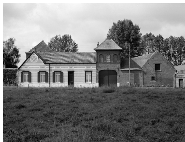
Vue générale de la façade sur rue. IVR31_20045900431X