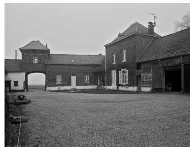
Vue des deux logis, façades sur cour.