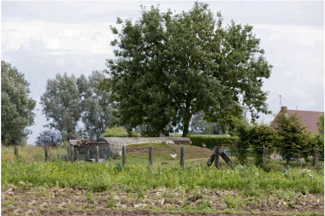
Vue générale vers l'est, depuis la rue du Plouïch