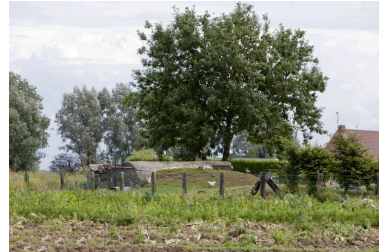
Vue générale vers l'est, depuis la rue du Plouïch IVR31_20145904358NUCA