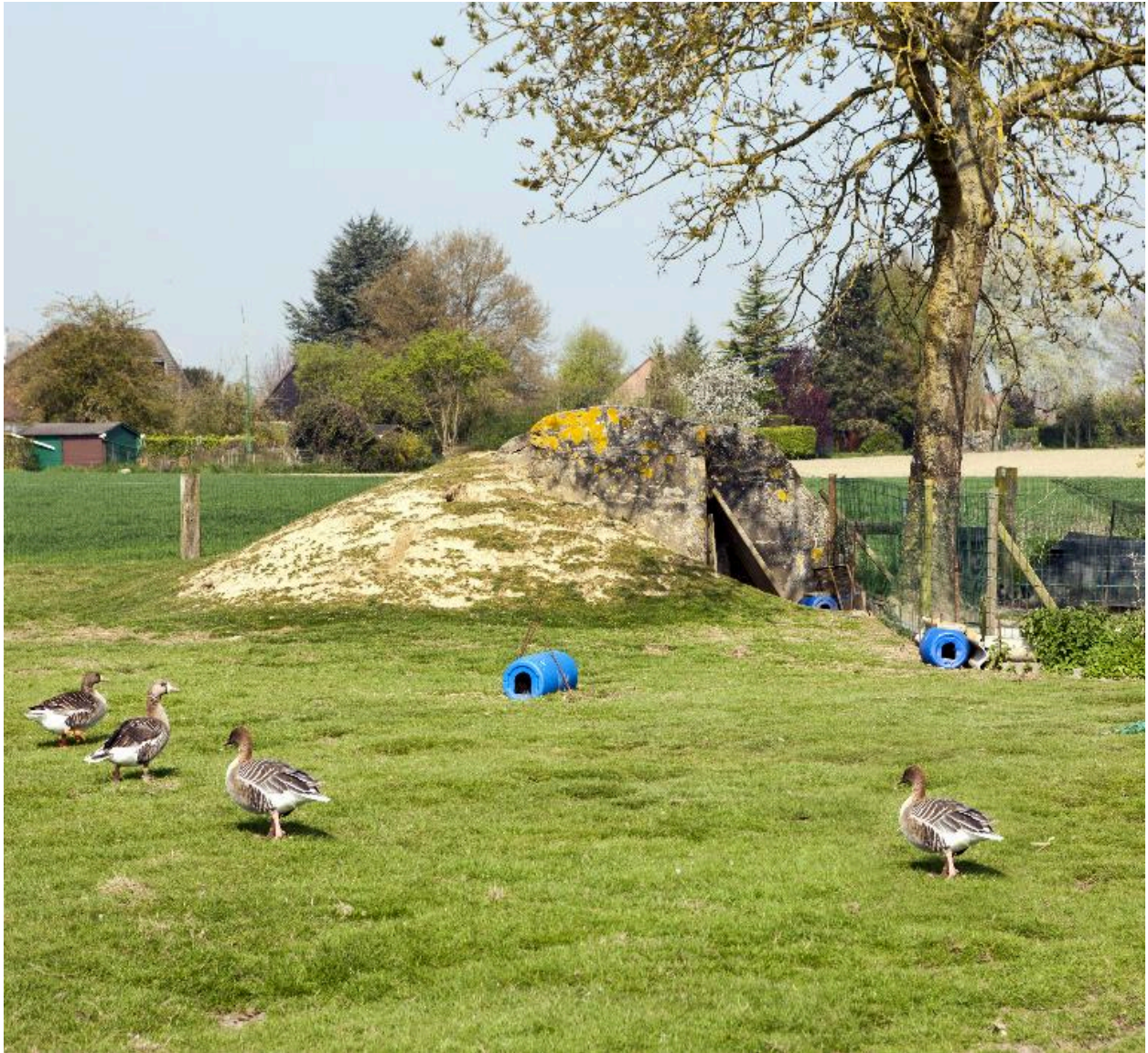
Casemate ouest, vers le nord-ouest