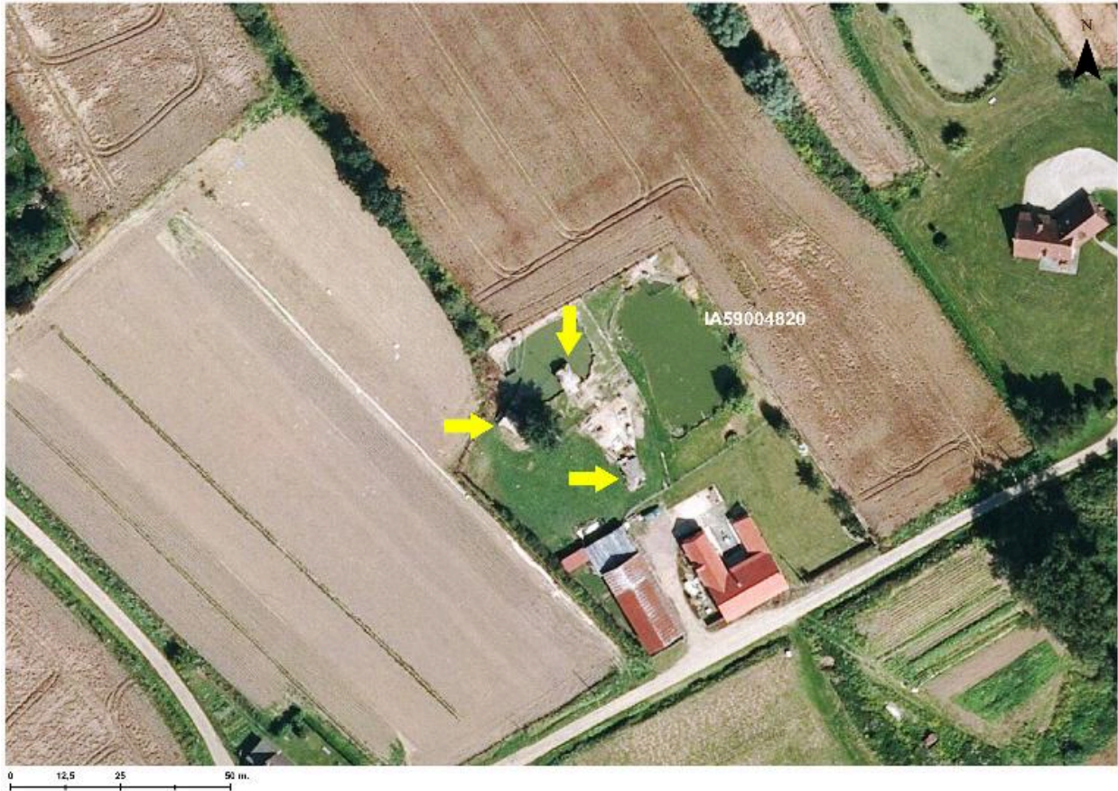
Situation des 3 casemates à personnel en 2014