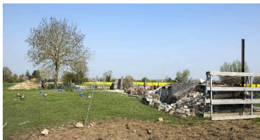
Les trois casemates, vers le nord-ouest