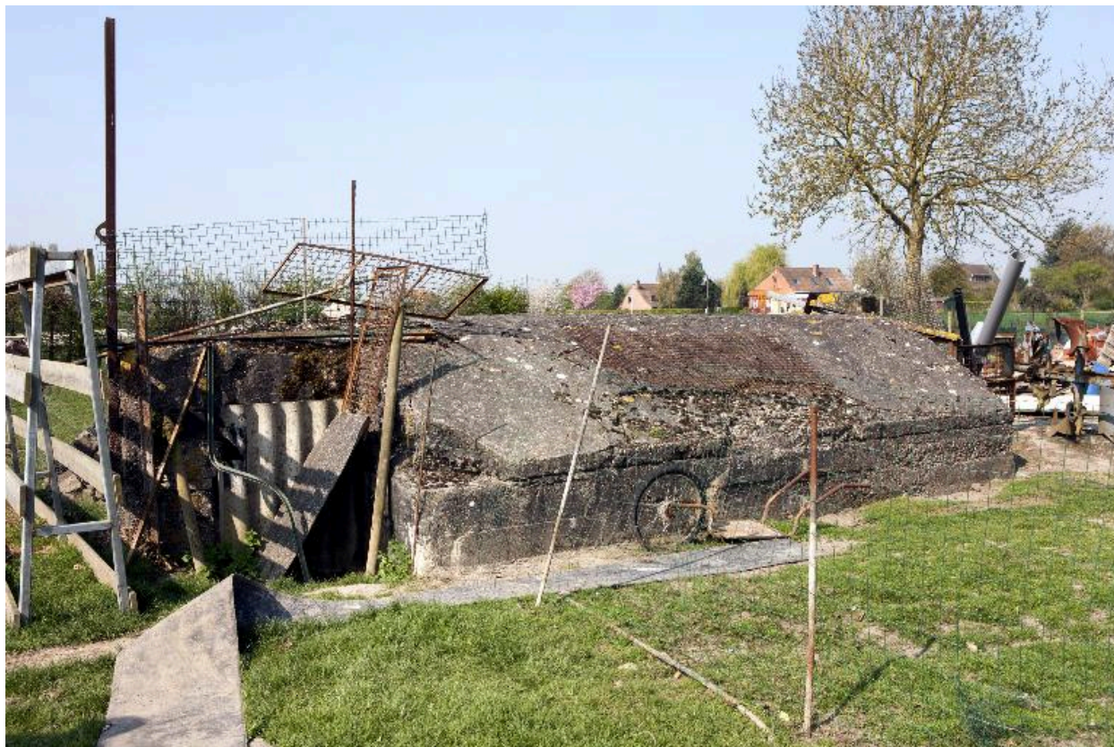
Casemate est, vers l'ouest