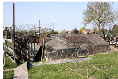
Casemate est, vers l'ouest IVR31_20155901189NUCA