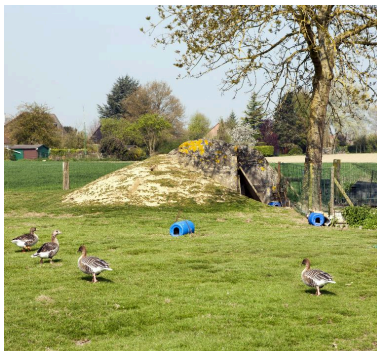
Casemate ouest, vers le nord-ouest