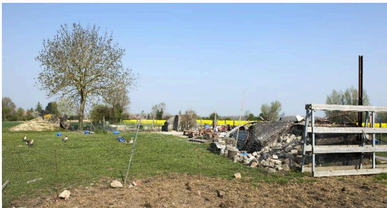
Les trois casemates, vers le nord-ouest