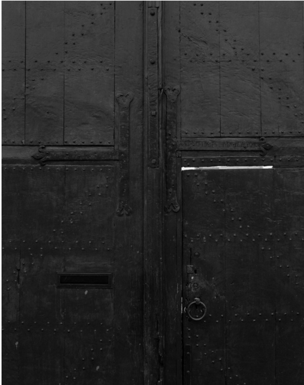
Détail de la porte charretière : ferrure signée et datée par l'artisan.