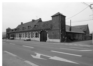
Vue générale de trois quarts depuis la rue. IVR31_20055900481X