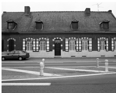
Élévation antérieure du logis. IVR31_20055900482X