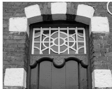
Détail de la porte : l'imposte vitrée et le linteau chantourné sculpté. IVR31_20055900483X