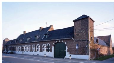
Vue générale de trois quarts depuis la rue.