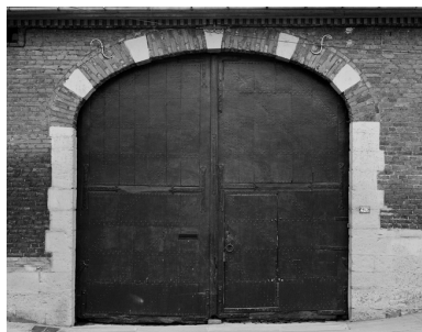
La porte charretière de l'élévation antérieure. IVR31_20055900484X