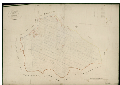
Situation sur le cadastre de 1830 (AD Nord : P31/ 624). IVR31_20055907393NUC