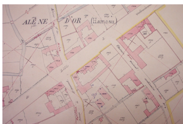
Situation sur le cadastre de 1912 (AD Nord P31/ 624). IVR31_20055907392NUCA