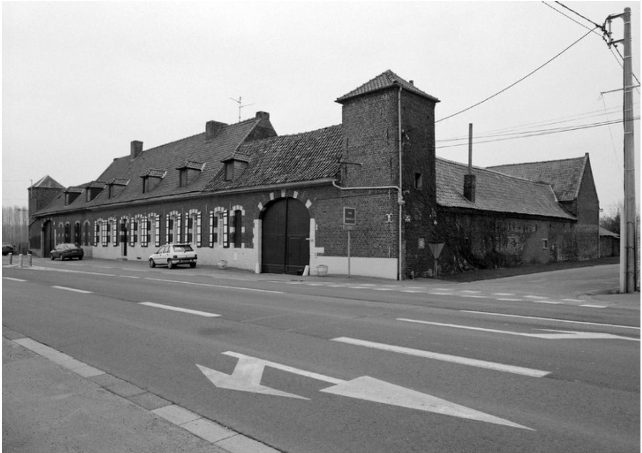
Vue générale de trois quarts depuis la rue.