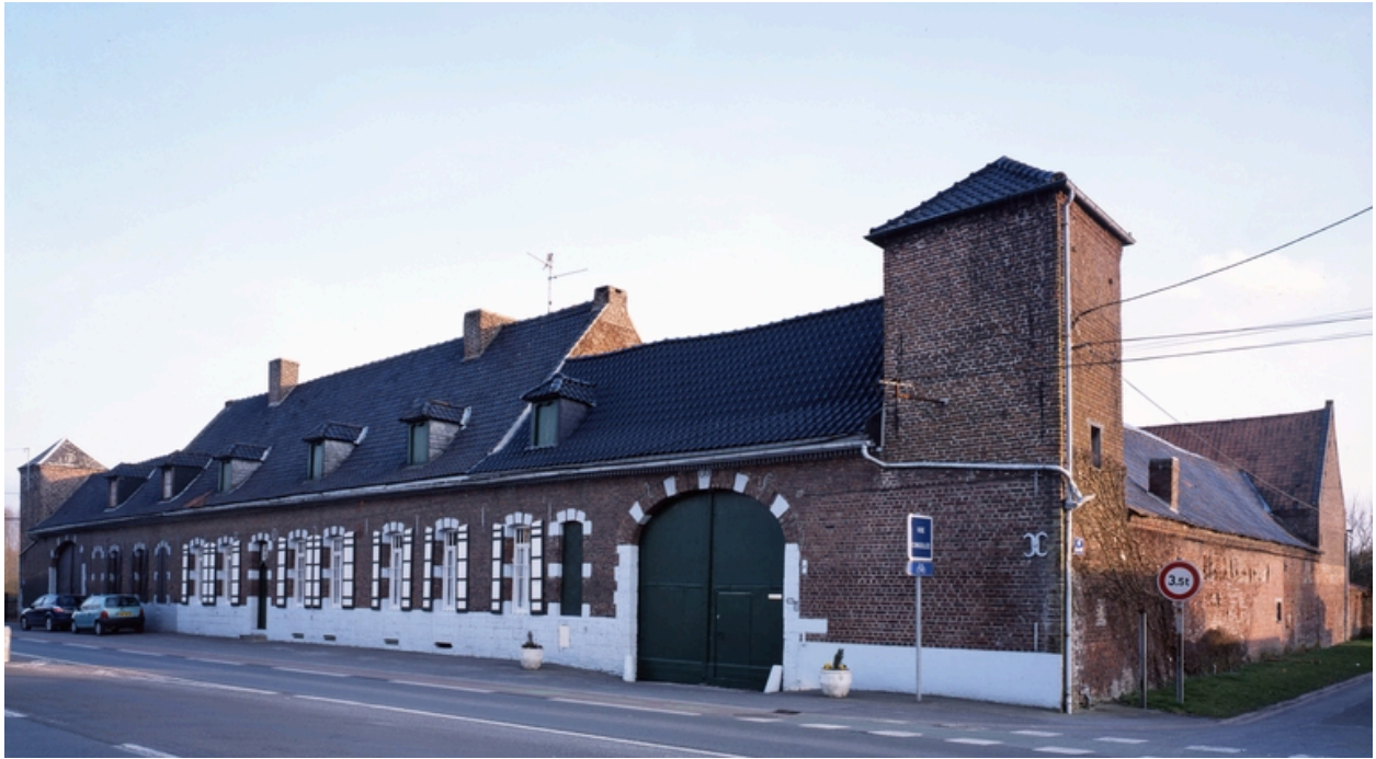
Vue générale de trois quarts depuis la rue.