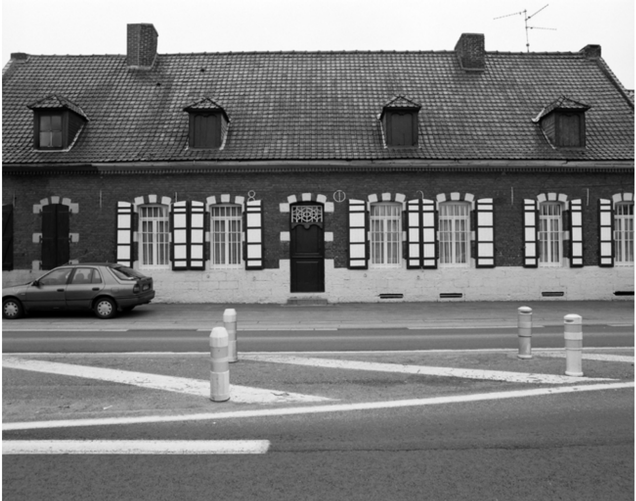
Elévation antérieure du logis.