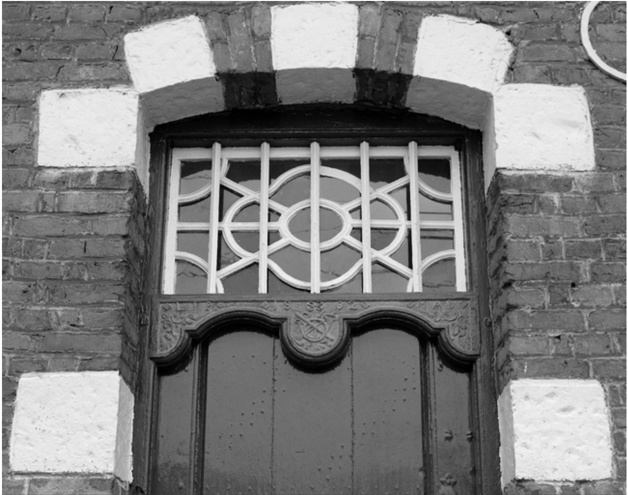
Détail de la porte : l'imposte vitrée et le linteau chantourné sculpté.