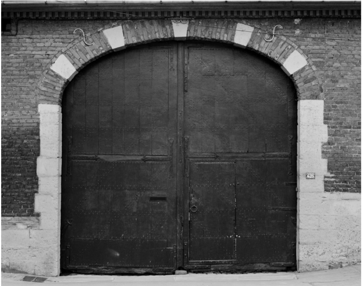
La porte charretière de l'élévation antérieure.