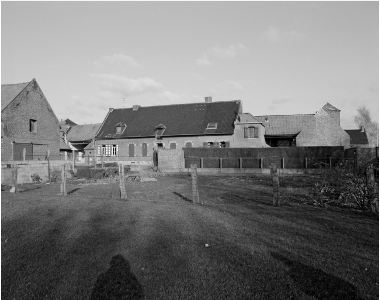
Vue générale de l'élévation postérieure.