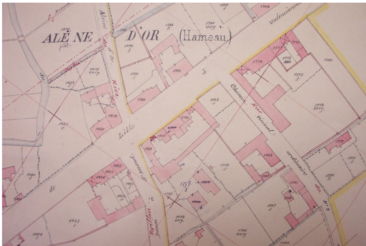
Situation sur le cadastre de 1912 (AD Nord P31/ 624).