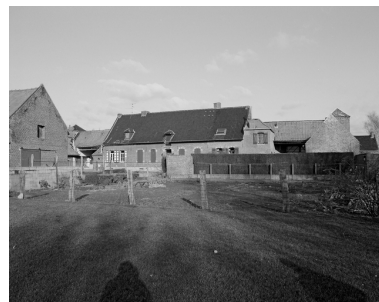
Vue générale de l'élévation postérieure.