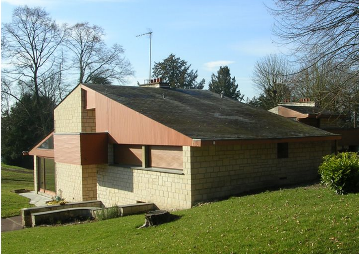
Une maison de la cité.