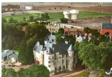
Construction d'une maison pour la société Usinor dans le parc du château de Montataire, début 1970 (AC Montataire).