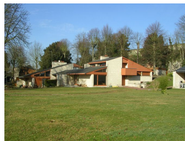
Logements construits à l'emplacement des jardins du château à partir de 1964.