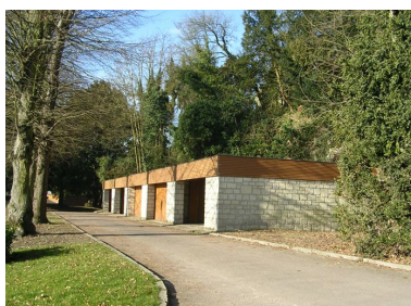
Garages de la cité. IVR22_20086005002NUCA