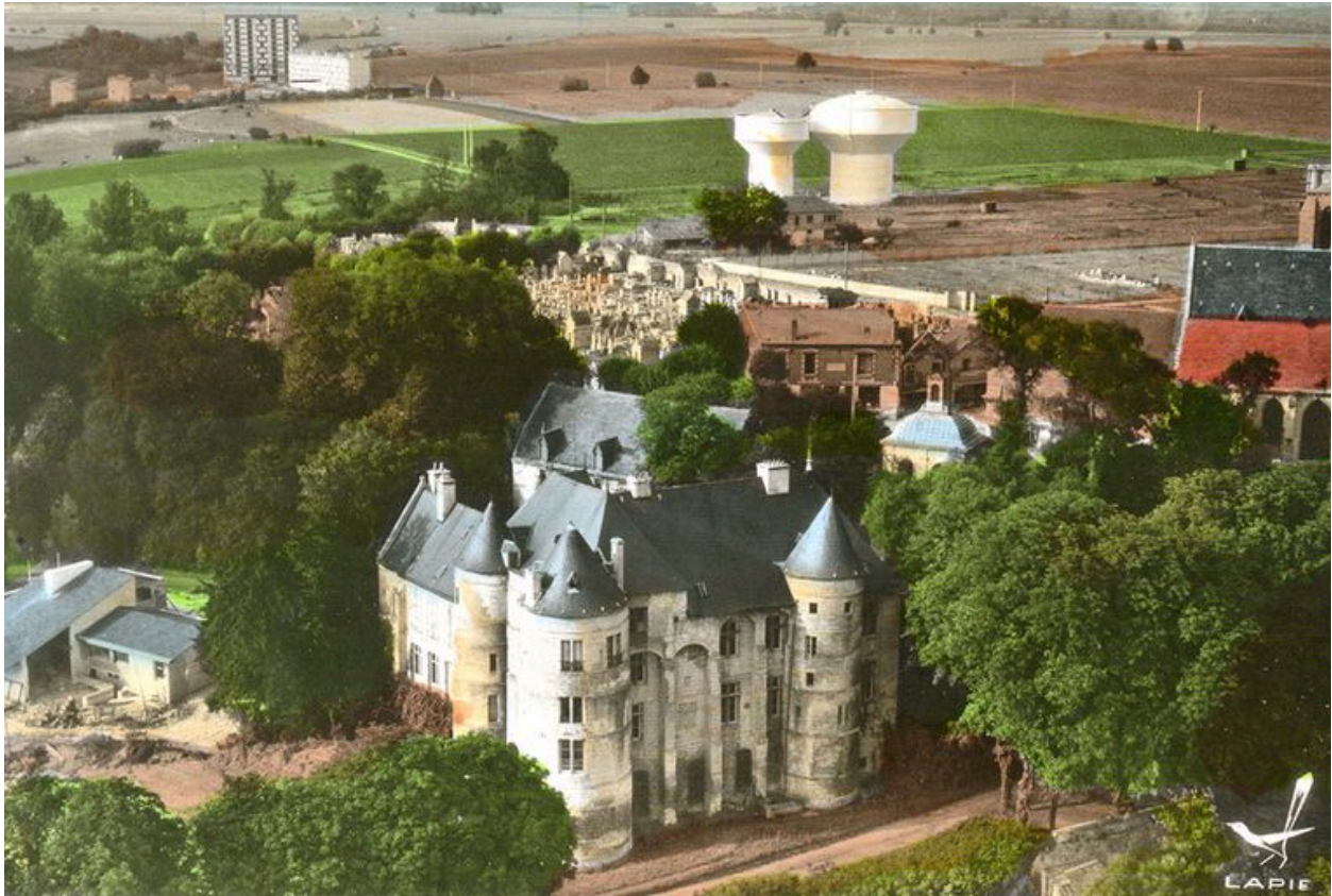
Construction d'une maison pour la société Usinor dans le parc du château de Montataire, début 1970.