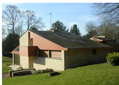
Une maison de la cité. IVR22_20086005001NUCA