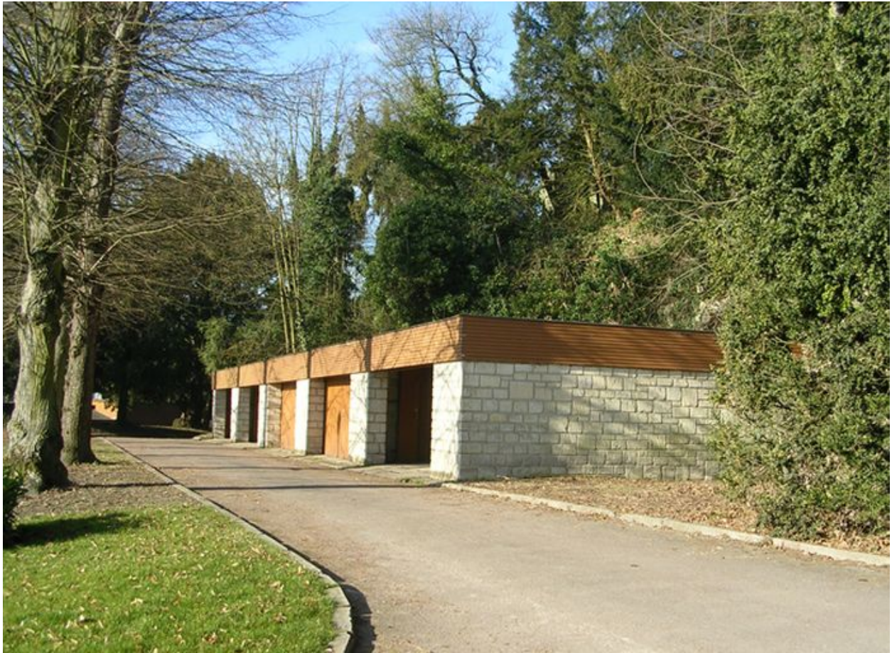
Garages de la cité.