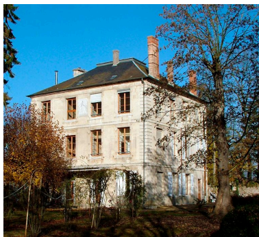
Vue de l'ancienne bibliothèque de l'abbaye, transformée en habitation.