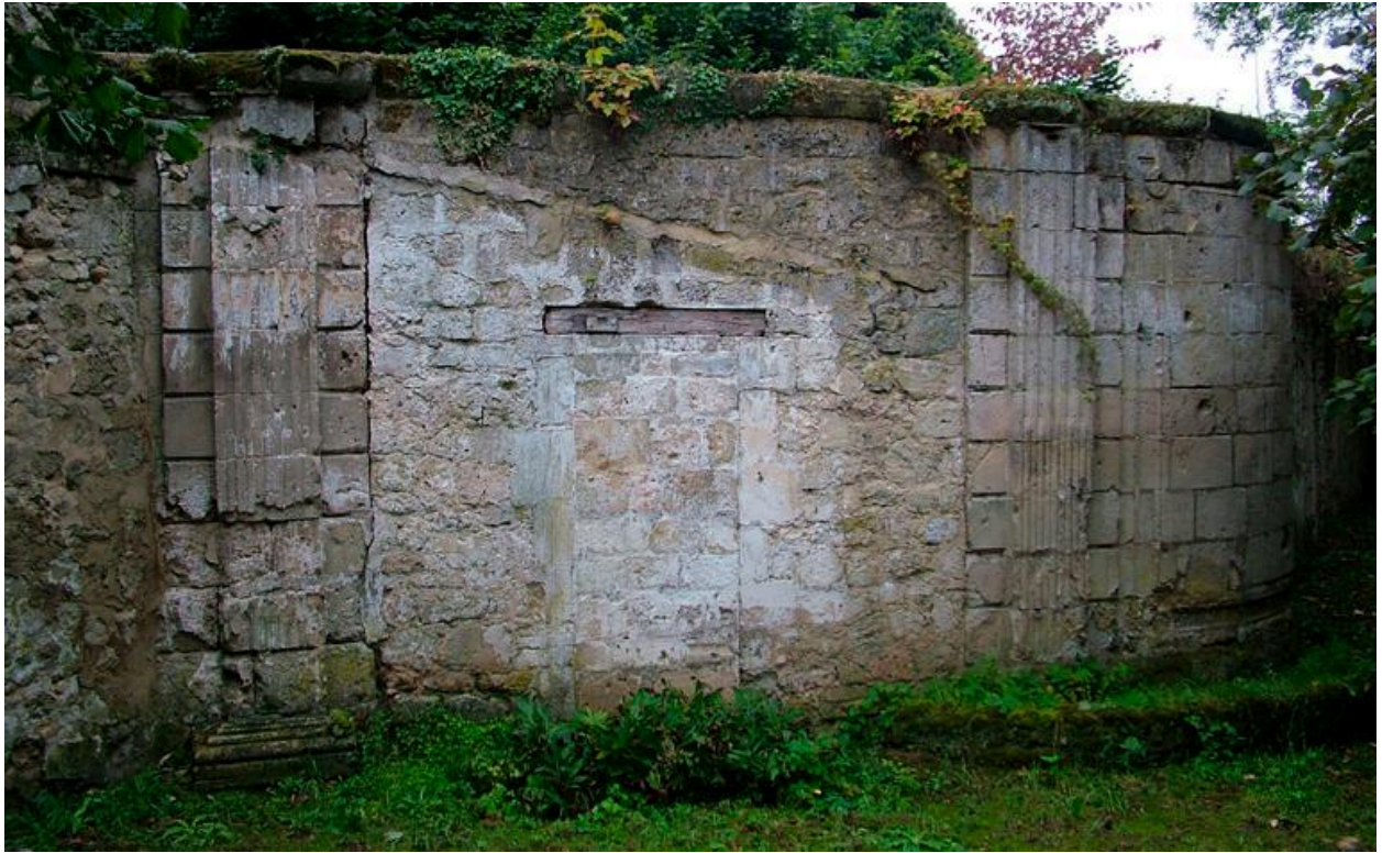
Vue de vestiges de l'ancien portail d'entrée en demi-lune de l'abbaye.