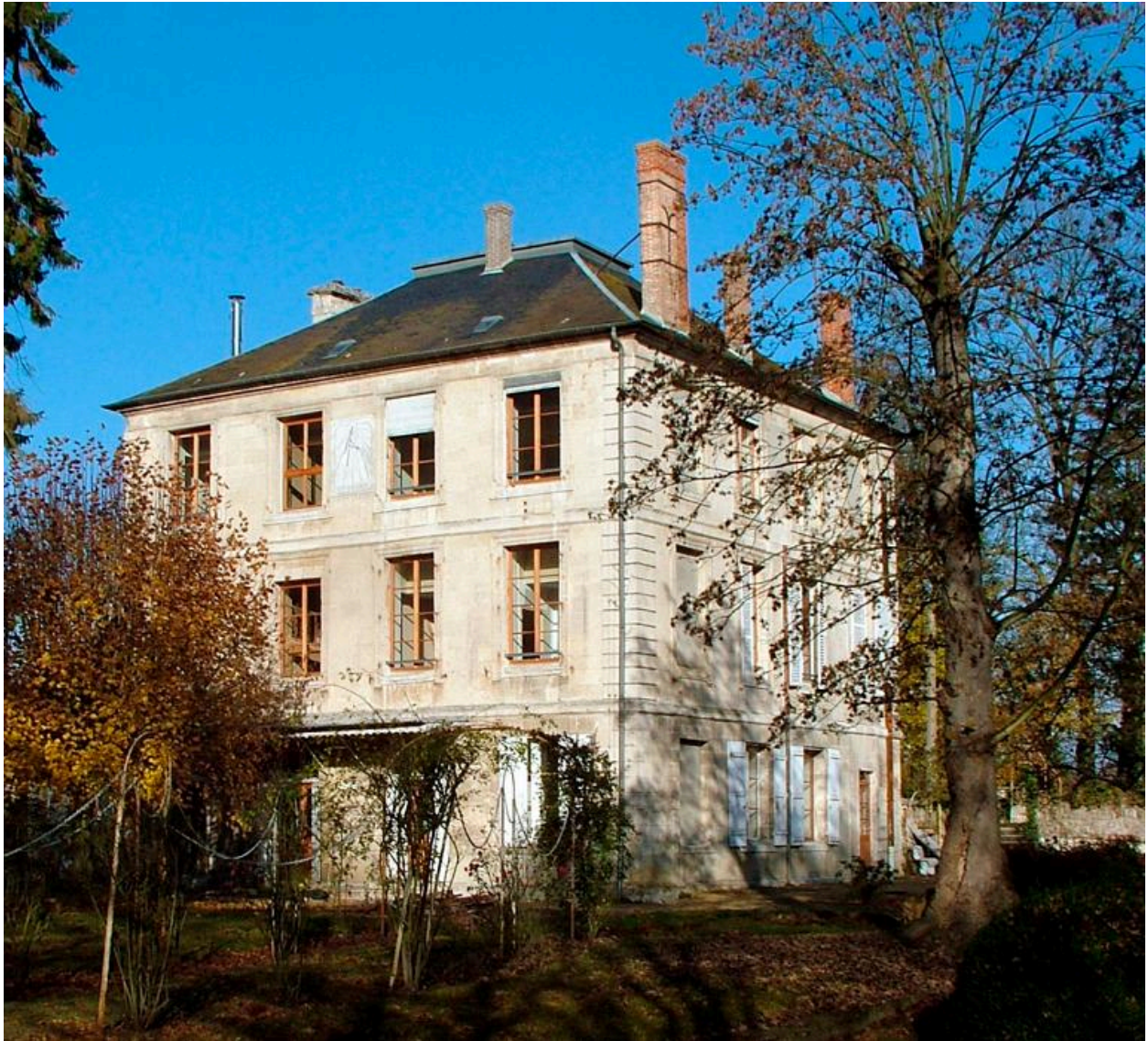
Vue de l'ancienne bibliothèque de l'abbaye, transformée en habitation.