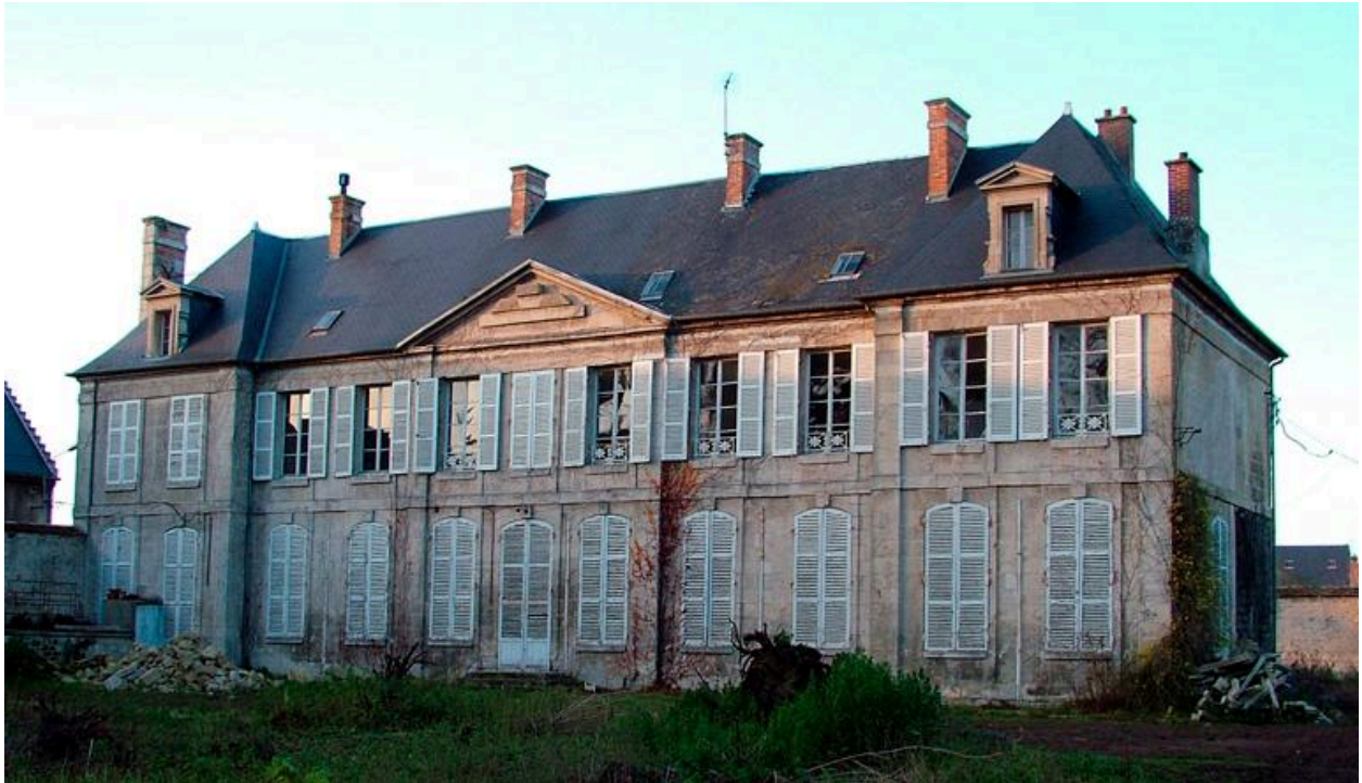
Vue de l'élévation sur le jardin du logis abbatial.