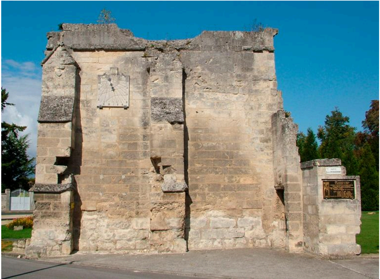
Vue de la face extérieure, avec ses contreforts du pignon de l'ancienne procure.