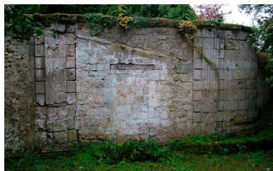
Vue de vestiges de l'ancien portail d'entrée en demi-lune de l'abbaye.

IVR22_20040202664NUC1A