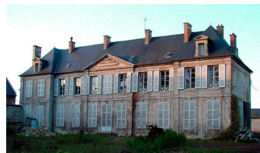
Vue de l'élévation sur le jardin du logis abbatial.