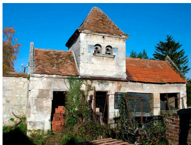
Vue des communs du logis abbatial.

IVR22_20040202664NUC1A