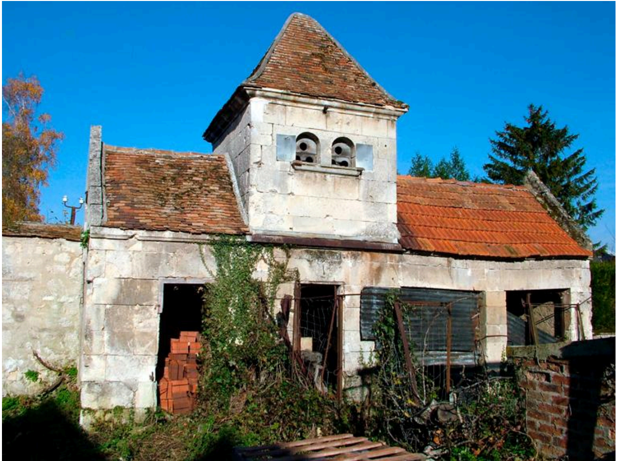
Vue des communs du logis abbatial.