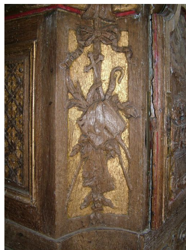
Détail du panneau concave gauche du tabernacle : trophée avec livre, croix, crosse et croix en sautoir, palme et rameau en sautoir, livre ouvert entouré d'une étoile.