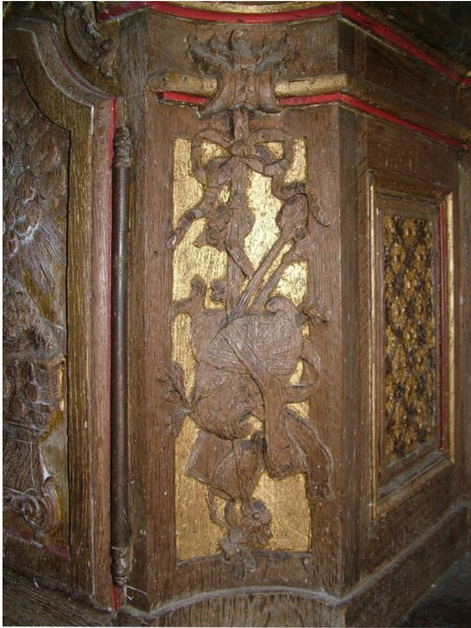
Détail du panneau concave droit du tabernacle : trophée avec aiguière, cartouche, étole, mitre, livre.